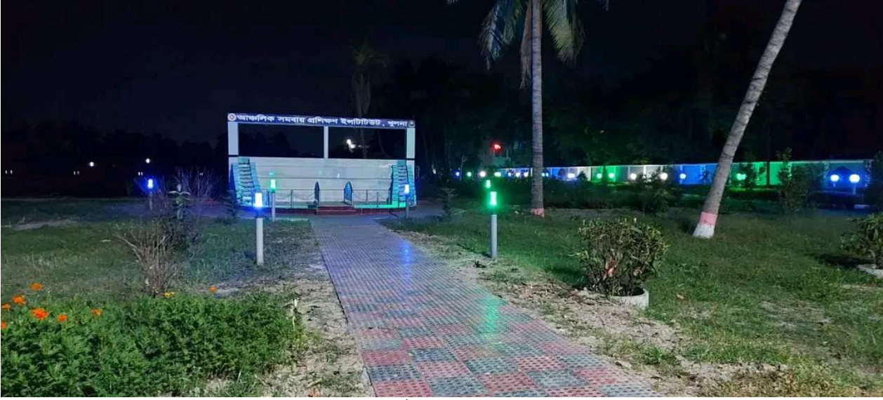
ফটো সেশন প্লেস