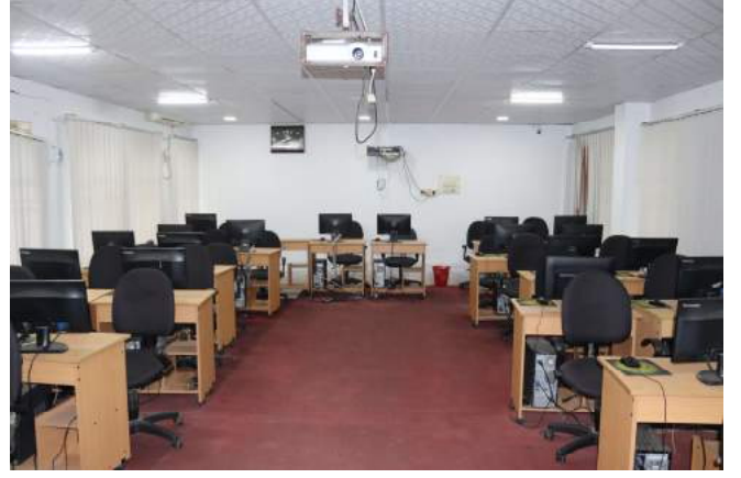
প্রশিক্ষণ কক্ষ ২ (কম্পিউটার ল্যাব)