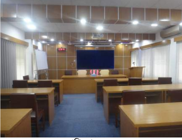
প্রশিক্ষণ কক্ষ ১