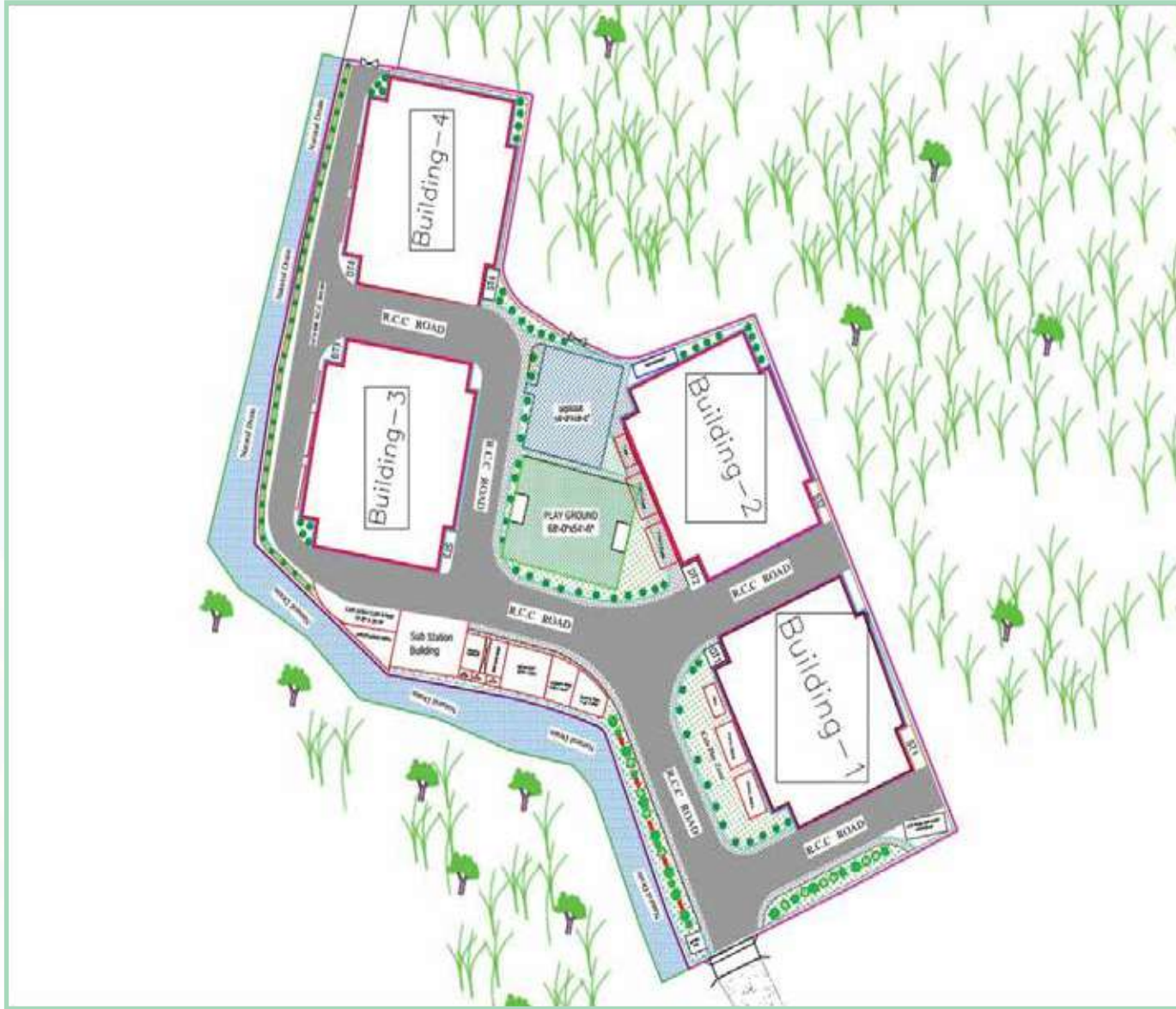
প্রকল্পের লে-আউট প্ল্যান