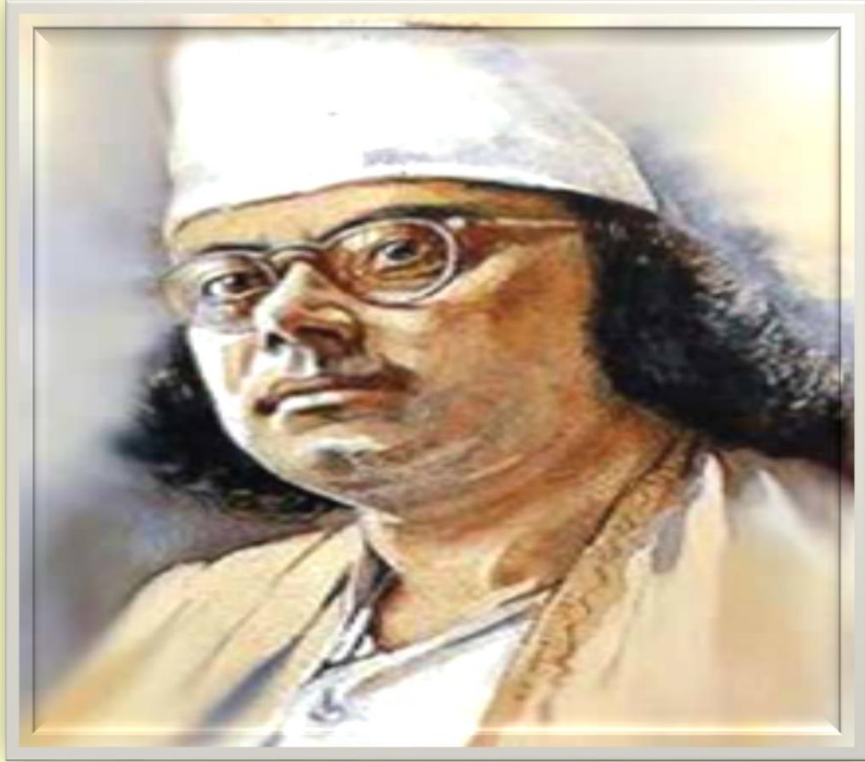
-কাজী নজরুল ইসলাম

‘ওরে নিপীড়িত, ওরে ভয়ে ভীত শিখে যা আয়রে, আয়। দুঃখ জয়ের নবীনমন্ত্র- ‘সমবায়, সমবায়!’ ক্ষুধার জ্বালায় মরেছি সুধার কলস থাকিতে ঘরে! দারিদ্র্য, ঋণ, অভাবে জ্বলেছি না চিনে পরস্পরে! মিলিত হইনি তাই আমাদের দুর্গতি ঘরে ঘরে! সেই দুর্গতি-দুর্গ ভাঙিব সমবেত পদঘায়॥ মিলি পরমাণু পর্বত হয় সিঞ্চ বিন্দু মিলে, মানুষ শুধুই মিলিবে না কি রে মিলনের এ নিখিলে? জগতে ছড়ানো বিপুল শক্তি কুড়াইয়া তিলে তিলে আমরা গড়িব নতুন পৃথিবী সমবেত মহিমায়॥ দুর্ভিক্ষের, শোষণের আর পেষণের জাঁতাকলে এক হয় নাই বলিয়া আমরা মরিয়াছি পলে পলে।