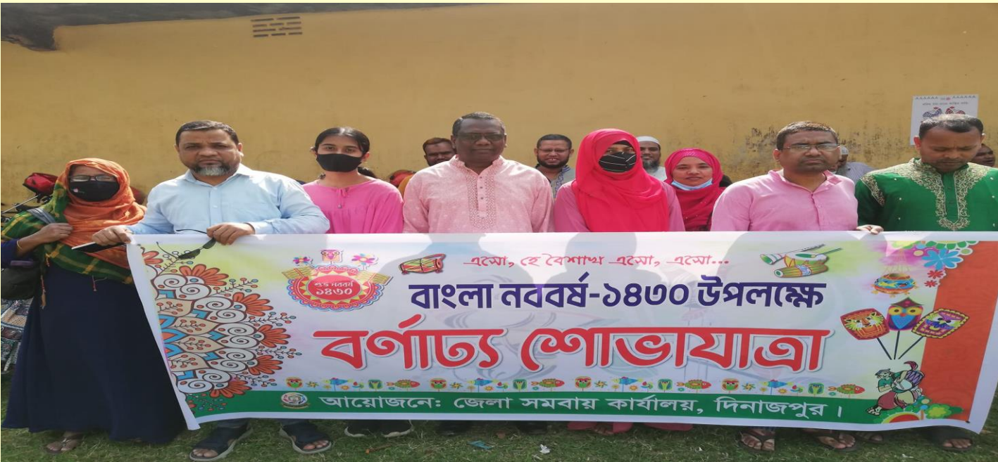
বাংলা নববর্ষ ১৪৩০ উৎযাপন