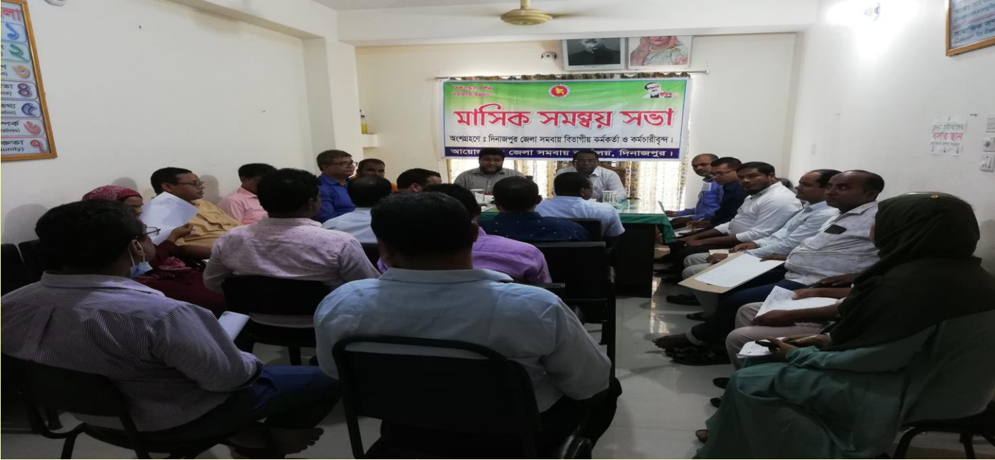
দিনাজপুর জেলার মাসিক সমন্বয় সভায় অংশগ্রহন

সেবা সহজ করা ও ট্রেডভিত্তিক প্রশিক্ষণ ও প্রযুক্তি সহায়তা প্রদান করার মাধ্যমে সমবায় উদ্যোক্তা সৃষ্টি করা ও আত্ম-কর্মসংস্থানের পথ সুগম করা ও অন্যতম লক্ষ্য। সমবায়ের মাধ্যমে দেশীয় উৎপাদন বৃদ্ধি এবং উৎপাদিত পণ্য সরাসরি ভোক্তাদের নিকট সুলভ মূল্যে পৌঁছে দেয়ার লক্ষ্যে সমবা য়পণ্যের ব্র্যান্ডিং, বাজারজাতকরণে সহায়তা করা হবে। এছাড়া সমবায়ের মাধ্যমে নৃ-তাত্ত্বিক জনগোষ্ঠী, সুবিধাবঞ্চিত ও অনগ্রসর জনগোষ্ঠী ও মহিলাদের সরাসরি ও বিকল্প কর্মসংস্থান সৃষ্টি, সামাজিক ও আর্থিক বৈষম্য হ্রাস এবং জীবনযাত্রার মানউন্নয়নে ও ক্ষমতায়নের জন্য প্রকল্প/কর্মসূচি গ্রহণে সমবায় অধিদপ্তরে প্রকল্প/কর্মসূচির প্রস্তাব প্রেরণ করা হবে।