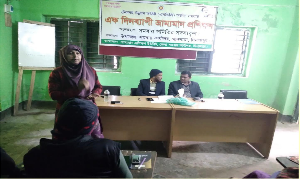
খানসামা উপজেলার মাসিক সমন্বয় সভা।

করা ও অন্যতম লক্ষ্য। সমবায়ের মাধ্যমে দেশীয় উৎপাদন বৃদ্ধি এবং উৎপাদিত পণ্য সরাসরি ভোক্তাদের নিকট সুলভ মূল্যে পৌঁছে দেয়ার লক্ষ্যে সমবা য়পণ্যের ব্যান্ডিং, বাজারজাতকরণে সহায়তা করা হবে। এছাড়া সমবায়ের মাধ্যমে নৃ-তাত্ত্বিক জনগোষ্ঠী, সুবিধাবঞ্চিত ও অনগ্রসর জনগোষ্ঠী ও মহিলাদের সরাসরি ও বিকল্প কর্মসংস্থান সৃষ্টি, সামাজিক ও আর্থিক বৈষম্য হ্রাস এবং জীবনযাত্রার মানউন্নয়নে ও ক্ষমতায়নের জন্য প্রকল্প/কর্মসূচি গ্রহণে সমবায় অধিদপ্তরে প্রকল্প/কর্মসূচির প্রস্তাব প্রেরণ করা হবে।