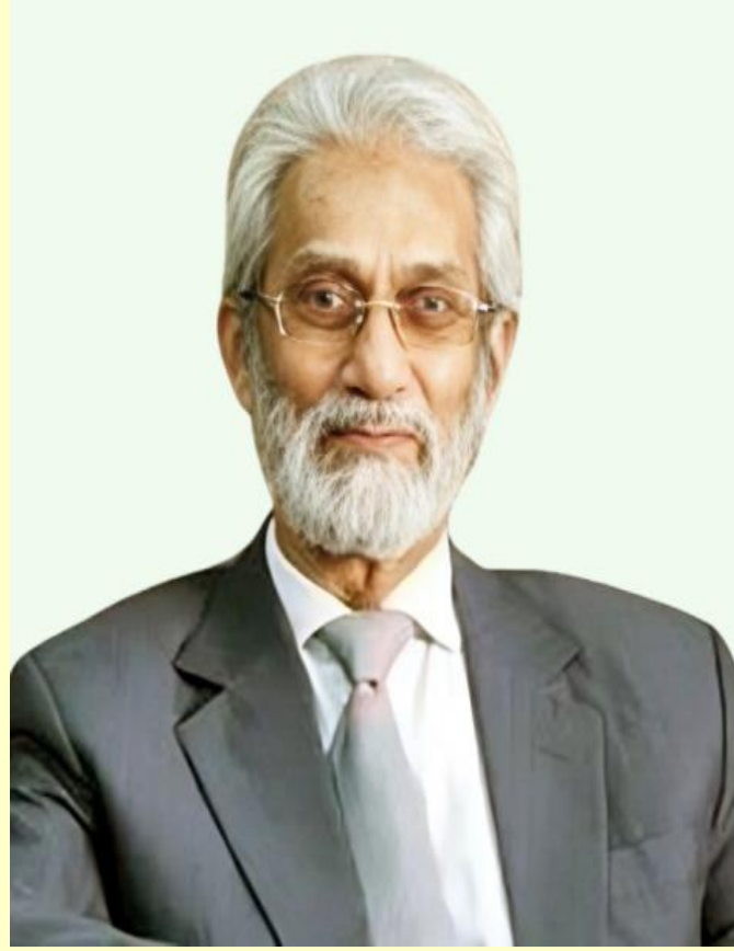
মাননীয় উপদেষ্টা এ.এফ.হাসান আরিফ