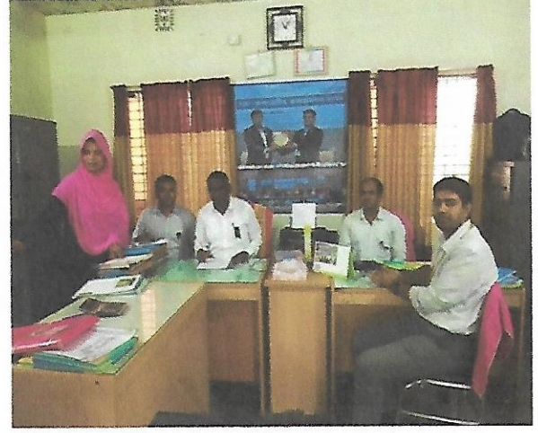
সেতাবগঞ্জ গুডনেইবার্স মহিলা কৃষি সমবায় সমিতি পরিদর্শন