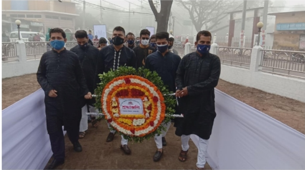
চিত্রঃ আঞ্চলিক মাতৃজায়া ও শহীদ দিবস ২১