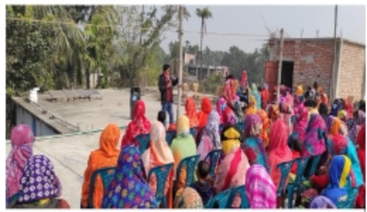
৪২. গ্রন্থক ভেদে মাসিক বৃত্ত, কল, বহুবিধ ক্রে-৩টি ক্রীড়া খেলায় ১৫ টি মিনি-সিটিক্স দেখে যা।