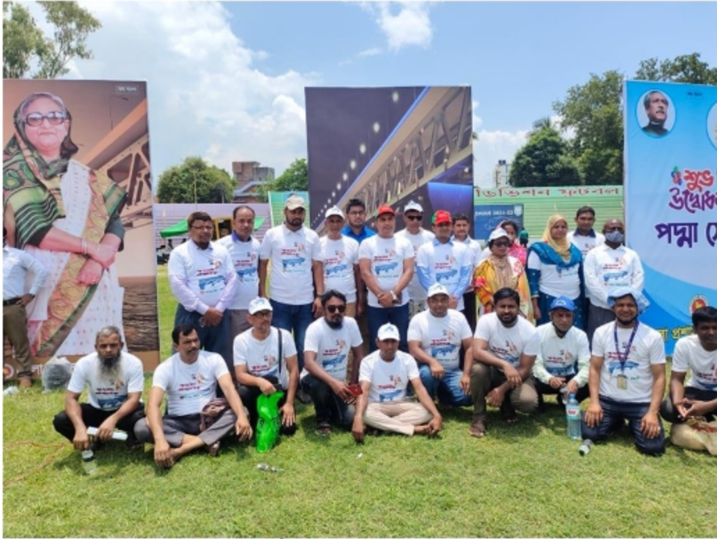
চিত্রঃ পদ্মা সেতুর উদ্বোধন উদযাপন