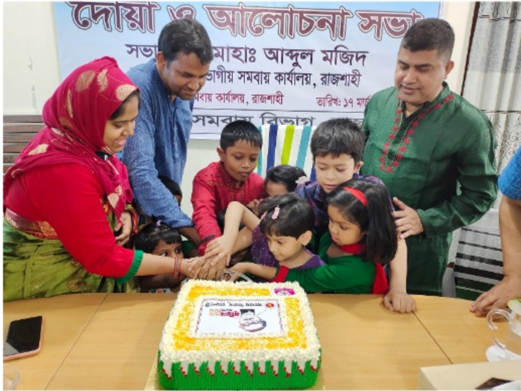
চিত্রঃ জাতীয় শিশু দিবস উদযাপন