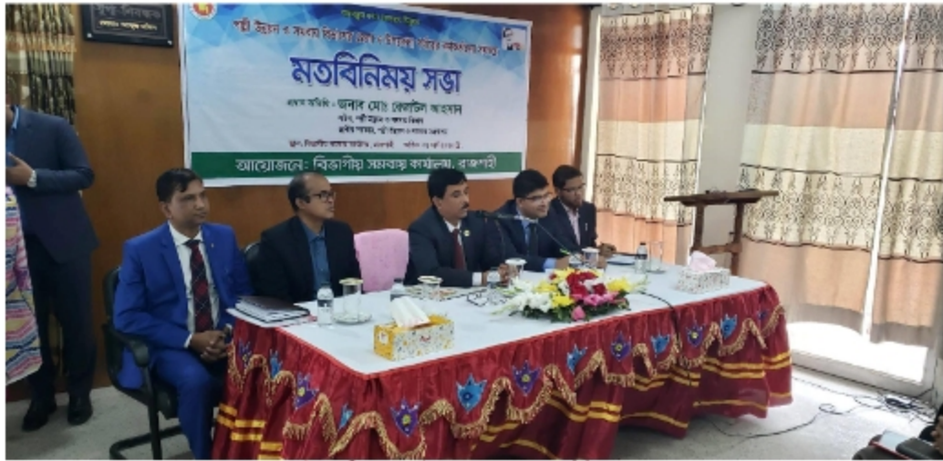
চিত্রঃ পল্লী উন্নয়ন সচিব মহোদয়ের সাথে মতবিনিময় সভা