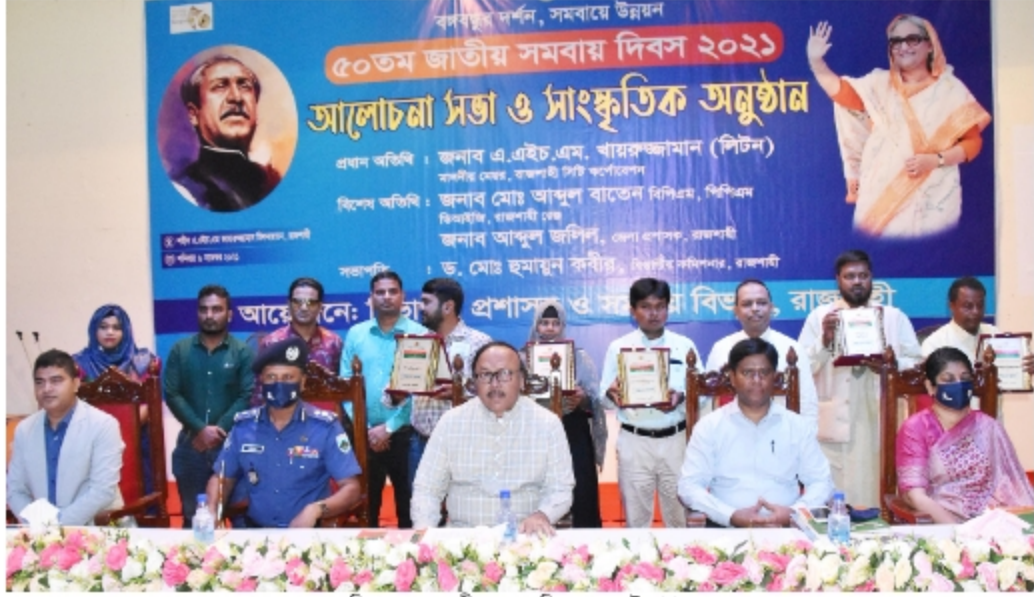
চিত্রঃ ৫০তম জাতীয় সমবায় দিবস ২০২১ উদযাপন