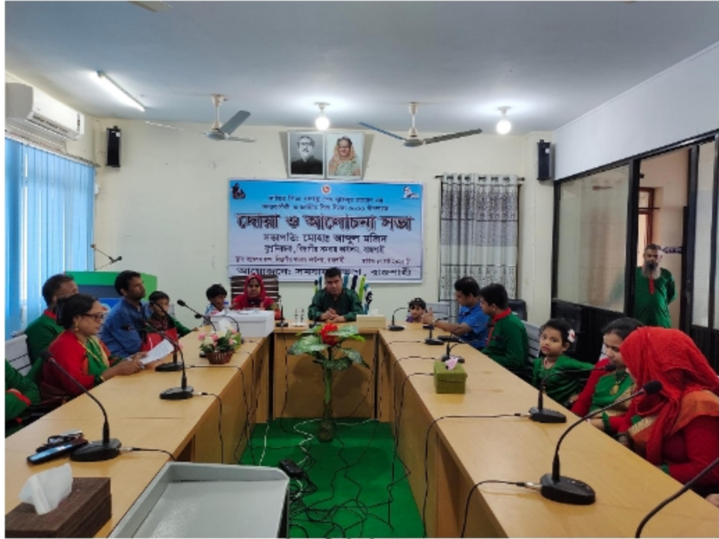
চিত্র: জাতীয় শিশু দিবস উদযাপন