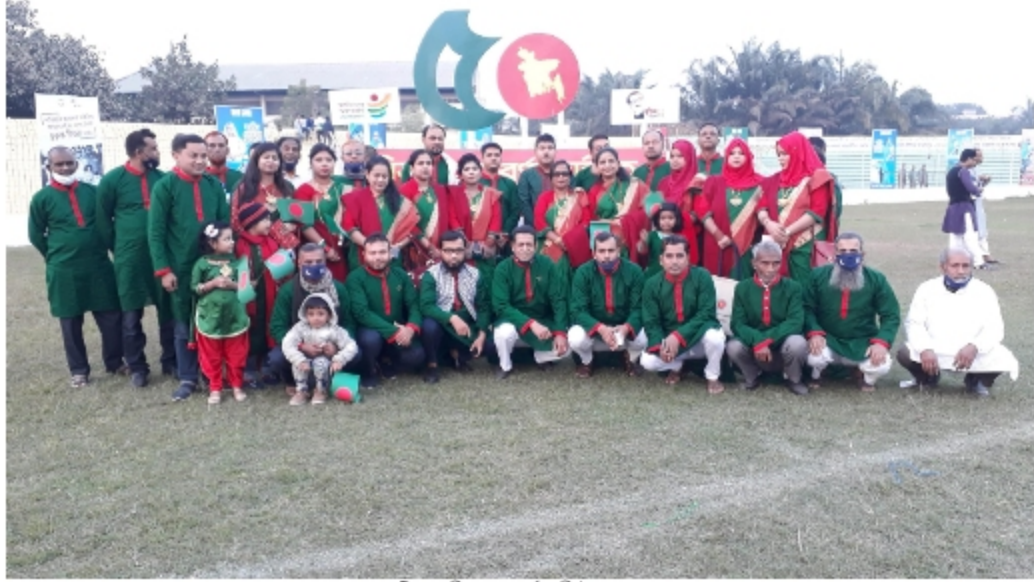
চিত্রঃ শাখীনতার সুবর্ণজয়ন্তী উদযাপন