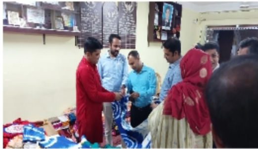
১. সফল সদস্যদের সাথে