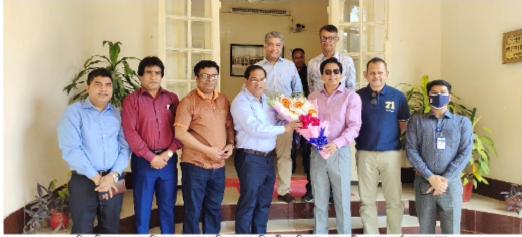
চিত্রঃ নিবন্ধক ও মহাপরিচালক, সমবায় অধিদপ্তর একে বিভাগীয় কমিশনার, রাজশাহী এর অত্র কার্যালয়ে আগমন