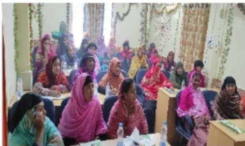
৪১. গ্রন্থক ভেদে মাসিক বৃত্ত, কল, বহুবিধ ক্রে-৩টি ক্রীড়া খেলায় ১৫ টি মিনি-সিটিক্স দেখে যা।

১। সদস্যদের সংগঠিত ও একতাবদ্ধ রাখা, ২। সদস্যদের জীবন যাত্রার মান উন্নত থাকা, ৩। সদস্যদের নিরক্ষতা মুক্ত থাকা, ৪। নোংরা রাজনীতি থেকে বিরত থাকা অর্থাৎ সম্পূর্ণ অরাজনৈতিক সংগঠন করা, ৫। উদারতা, ৬। সহযোগিতা, কর্মতৎপরতা, স্বার্থহীনতা, নিয়ম শৃংখলা বজায় রাখা, ৭। ধর্মীয় সু-সম্প্রীতি বজায় রাখা ৮। সদস্যদের সচেতনতা ও ৯। নিজস্ব উন্নত অবকাঠামো এবং সমন্বিত উন্নয়ন প্রচেষ্টা।