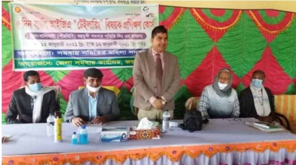
চিত্রঃ আইজিএ প্রশিক্ষণের চিত্র