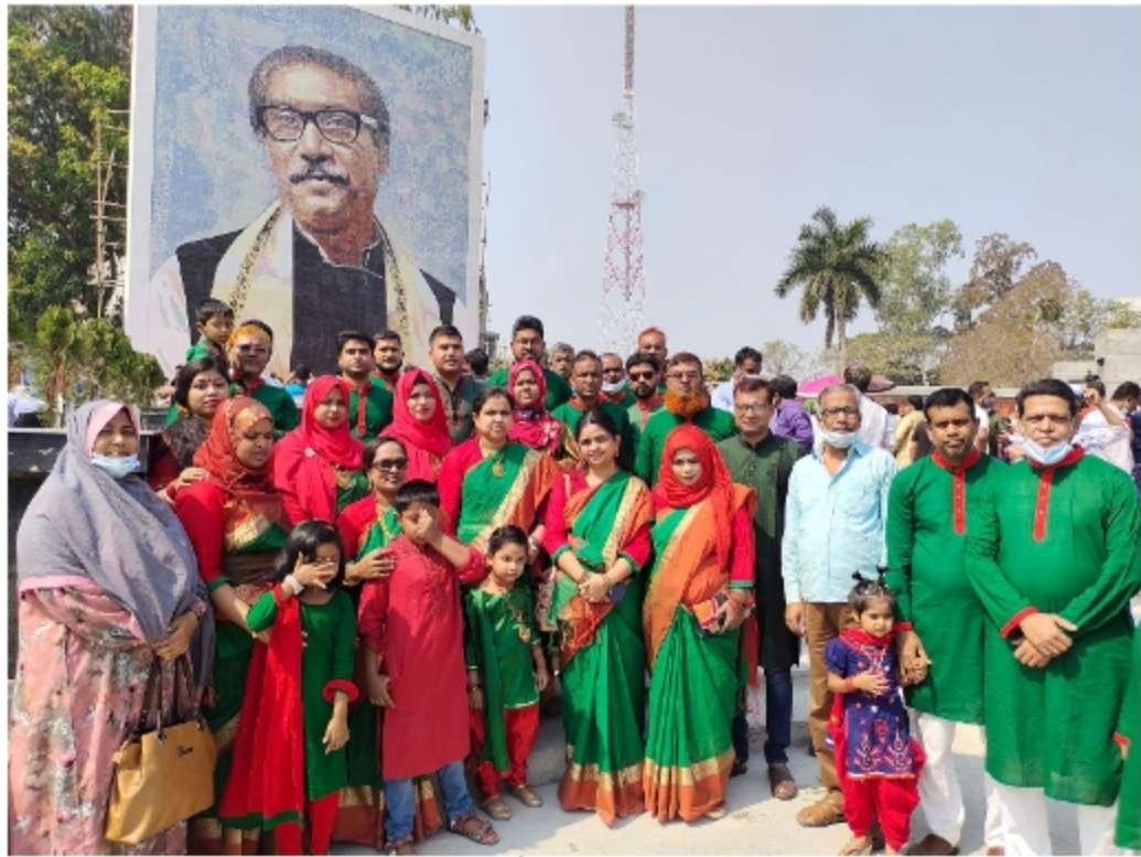
চিত্র: জাতীয় শিশু দিবস উদযাপন