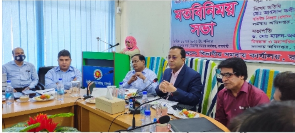
চিহ্নে সচিব, পট্টী উন্নয়ন ও সমবায় বিভাগ ও নিবন্ধক ও মহাপরিচালক, সমবায় অধিদপ্তর মহোদয়ের সাথে মতবিনিময় সভা