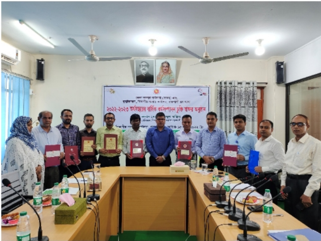
চিত্রঃ এপিএ ২২-২৩ স্বাক্ষর অনুষ্ঠান