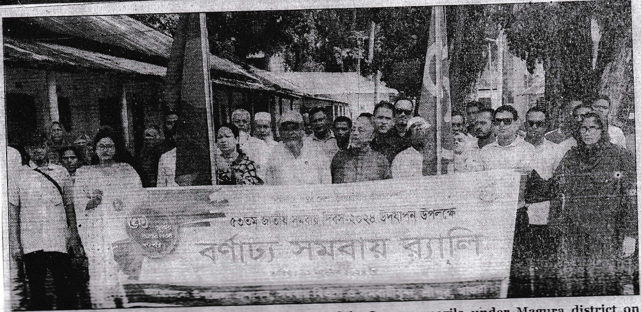
53th National Cooperative Day-2024 was observed in Sreepurupazila under Magura district on Saturday in befitting manner.