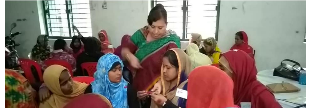
হাতে-কলমে প্রশিক্ষণ গ্রহণকালে বিএসএইচ এর সদস্যবৃন্দ।