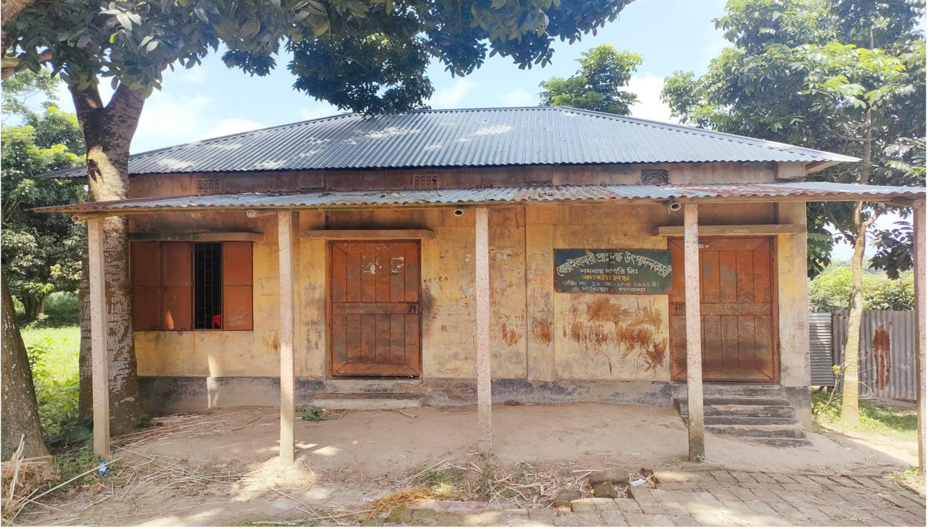
বোয়াইলমারী প্রাথমিক দুগ্ধ উৎপাদনকারী সমবায় সমিতির লিঃ অফিস ঘর।