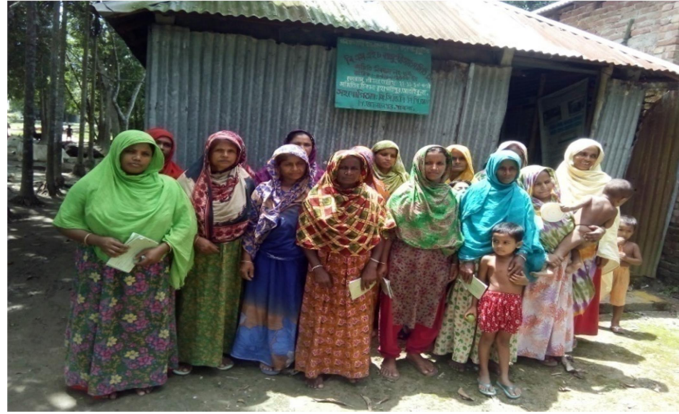
বিএসএইচ বহুমুখী সমবায় সমিতি লিঃ, সীথিয়া, পাবনা।