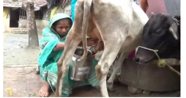
হোটেল ব্যবসা ও গাভী পালনে বিএসএইচ বহুমুখী সমবায় সমিতির সদস্য