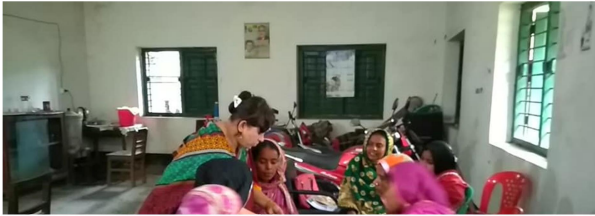
হাতে-কলমে প্রশিক্ষণের মাধ্যমে সদস্যদের কর্ম মূখী করে গড়ে তোলা হচ্ছে।

সমবায় সমিতি হিসাবে নিবন্ধন লাভ করার পর বিএসএইচ বহুমুখী সমবায় সমিতি লিঃ এর ব্যবস্থাপনা কমিটি সভ্যগণের শেয়ার ও ক্ষুদ্র ক্ষুদ্র সঞ্চয় নিয়মিত আদায়ের মাধ্যমে মূলধন গঠন করেছে এবং উন্নয়নমূলক পরিকল্পনা প্রণয়ন করে তা বাস্তবায়নের প্রচেষ্টা চালাচ্ছে। সমিতিটি আর্থিকভাবে দুর্বল কিন্তু কর্ম করে প্রতিষ্ঠা পেতে আশাবাদী এমন বেকার দরিদ্র ও পরিশ্রমী পুরুষ/মহিলা ব্যক্তিদের সমিতির সদস্যভুক্ত করেন। জেলা সমবায় কার্যালয়, পাবনা এর প্রামাণ্যমান প্রশিক্ষণ ইউনিট কর্তৃক প্রশিক্ষণ এবং উপজেলা সমবায় কার্যালয়, সৌথিয়ার পরামর্শক্রমে সমবায় সমিতি পরিচালনার সকল কলা-কৌশল আয়ত্ব করার চেষ্টা অব্যাহত আছে। সমিতি কর্তৃপক্ষ সমবায় সমিতি আইন/২০০১ ও সমবায় সমিতি বিধিমালা/২০০৪ মোতাবেক বিভিন্ন কার্যাবলী কঠোরভাবে সততা ও নিষ্ঠার সাথে পালন করে থাকেন। আর্থিক বিষয়সমূহে স্বচ্ছতা ও জবাবদিহিতার প্রতিপালন ঘটিয়ে সদস্যদের আস্থা অর্জনে সক্ষম হয়েছে এবং সমিতির কার্যক্রম সফলভাবে এগিয়ে যাচ্ছে। সমিতির মুড়িভাজা, পাপড়ভাজা, ক্রিস্টল শো পিচ, ব্লক বাটিক, হোটেল ব্যবসা, গাভী পালন, গরু মোটাতাজাকরণ, ছাগল পালন করে ১১৮ জন সদস্যের জীবন মান উন্নয়ন হয়েছে এবং সমিতির মাধ্যমে আত্ম-কর্মসংস্থানের সুযোগ সৃষ্টি হয়েছে।