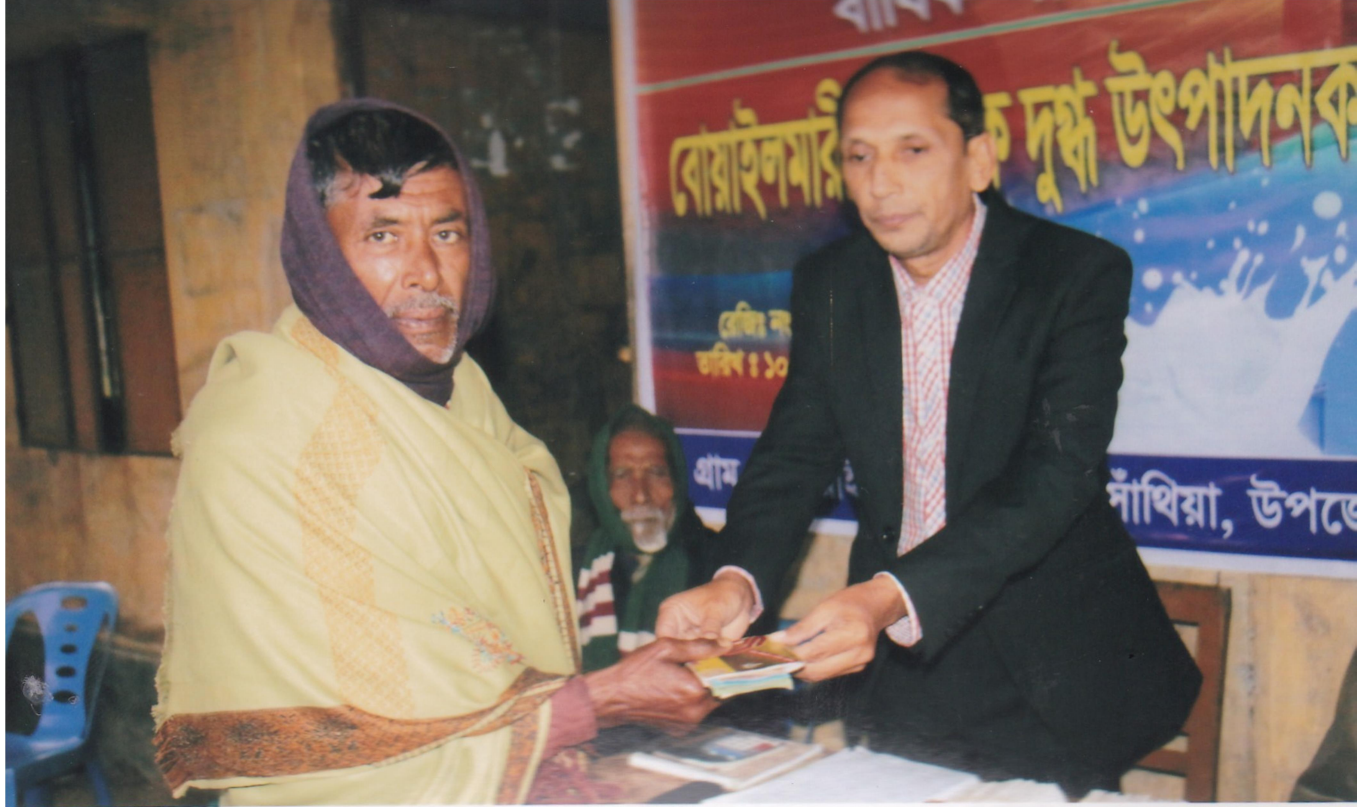
বোয়ালমারী প্রাথমিক দুগ্ধ উৎপাদনকারী সমবায় সমিতি লিঃ সঁথিয়া গকনা এর সদস্যদের হায়ে লভ্যাংশ বিতরণ করছেন।