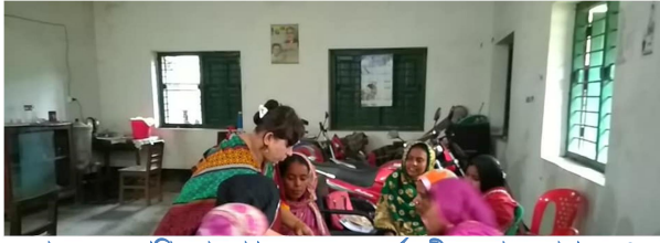
হাতে-কলমে প্রশিক্ষণের মাধ্যমে সদস্যদের কর্ম মুখী করে গড়ে তোলা হচ্ছে।