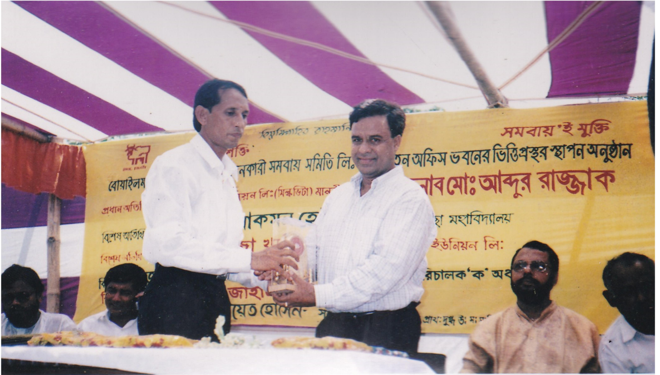
বোয়াইলমারী প্রাথমিক দুগ্ধ উৎপাদনকারী সমবায় সমিতি লিঃ সখিয়া, পাবনা এর সমিতির নতুন ভবনের ভিত্তিপ্রস্তর স্থাপন অনুষ্ঠান।

বোয়াইলমারী প্রাথমিক দুগ্ধ উৎপাদনকারী সমবায় সমিতির লিঃ এর পরিষ্কার করে রাখা ক্যান। এই পরিষ্কার ক্যানে সদস্যদের উৎপাদনকারী দুগ্ধ সংরক্ষণ করা হয়।