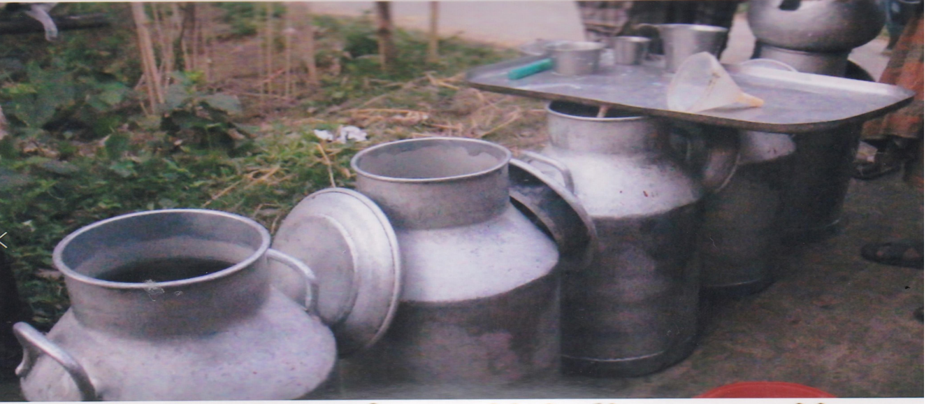
বোয়াইলমারী প্রাথমিক দুগ্ধ উৎপাদনকারী সমবায় সমিতি লিঃ সখিয়া, পাবনা এর সমিতির ক্যান।

বোয়াইলমারী প্রাথমিক দুগ্ধ উৎপাদনকারী সমবায় সমিতির লিঃ এর পরিষ্কার করে রাখা ক্যান। এই পরিষ্কার ক্যানে সদস্যদের উৎপাদনকারী দুগ্ধ সংরক্ষণ করা হয়।