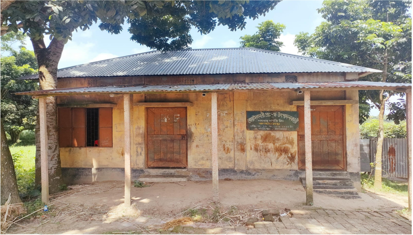
বোয়ালমারী প্রাথমিক দুগ্ধ উৎপাদনকারী সমবায় সমিতির লিঃ অফিস ঘর।