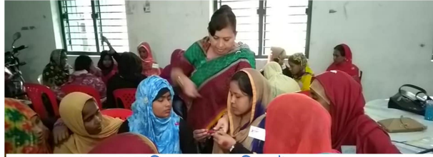
হাতে-কলমে প্রশিক্ষণ গ্রহণকালে বিএসএইচ এর সদস্যবৃন্দ।