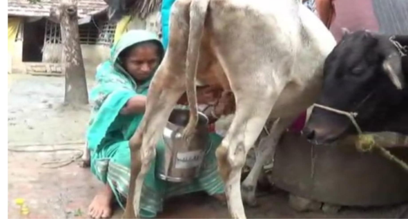
হোটেল ব্যবসা ও গাভী পালনে বিএসএইচ বহুমুখী সমবায় সমিতির সদস্য