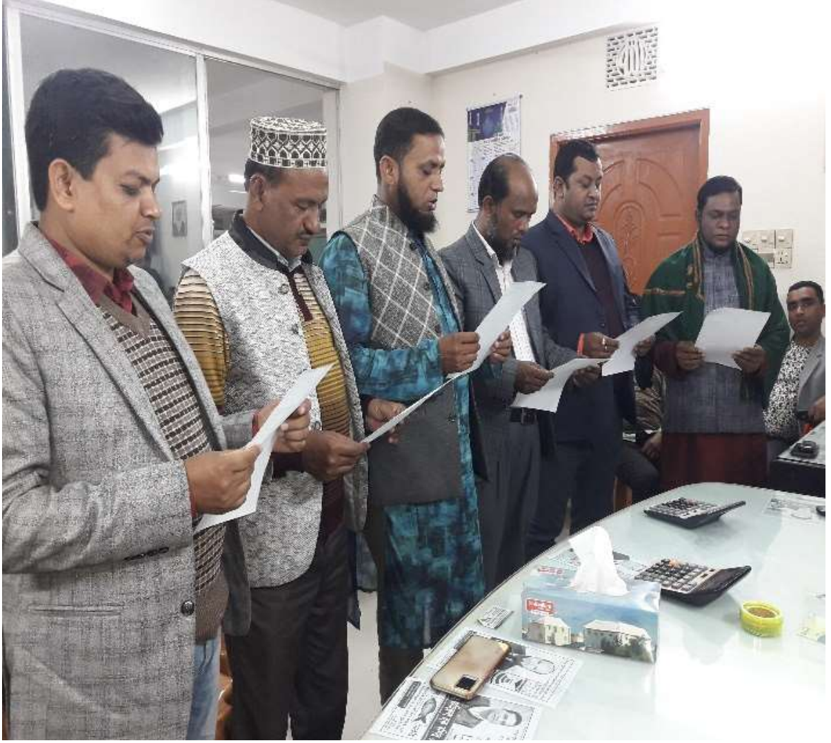
নব-নির্বাচিত ব্যবস্থাপনাকমিটির শপথ গ্রহণের চিত্র