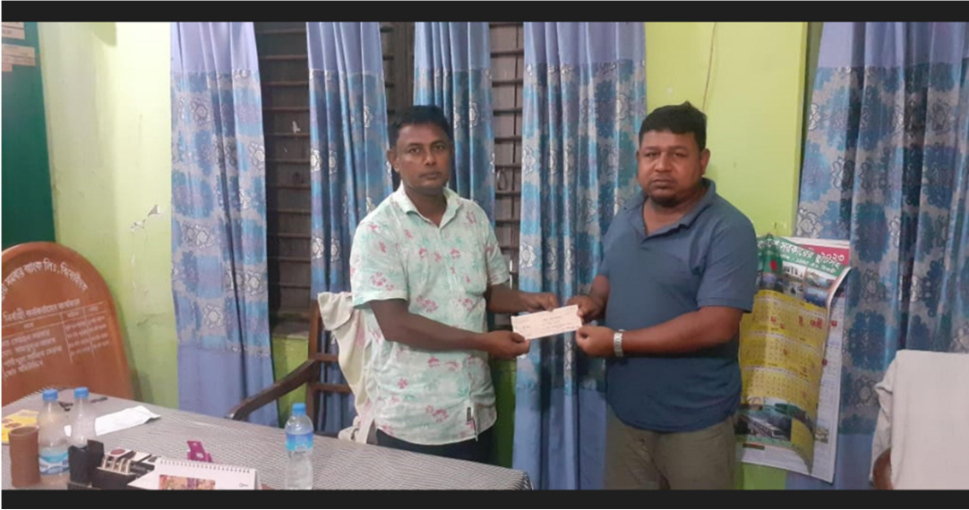
ঋণ প্রদানের চিত্র