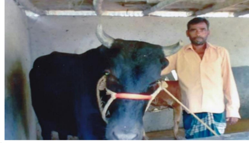
চিত্রঃ গরু মোটা তাজাকরণ