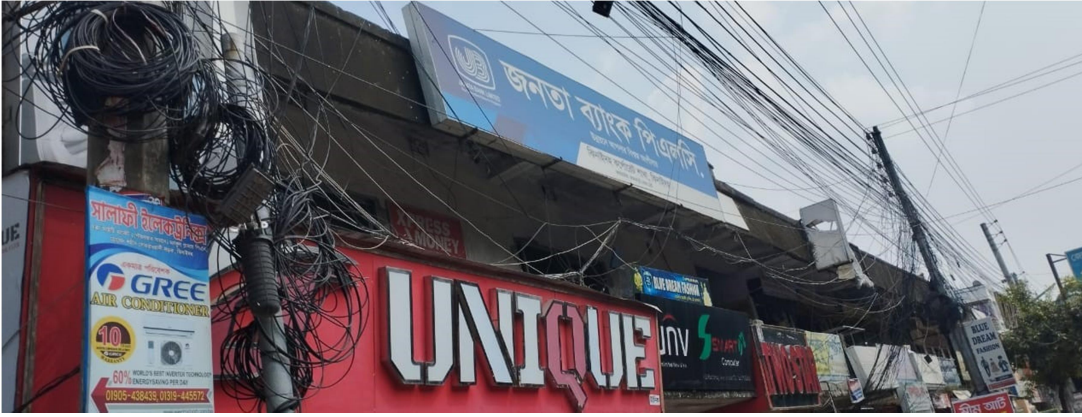
সমিতির দোকান ঘর চিত্র

আর্থ - সামাজিক উন্নয়নে ভূমিকা: আর্থ - সামাজিক উন্নয়নে সমিতিটি গুরুত্বপূর্ণ ভূমিকা রেখেছে। বেকার ও স্বল্প আয়ের মহিলাদের কর্মসংস্থান সৃষ্টির মাধ্যমে আর্থ-সামাজিক উন্নয়ন সাধিত হয়েছে।