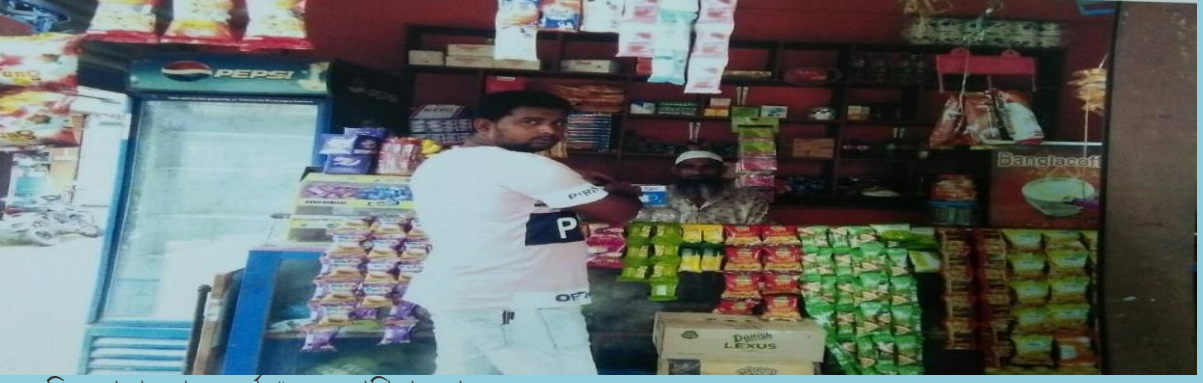
**মুদির দোকান বাবদ অর্থ ঋন সহযোগিতা করা।