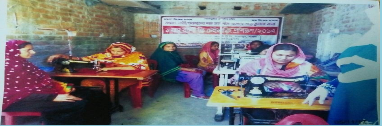
**সমিতির মহিলা সদস্যদের টেইলারিং প্রশিক্ষণ।