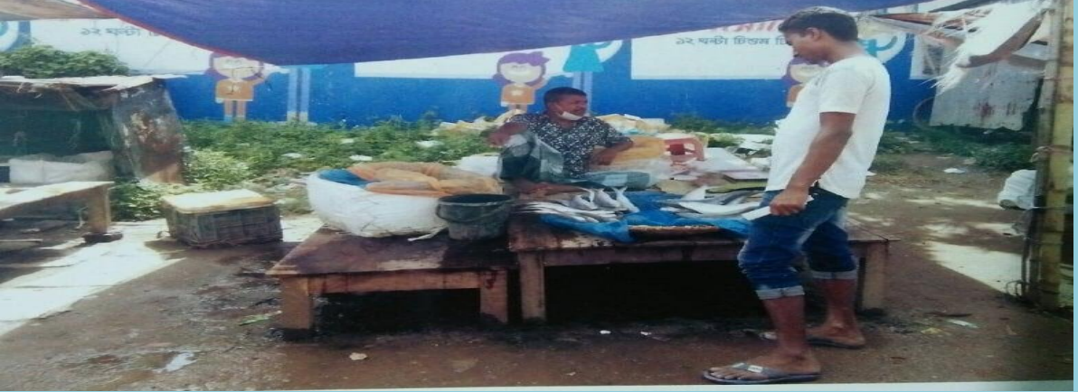
**মাছের দোকানে ঋন প্রদান।