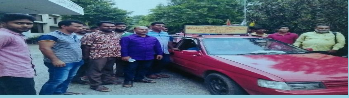
** ডাইভিং প্রশিক্ষন।