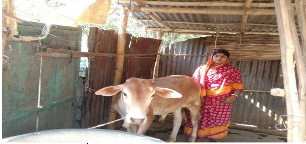
দুগ্ধ ও মাংস উৎপাদন প্রকল্পের ক্রয়কৃত গরুর বাছুর