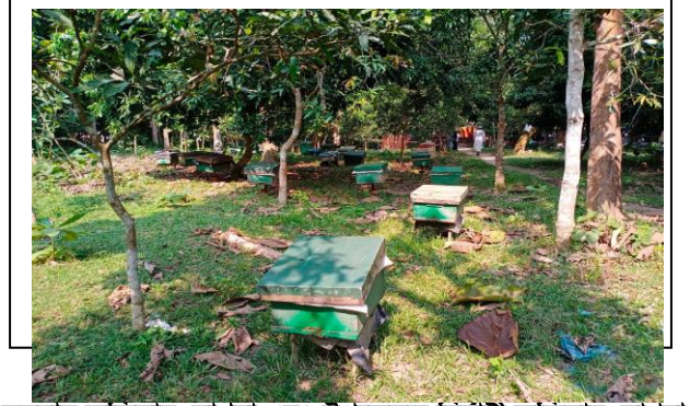
জেলা প্রশাসক, মাগুরা, আঞ্চলিক সমবায় ইনস্টিটিউট কুষ্টিয়া, জেলা সমবায় অফিসার, মাগুরা এবং উপজেলা নির্বাহী অফিসার, মাগুরা সদর কর্তৃক মাগুরা প্রচেষ্টা মৌচাষী সমবায় সমিতি লিঃ পরিদর্শন