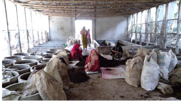
জৈব সার (কঁচো সার) উৎপাদন