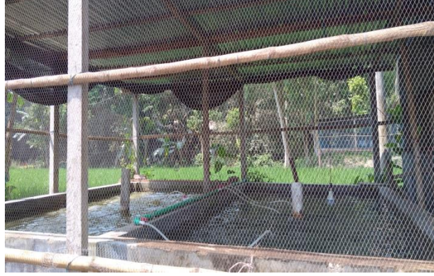
বায়োলক পদ্ধতিতে মাৎস্য চাষ

৫. কেসস্ট্যাডি : সমিতি গঠনের মাধ্যমে সদস্য সদস্যগণ একটি জৈব সার (কঁচো সার) উৎপাদন খামার ও বায়োলক পদ্ধতিতে মাৎস্য চাষ করে আর্থিক ভাবে সচ্ছল হয়েছেন।