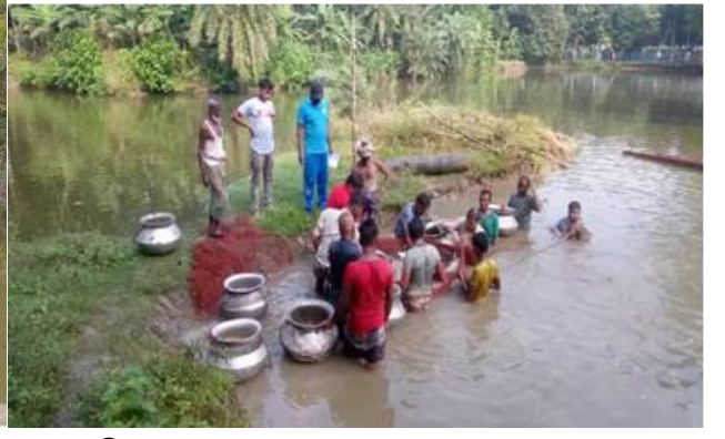
ছায়া সঞ্চয় ও ঋণদান সমবায় সমিতি লিঃ' এর মৎস্য খামারের ছবি