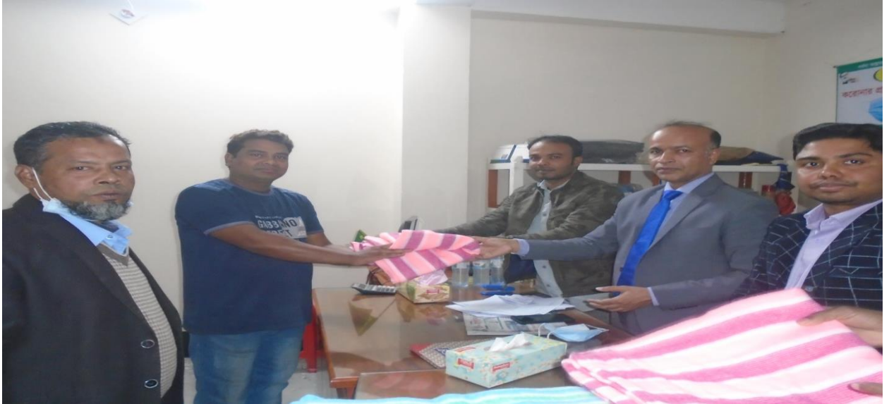
সমিতির পক্ষ থেকে শীত বস্ত্র বিতরণ।