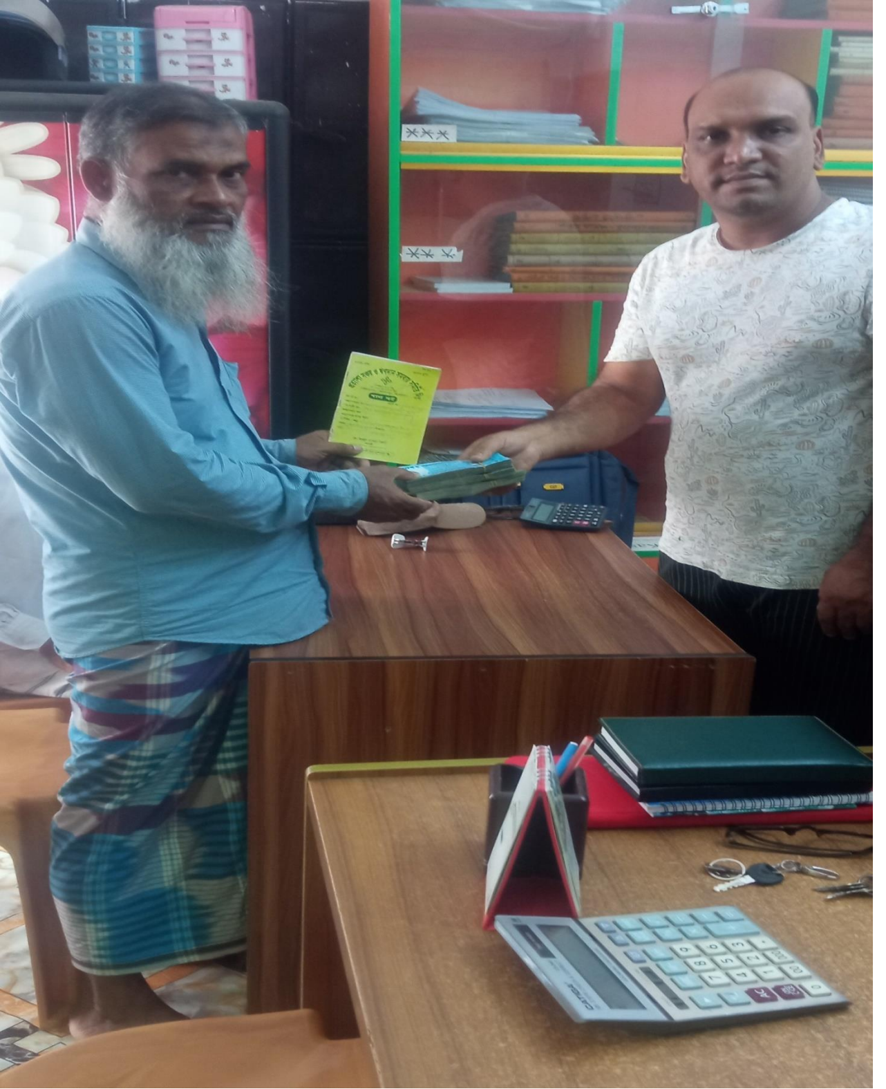
প্রত্যাশা সঞ্চয় ও ঋণদান সমবায় সমিতি লিঃ এর সভাপতি কর্তৃক সদস্যদের মধ্যে ঋণ বিতরণ এর স্থির চিত্র।