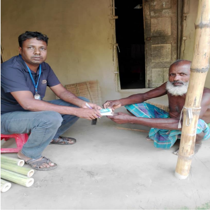
চিত্র: ক্ষুদ্র ঋণ আদায়