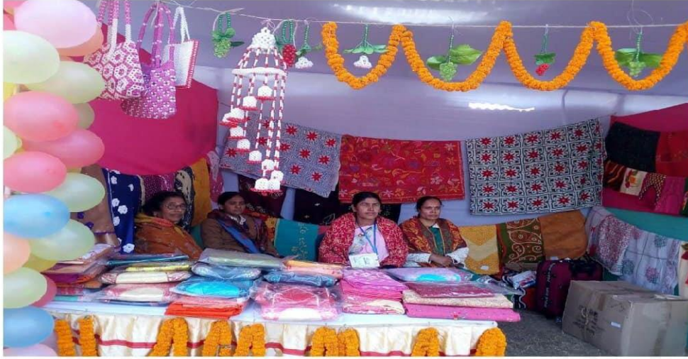
সমিতির উৎপাদিত পণ্য সামগ্রী বিক্রয় কেন্দ্র