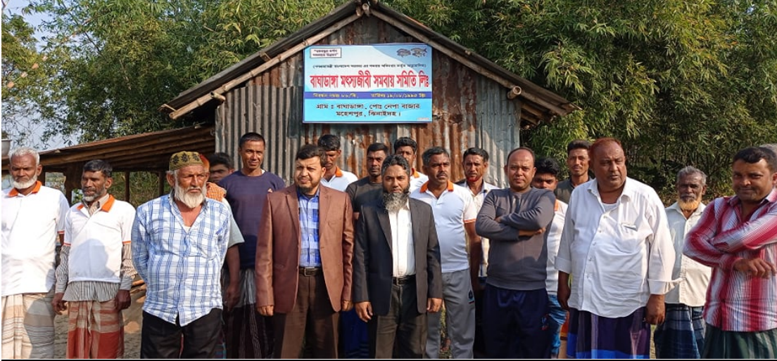
উপজেলা সমবায় অফিসার, মহেশপুর, বিনাইদহ এর সাথে বাঘাডাঙ্গা মৎস্যজীবী সমবায় সমিতির সদস্যগণ

পরিশেষঃ সমিতিটি তাঁর সদস্যদের আর্থ-সামাজিক উন্নয়ন ও স্ব-কর্মসংস্থান সৃষ্টিতে ভূমিকা পালন করে আসছে। যথাযথ সরকারী পৃষ্ঠপোষকতা পেলে সমিতির উৎপাদনমুখী কর্মকান্ড আরও গতিশীল ও বেগবান হবে। এর ফলে আলোচ্য সমিতি একদিন সাফল্যের সর্বোচ্চ শিখরে পৌঁছাবে।