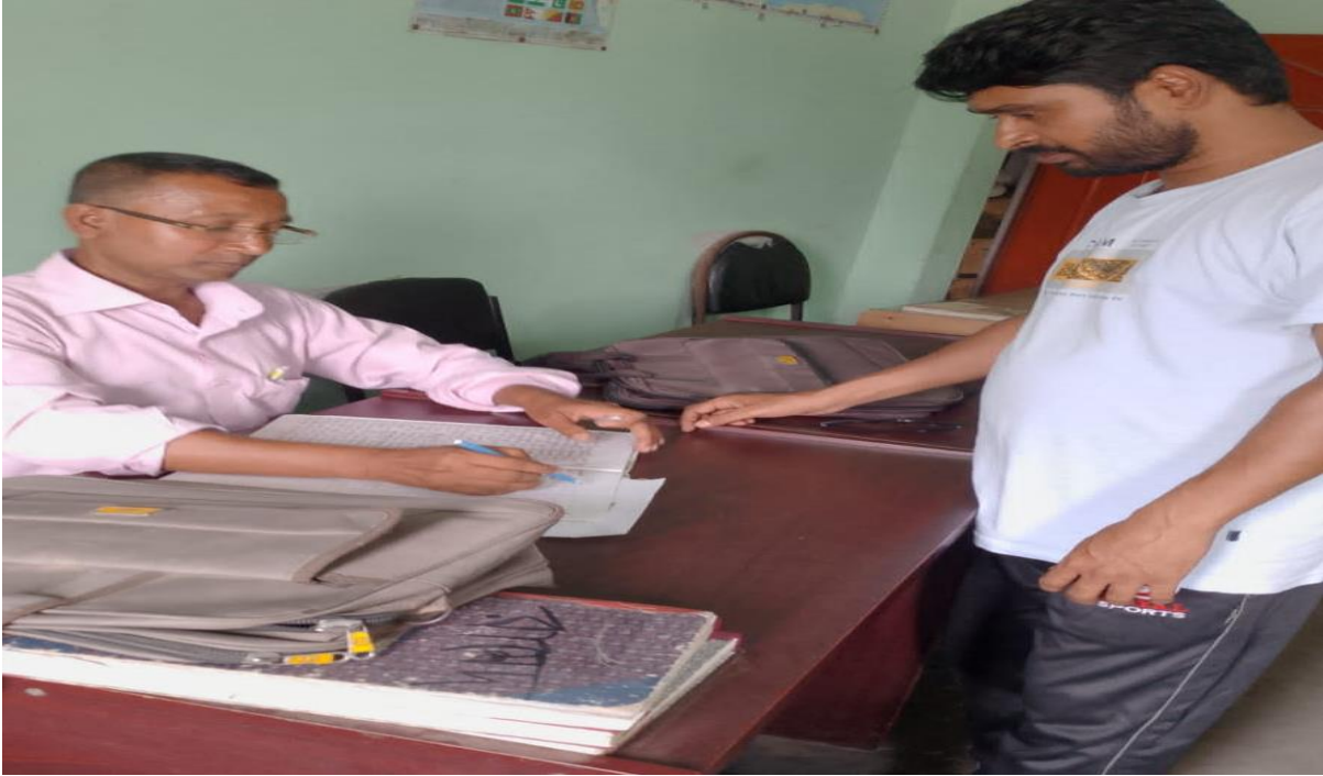
চিত্র: হিসাব রক্ষণ