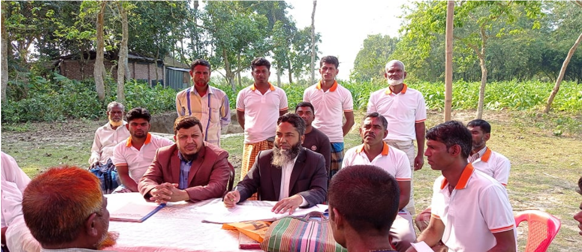
বাঘাডাঙ্গা মৎস্যজীবী সমবায় সমিতি লিঃ এর অডিট কার্যক্রমের স্থির চিত্র