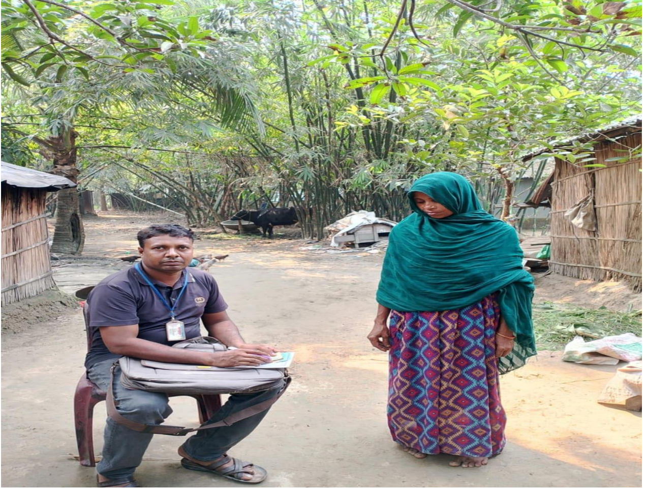
চিত্র: ক্ষুদ্র ঋণ আদায়