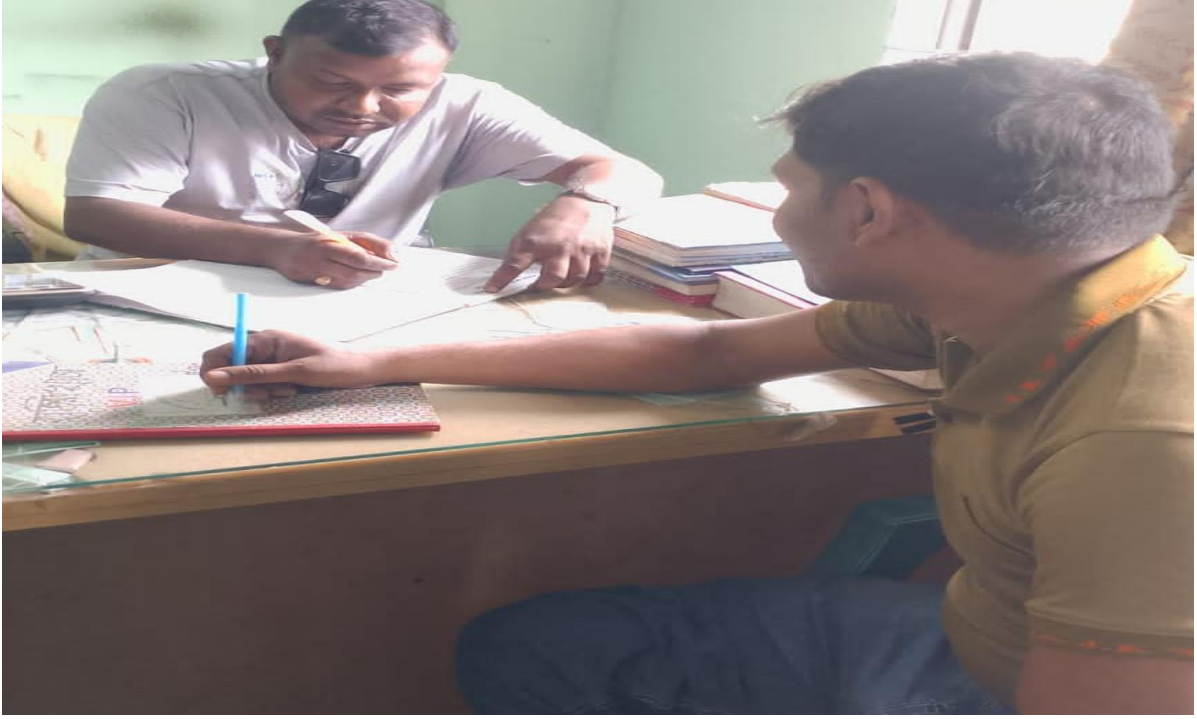
চিত্র: ম্যানেজার ( আর্থিক বিষয় তদারকী করছেন)।