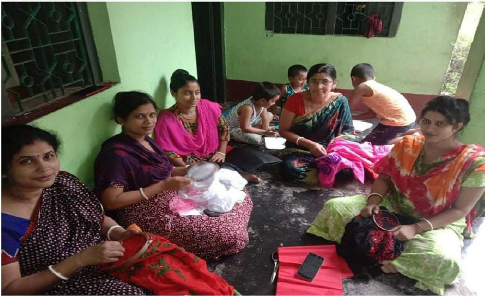
খ্রি-পিচে সমিতির সদস্যদের তৈরি সুই-সুতার প্রশিক্ষণের কাজ

কালীগঞ্জ পৌর মহিলা সমবায় সমিতি লিঃ এর মাধ্যমে সাধারণ মানুষের উপকার ভোগীর সংখ্যা দিন দিন বৃদ্ধি পাচ্ছে। সমিতির ব্যবস্থাপনা কমিটির সদস্যসহ সকলে অক্লান্ত পরিশ্রম করে যাচ্ছে সমিতির উন্নয়নের স্বার্থে। সমিতির সদস্যদের উন্নয়ন ছাড়াও তারা সামাজিক বিভিন্ন উন্নয়নমূলক কার্যক্রম করে থাকে। যেমনঃ কোন ধর্মীয় প্রতিষ্ঠান বা ধর্মীয় উৎসবে তারা আর্থিক সহায়তা প্রদান, খেলাধুলায় আর্থিক সহায়তা প্রদান, দুস্থদের আর্থিক সহায়তা প্রদান করা ইত্যাদি। সমিতির বিভিন্ন উন্নয়নমূলক কার্যক্রম এর সন্তোষ প্রকাশ করে। বর্তমান সরকারের অঙ্গীকার টেকসই উন্নয়ন, উক্ত সমিতিটি তা করতে সক্ষম হয়েছে। পর্যায়ক্রমে খাতওয়ারী প্রতিষ্ঠানের চলমান কার্যক্রমের কিছু ছবি নিম্নোক্ত দেওয়া হলোঃ