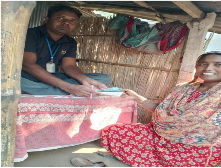
চিত্র: উদ্যোক্তা ঋণ আদায়