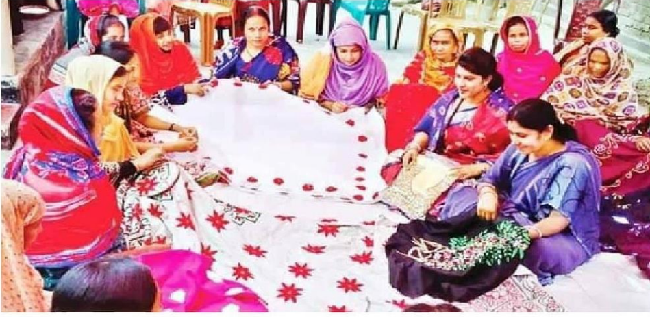
সমিতির সদস্যগণ নকশী কাঁথা তৈরি করছেন।