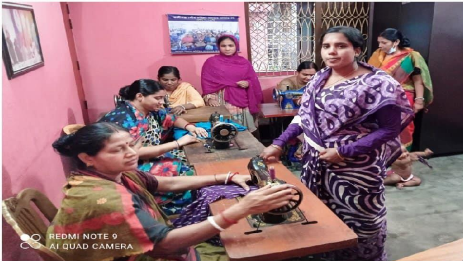
থ্রি-পিচে সমিতির সদস্যদের তৈরি সুই-সুতার কাজ