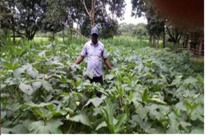
'ছায়া সঞ্চয় ও ঋণদান সমবায় সমিতি লিঃ' এর পোল্ট্রি ও কৃষি খামারের ছবি