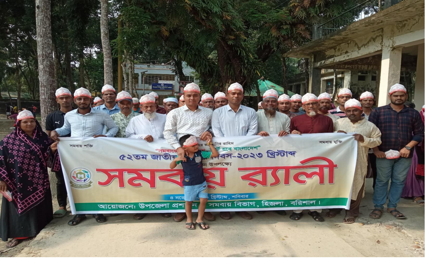
৫২ তম সমবায় দিবসের রেলী