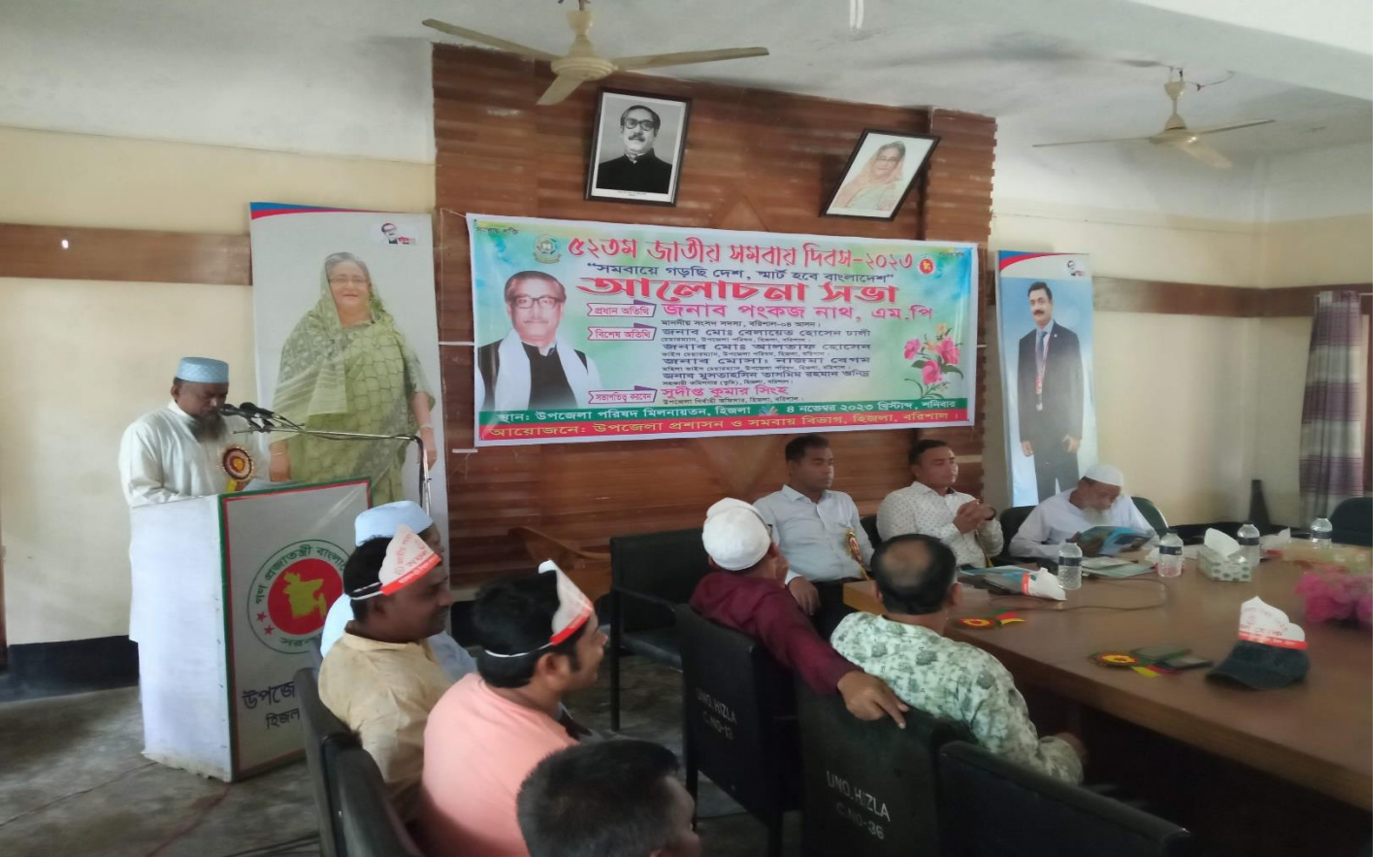
৫২ তম সমবায় দিবসে আলোচনা সভা