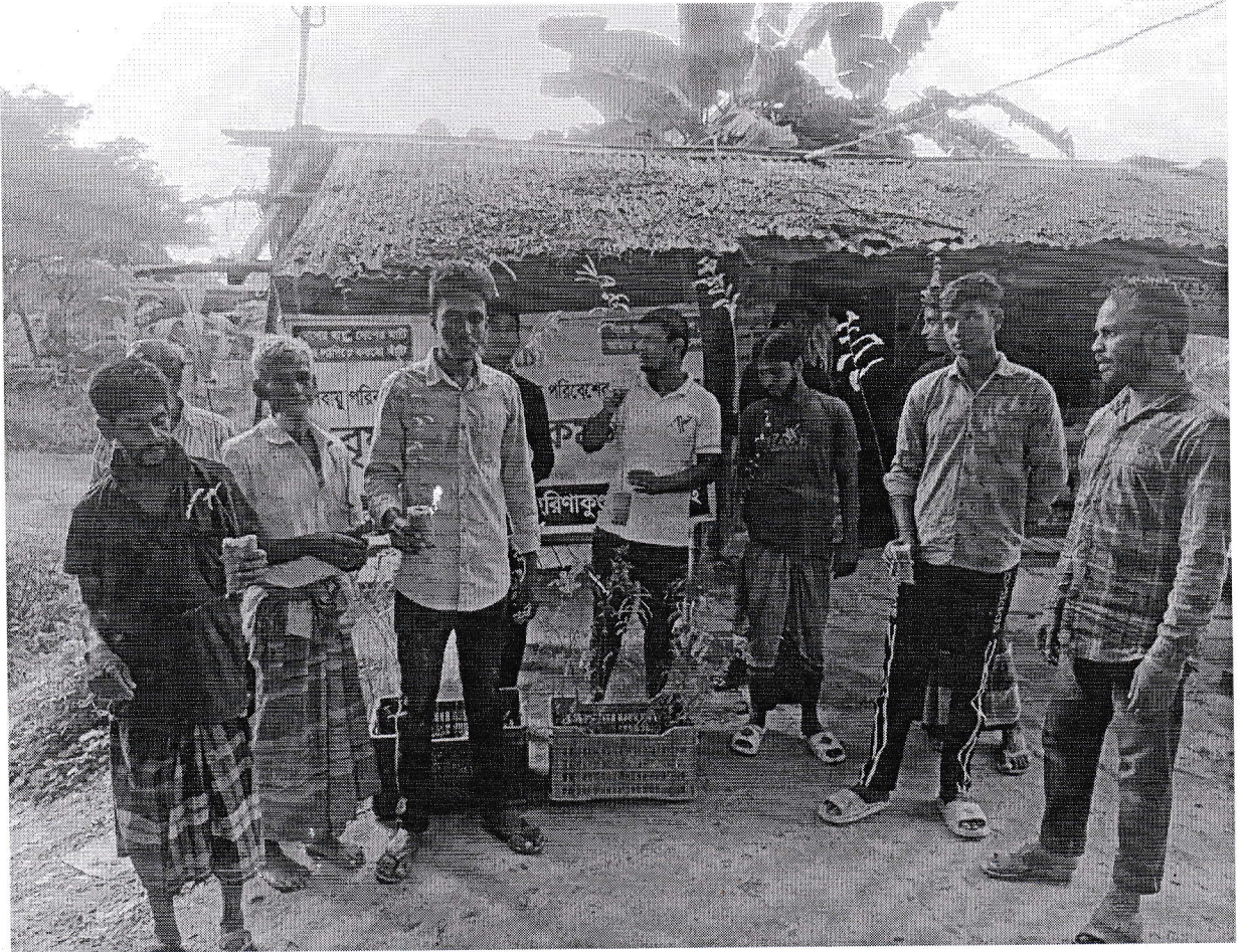
সমিতির উদ্যোগে নার্সারী প্রকল্প।

যদিও সমিতিটির নিবন্ধনের বয়স ৫(পাঁচ) বছর মাত্র। তথাপি সদস্যদের ঐকান্তিক প্রচেষ্টায় বিভিন্ন প্রতিকূলতার মাঝেও অগ্রযাত্রার ধারা অব্যাহত রাখার জোর প্রচেষ্টা চলমান আছে। সমিতির সদস্যদের মাঝে ক্ষুদ্র ব্যবসায় ঋণ সহায়তা এবং বিভিন্ন প্রকল্প গ্রহণের মাধ্যমে সদস্যদের আর্থ-সামাজিক অবস্থার উন্নয়নের অগ্রযাত্রায় সমিতিটি ভবিষ্যতে দৃষ্টান্ত স্থাপনে সক্ষম হবে।