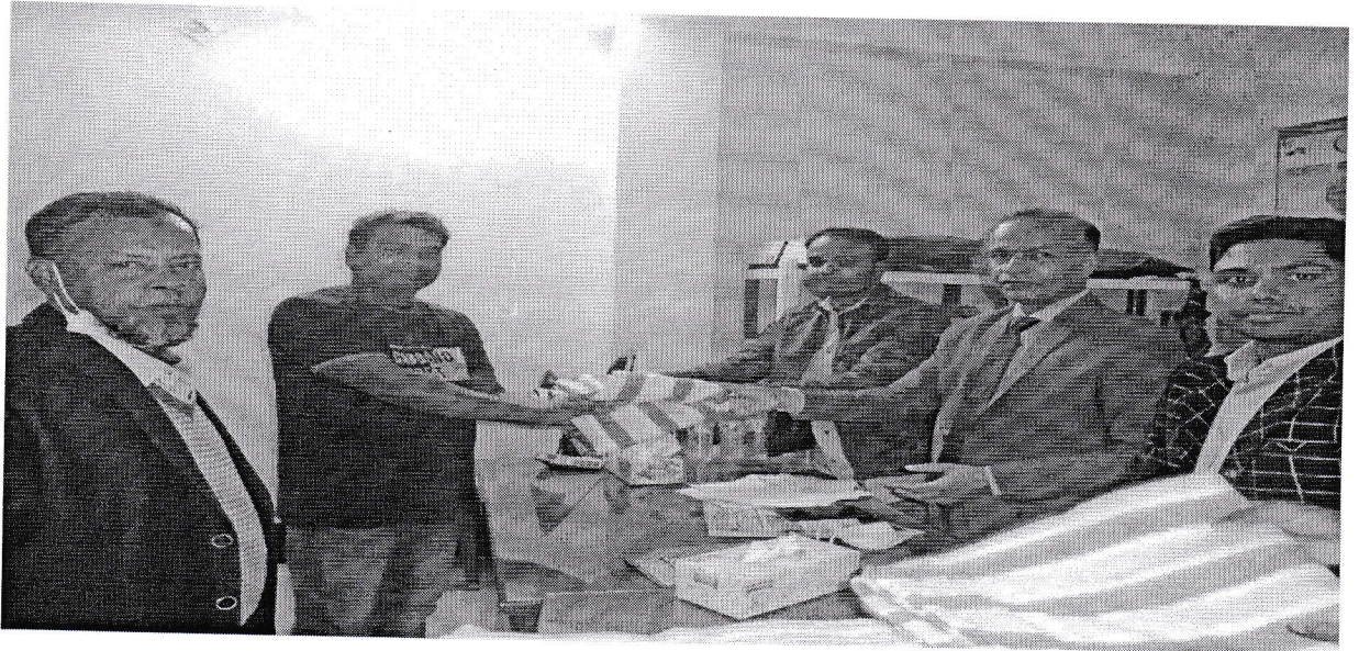
সমিতির পক্ষ থেকে শীত বস্ত্র বিতরণ।