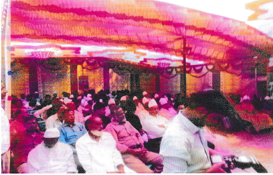
জেলা সমবায় কার্যালয়,চুয়াডাঙ্গা কর্তৃক ৫১তম জাতীয় সমবায় দিবসে উপস্থিত সমবায়ীবৃন্দ।