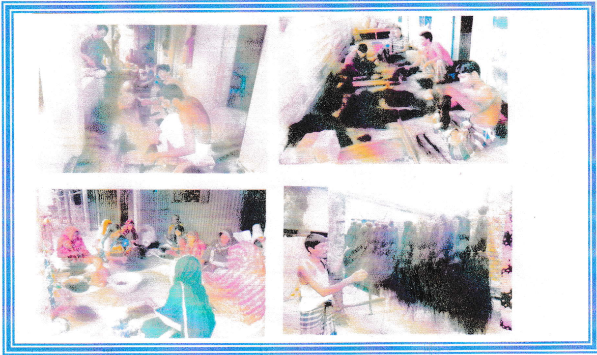
চিত্রঃ স্থানীয় মহিলা কর্তৃক গুটি চুল প্রসেস ও প্রসেসকৃত চুল।

(ঝ) করোনা প্রাদুর্ভাব মোকাবেলায় দুস্থদের মাঝে মাস্ক, হ্যান্ড স্যানিটাইজার ও সাবান সরবরাহ।