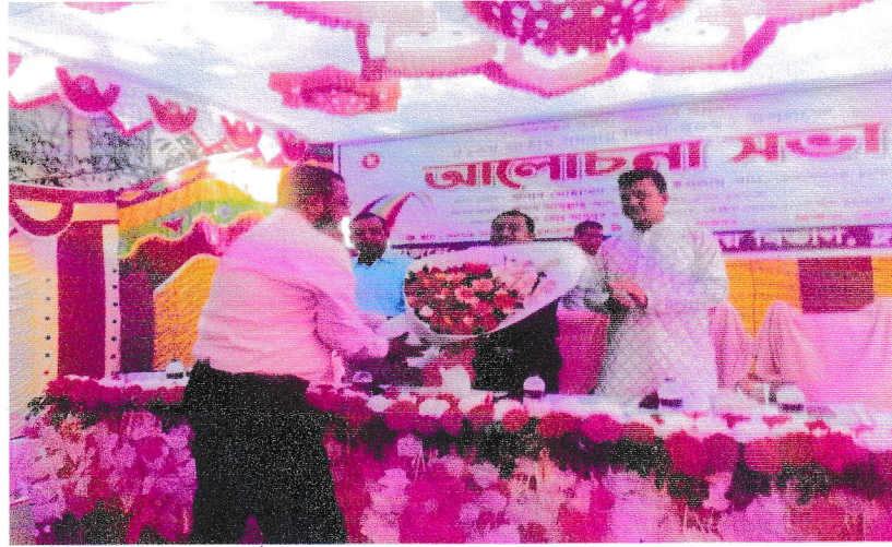
জেলা সমবায় কার্যালয়, চুয়াডাঙ্গা কর্তৃক ৫১তম জাতীয় সমবায় দিবস উপলক্ষে ফুলেল শুভেচ্ছা।