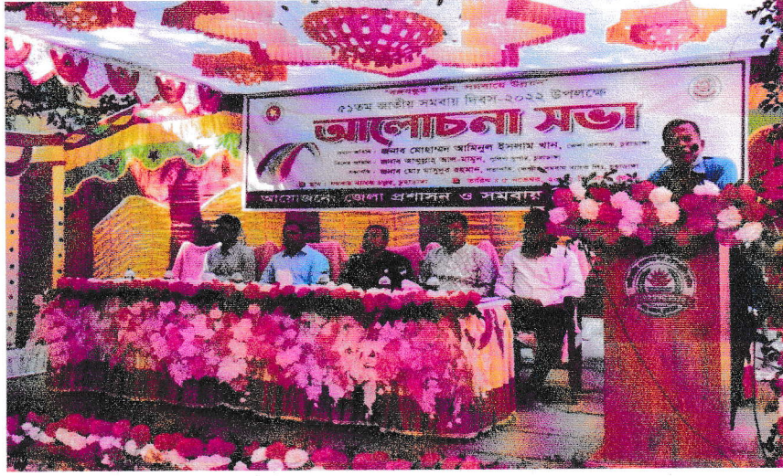
জেলা সমবায় কার্যালয়, চুয়াডাঙ্গা কর্তৃক ৫১তম জাতীয় সমবায় দিবস উপলক্ষে আলোচনা সভা।