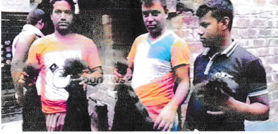
চিত্রঃ প্রসেসকৃত চুল হাতে শ্রমিকগ