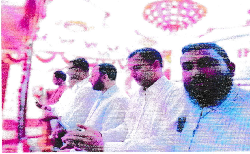
জেলা সমবায় কার্যালয়, চুয়াডাঙ্গা কর্তৃক ৫১তম জাতীয় সমবায় দিবসে উপস্থিত কর্মচারীগণ।।