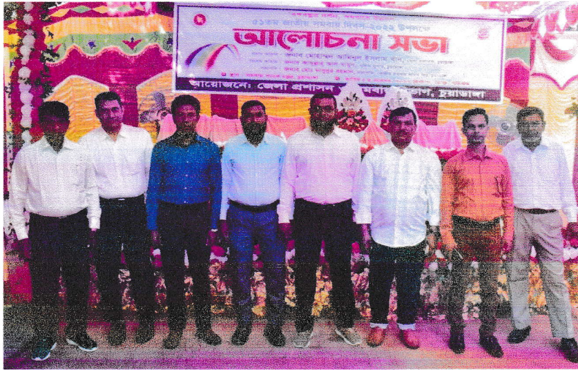
জেলা সমবায় কার্যালয়,চুয়াডাঙ্গা কর্তৃক ৫১তম জাতীয় সমবায় দিবসে উপস্থিত কর্মকর্তা ও কর্মচারীগণ।।