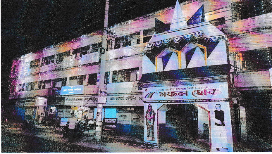
জেলা সমবায় কার্যালয়,চুয়াডাঙ্গা কর্তৃক ৫১তম জাতীয় সমবায় দিবস উপলক্ষে আলোকসজ্জা