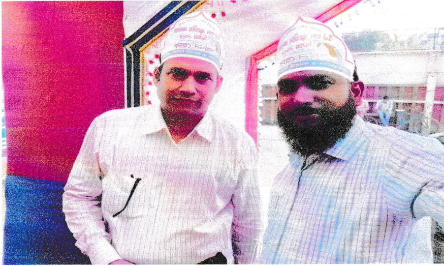
জেলা সমবায় কার্যালয়, চুয়াডাঙ্গা কর্তৃক ৫১তম জাতীয় সমবায় দিবসে উপস্থিত কর্মচারীগণ।।