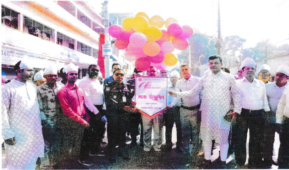
জেলা সমবায় কার্যালয়,চুয়াডাঙ্গা কর্তৃক ৫১তম জাতীয় সমবায় দিবস উপলক্ষে বেলুন উড়িয়ে শুভ উদ্বোধন।