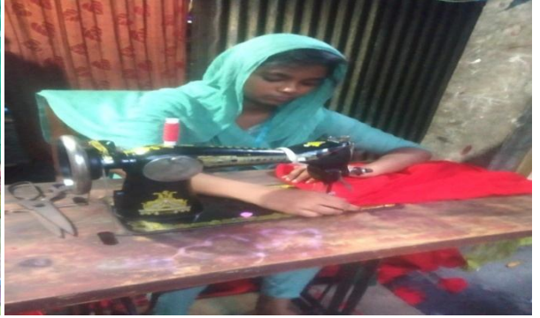
সেলাই মেশিনের কাজ।