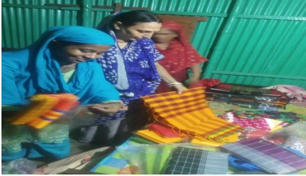
কাপরের ক্ষুদ্র ব্যবসা।