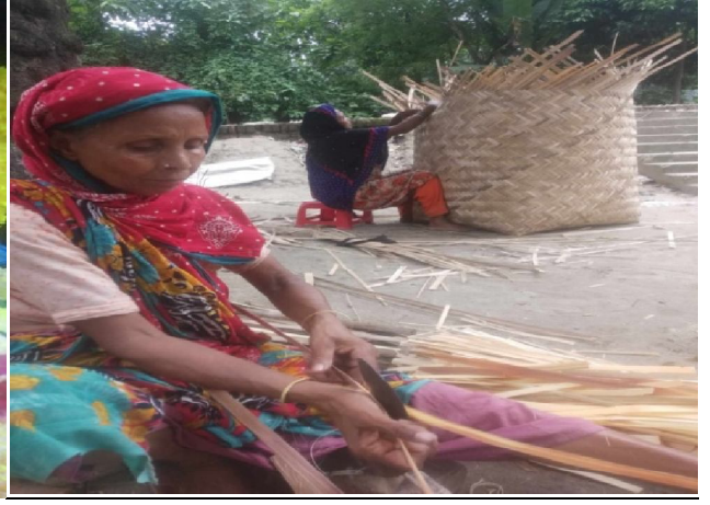
বঁশ বেত দিয়ে নানা রকম পন্য তৈরী।