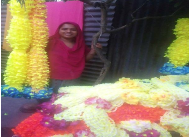
কাগজের নানা রকম ফুল তৈরী কাজ।

১৭.০০: সমিতির ভবিষ্যৎ পরিকল্পনা : নারীর ক্ষমতায়নে আরোও নতুন নতুন প্রকল্প গ্রহণ করা।