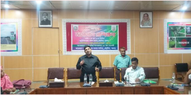
জেলা সমবায় অফিসার, পঞ্চগড় মহোদয় কর্তৃক প্রশিক্ষণ