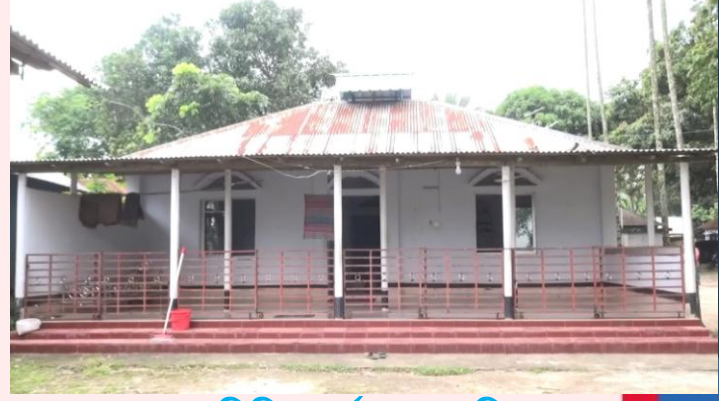
সমিতির অর্থায়নে মসজিদ