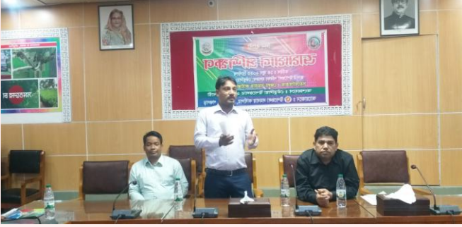
উপজেলা কৃষি কর্মকর্তা কর্তৃক কৃষি বিষয়ে প্রশিক্ষণ