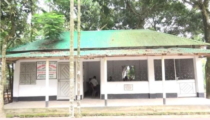
সমিতির অফিস ঘর

মাঝিপাড়া কৃষি খামার ক্ষুদ্র চা-চাষি সমবায় সমিতি লিঃ এর কার্যক্রমের ছবি