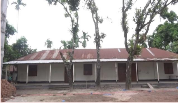
সমিতির অর্থায়নে মাদ্রাসা