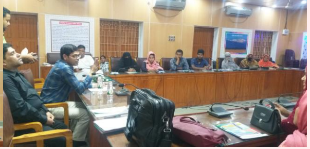
উপজেলা নির্বাহী অফিসার কর্তৃক প্রশিক্ষণ