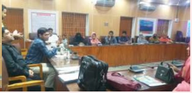
উপজেলা নির্বাহী অফিসার কর্তৃক প্রশিক্ষণ