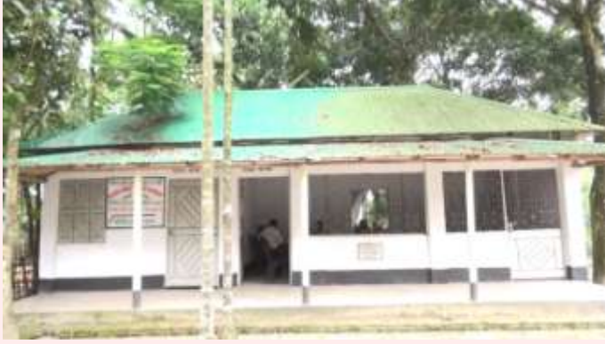
সমিতির অফিস ঘর

মাঝিপাড়া কৃষি খামার ক্ষুদ্র চা-চাষি সমবায় সমিতি লিঃ এর কার্যক্রমের ছবি