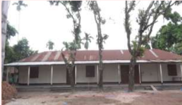
সমিতির অর্থায়নে মাদ্রাসা