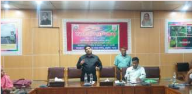
জেলা সমবায় অফিসার, পঞ্চগড় মহোদয় কর্তৃক প্রশিক্ষণ