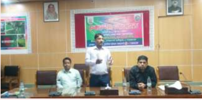
উপজেলা কৃষি কর্মকর্তা কর্তৃক কৃষি বিষয়ে প্রশিক্ষণ

উপজেলা সমবায় কার্যালয় তেঁতুলিয়া, পঞ্চগড় কর্তৃক পরিচালিত ভ্রাম্যমান প্রশিক্ষণের ছবি