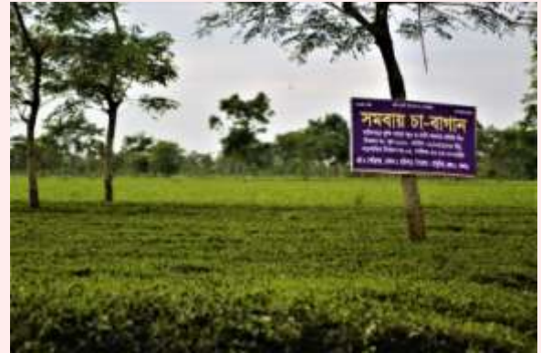
সমিতির সমবায় চা-বাগান