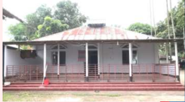
সমিতির অর্থায়নে মসজিদ