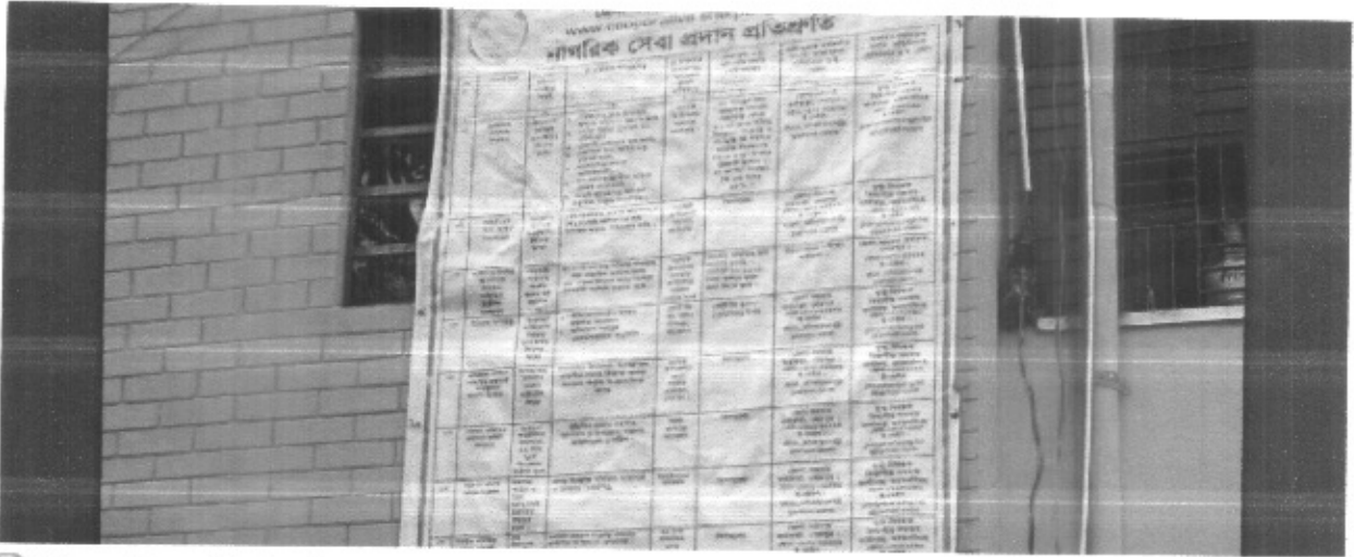
সিটিজেন চার্টার ১৫ প্রতিক (২৩-২৪).pdf