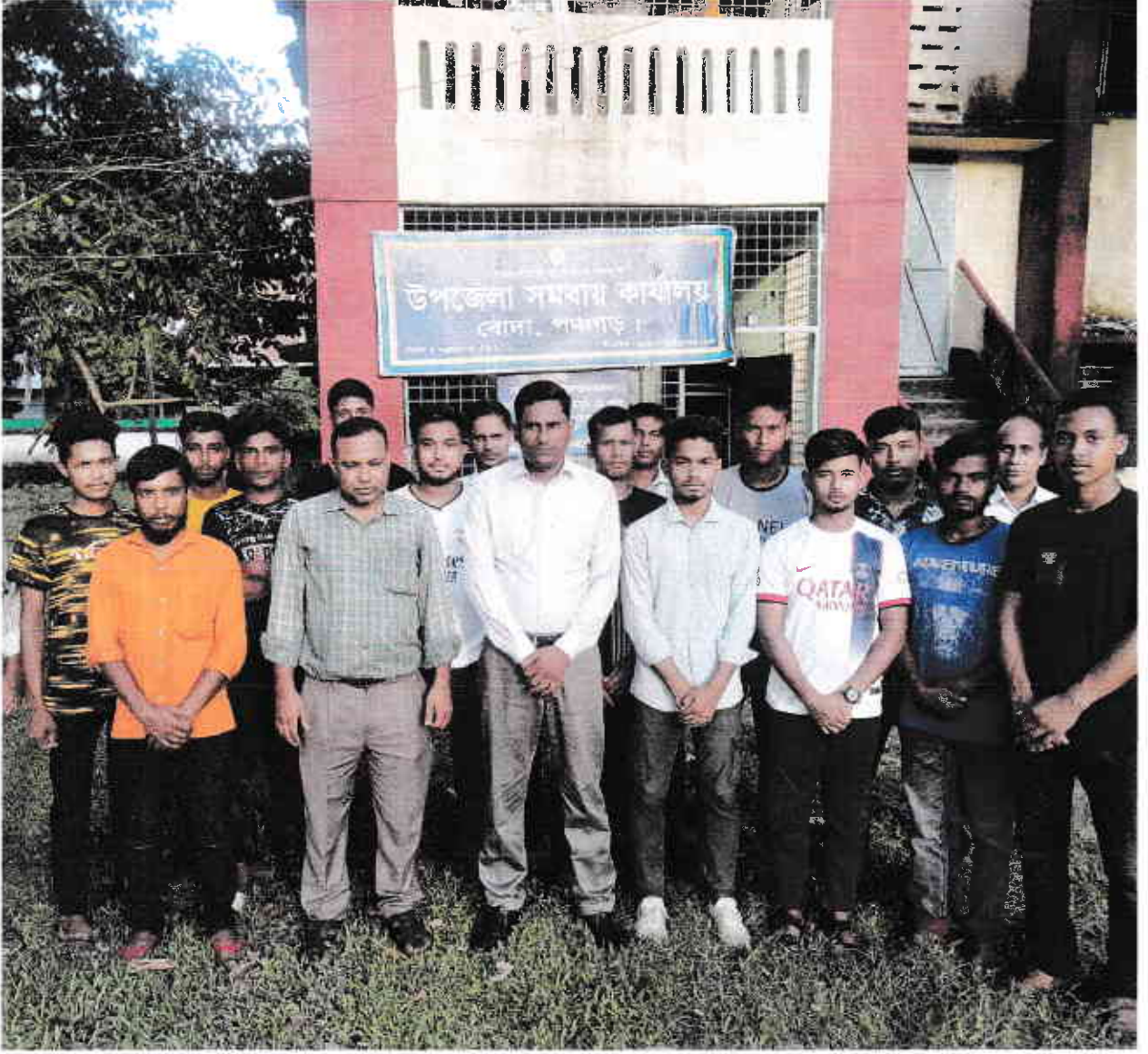
০২/১০/২০২৩ খ্রিঃ তারিখে সি,ভি,ডি,বি, প্রকল্পের ২০ (বিশ) জন সদস্যকে ৬০ দিন ব্যাপী দিনাজপুর ইনস্টিটিউট ইলেক্ট্রিক্যাল ইন্সটলেশন প্রশিক্ষণ কোর্সে প্রশিক্ষণার্থী প্রেরণের স্থির চিত্র।