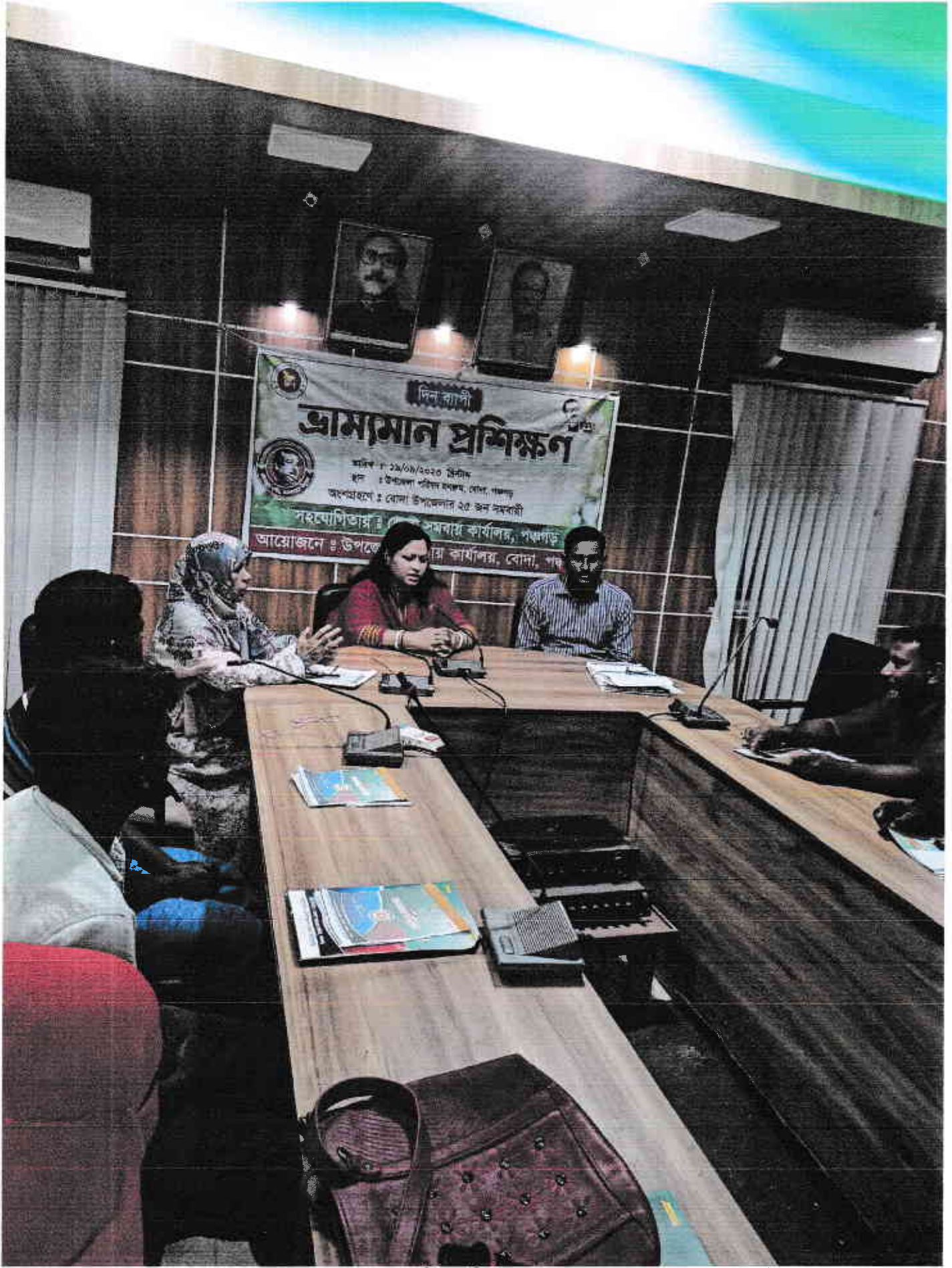
অত্র উপজেলায় ১৯-০৯-২০২৩ খ্রিঃ তারিখে ব্রাহ্ম্যমান প্রশিক্ষণের অনুষ্ঠিতব্য স্থির চিত্র।