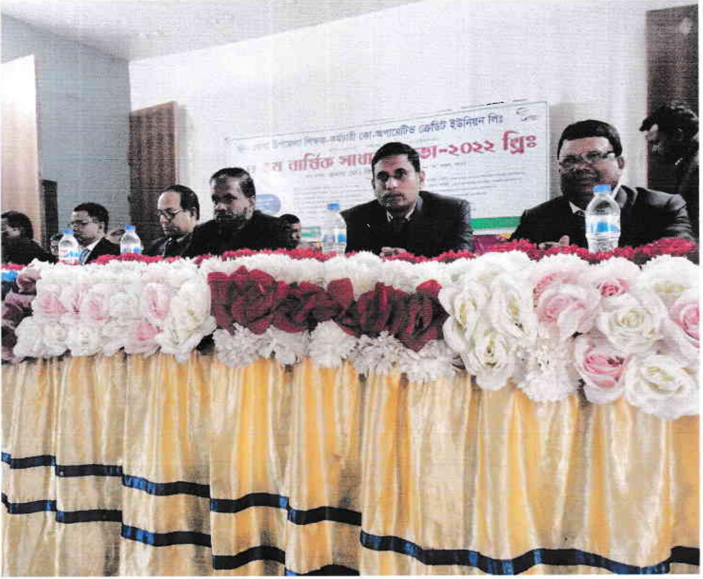
বোদা উপজেলা শিক্ষক কো-অপারেটিভ ক্রেডিট ইউনিয়নের বার্ষিক সাধারণ সভা ২০২২ খ্রিঃ এর স্থির চিত্রঃ