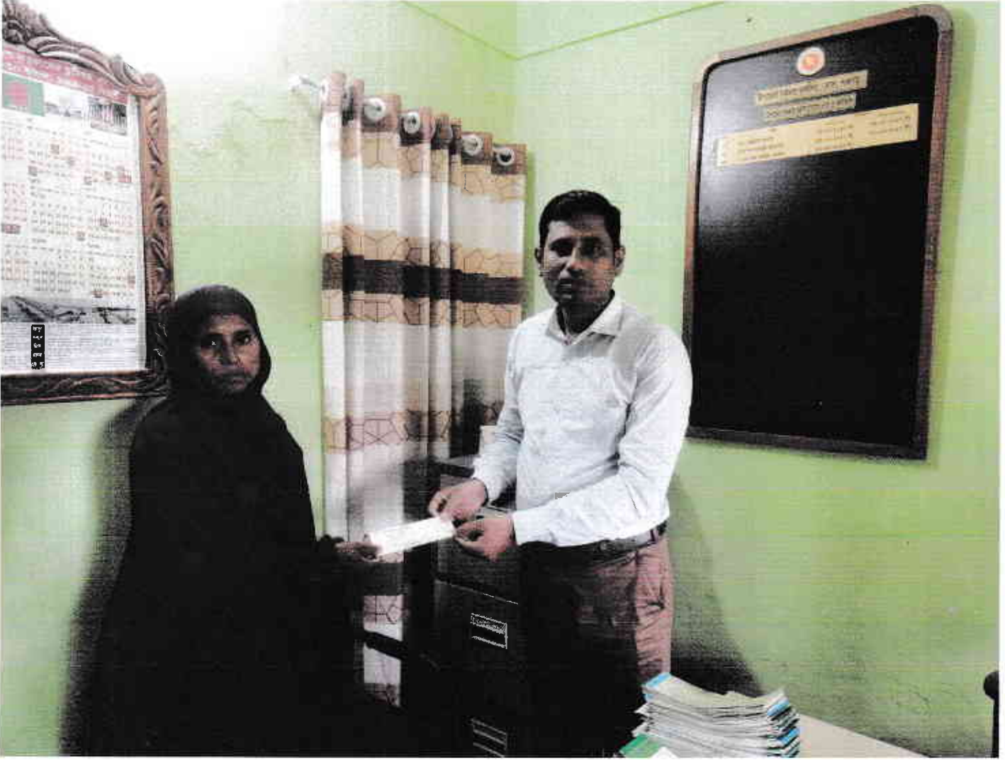
উন্নত জাতের গাভী পালনের মাধ্যমে সুবিধাবঞ্চিত মহিলাদের জীবনযাত্রার মান উন্নয়ন প্রকল্পের চেক বিতরণের স্থির চিত্রঃ