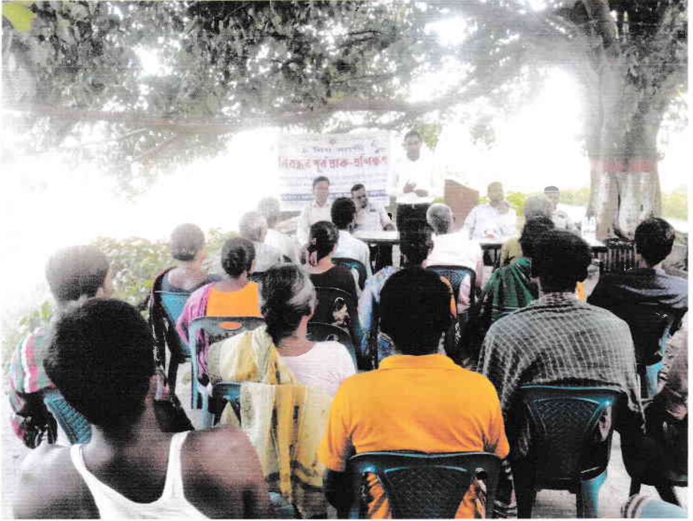
করতোয়া কৃষি উন্নয়ন সমবায় সমিতি লিঃ এর নিবন্ধন পূর্ব প্রাক-প্রশিক্ষণ সভার স্থির চিত্র।