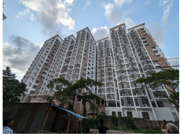
চিত্র: চেয়ারম্যান, চাউক কর্তৃক সিডিএ স্কয়ার প্রকল্প এলাকা পরিদর্শনের স্থির চিত্র।