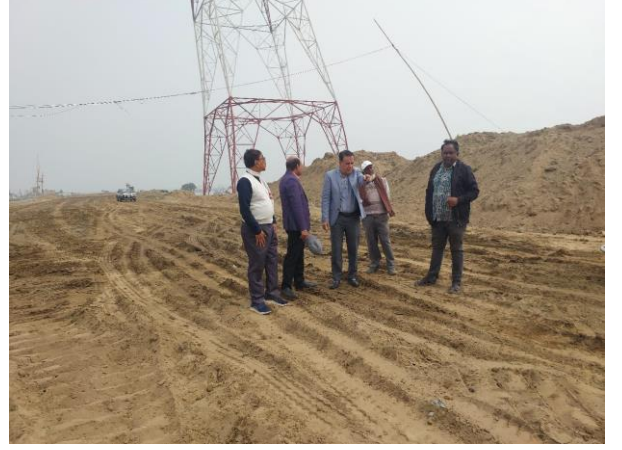
চিত্র: কর্ণফুলী রোড প্রকল্প এলাকা পরিদর্শনের স্থির চিত্র।

৪। প্রকল্পের নাম: চট্টগ্রাম শহরের জলাবদ্ধতা নিরসনকল্পে খাল পুন: খনন, সম্প্রসারণ, সংস্কার ও উন্নয়ন।