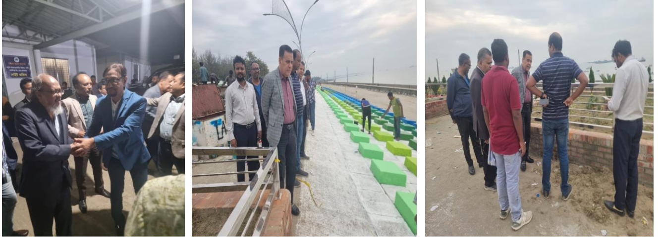
চিত্র: চসিক এর মাননীয় মেয়র মহোদয় ও চেয়ারম্যান, চউক কর্তৃক রিং রোড প্রকল্প এলাকা পরিদর্শনের স্থির চিত্র।