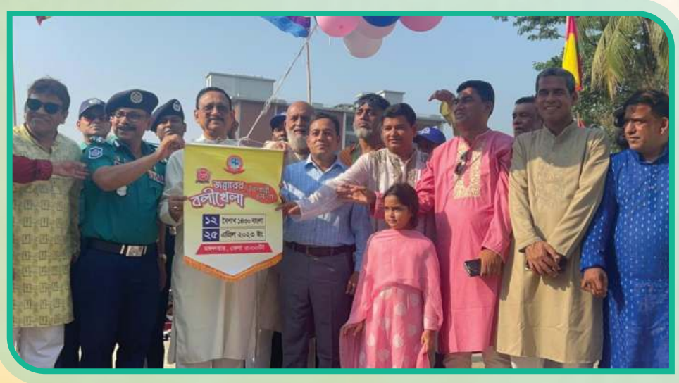
চট্টগ্রামের ঐতিহ্যবাহী জব্বারের বলিখেলা উদ্বোধন করছেন মাননীয় মেয়ের (২৫.০৪.২০২৩)।