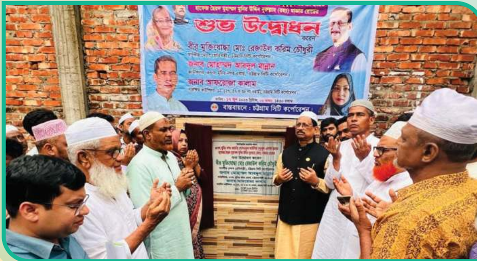
৩৭ নং উত্তর মধ্যম হালিশহরের উন্নয়নে মোট ১৬টি প্রকল্প শুভউদ্বোধন করছেন মাননীয় মেয়র (১৪.০৬.২০২৩)