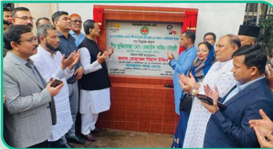
১৫ নং বাগমণিরাম ওয়ার্ডস্থ চট্টগ্রাম সিটি কর্পোরেশনের রেস্ট হাউসের সংস্কার ও আধুনিকায়নের শুভউদ্বোধন করছেন মাননীয় মেয়র (০১.০২.২০২৩)।