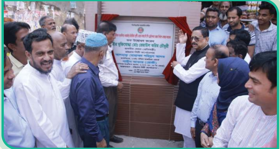
১৭ নং পশ্চিম বাকলিয়া ওয়ার্ডস্থ চাঁনমিয়া মুসী সড়কের আরসিসি ডেনসহ সড়ক নির্মাণ কাজের উদ্বোধন করছেন মাননীয় মেয়র (১৪.০৩.২০২৩)।