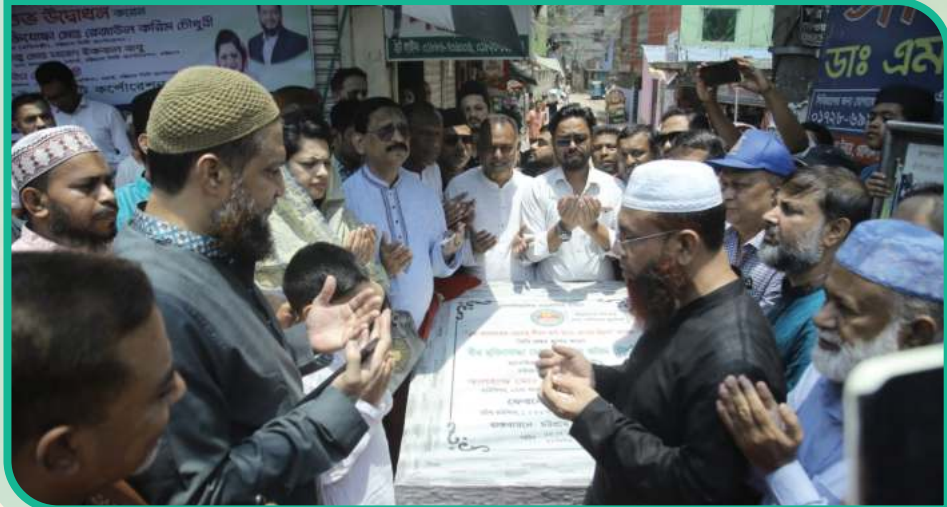
২ নং জালালাবাদ ওয়ার্ডের শীতলঝরনা আবাসিক এলাকায় হাজী আব্দুল মিয়া সড়কের উন্নয়ন কাজের শুভউদ্বোধন করেন মাননীয় মেয়র (১০.০৫.২০২৩)।