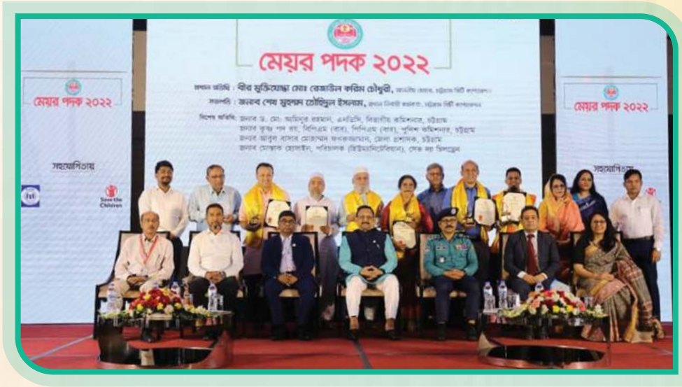
মেয়ের পদক-২০২২ প্রদান অনুষ্ঠান: চট্টগ্রাম সিটি কর্পোরেশন এর পক্ষ থেকে মেয়ের পদক-২০২২ প্রদান করা হয় (১৩.০৩.২০২৩)।