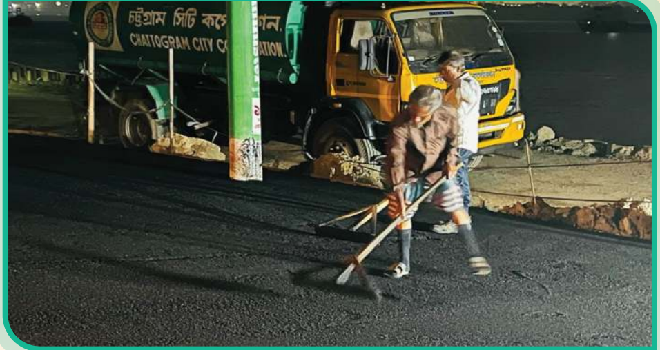
৪১ নং পতেঙ্গা ওয়ার্ডসহ ১৮ নং ব্রীজ সংলগ্ন আবুল খায়ের শুকানী ব্রীজের কাপেটিং করা হচ্ছে (০৬.০৪.২০২৩)।