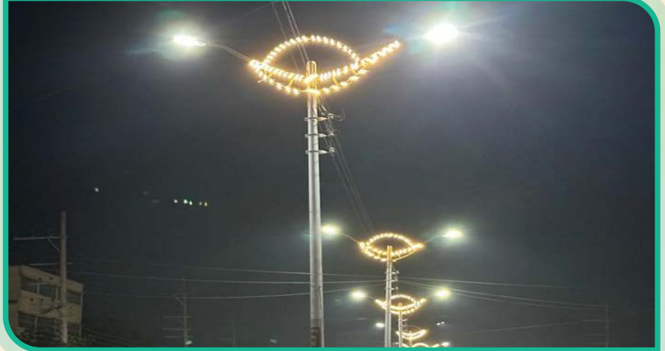
সড়ক বাতি ছবি-০২