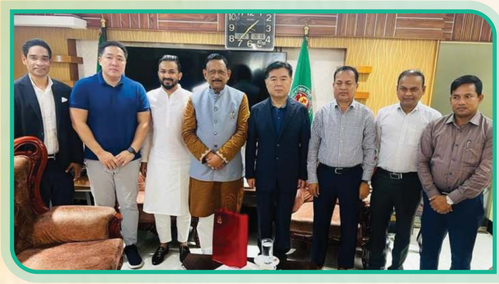
মাননীয় মেয়র-এর সাথে ওয়েস্ট ম্যানেজমেন্ট প্রকল্পের বিষয়ে কোরিয়ান প্রতিনিধি দলের মত বিনিময় (১২.১০.২০২২)।