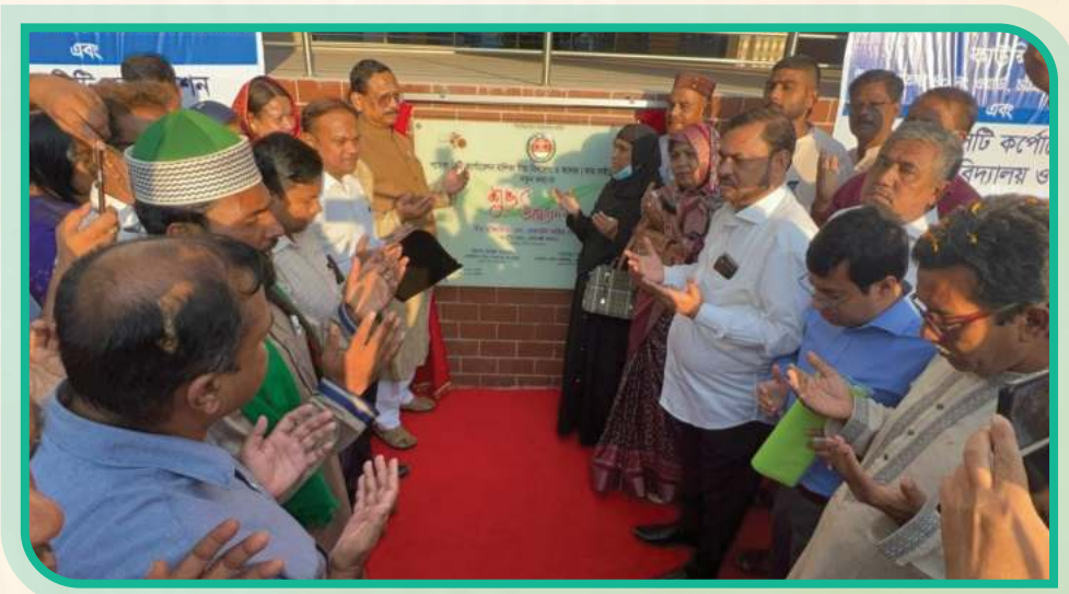
চট্টগ্রামের লাইফ লাইন খ্যাত পোর্ট কানেক্টিং (অলংকার হতে নিমতলা) পর্যন্ত সড়কের উদ্বোধন কালে মাননীয় মেয়র।