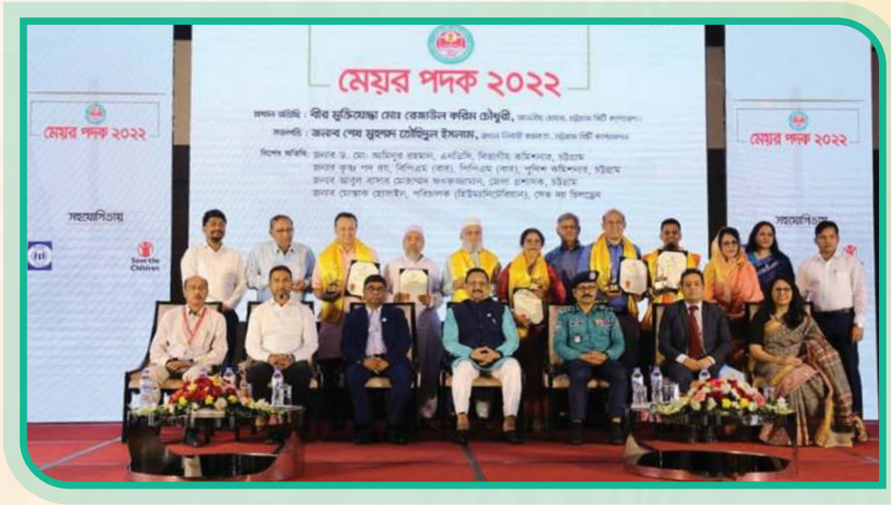
মেয়র পদক-২০২২ প্রদান অনুষ্ঠান: চট্টগ্রাম সিটি কর্পোরেশন এর পক্ষ থেকে মেয়র পদক-২০২২ প্রদান করা হয় (১৩.০৩.২০২৩)।