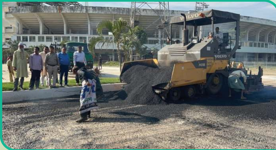
বাংলাদেশ-ভারত আন্তর্জাতিক ক্রিকেট ম্যাচ উপলক্ষে জহুর আহমেদ চৌধুরী স্টেডিয়াম এলাকার প্যাঁচওয়ার্ক কার্যক্রম (০৭.১২.২০২২)।