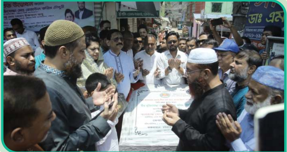
২ নং জালালাবাদ ওয়ার্ডের শীতলঝরনা আবাসিক এলাকায় হাজী আব্দুল মিয়া সড়কের উন্নয়ন কাজের শুভউদ্বোধন করেন মাননীয় মেয়র (১০.০৫.২০২৩)।