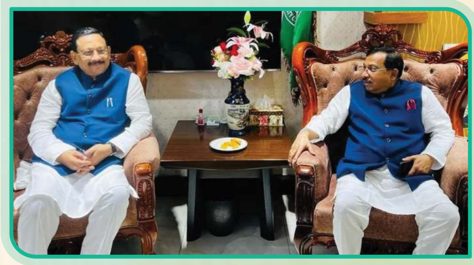
মাননীয় মেয়র-এর সাথে সৌজন্য সাক্ষাতে পটিয়া (চট্টগ্রাম-১২) আসনের সংসদ সদস্য ও জাতীয় সংসদের মাননীয় হুইপ জনাব মোঃ শামসুল হক চৌধুরী (১৪.১১.২০২২)