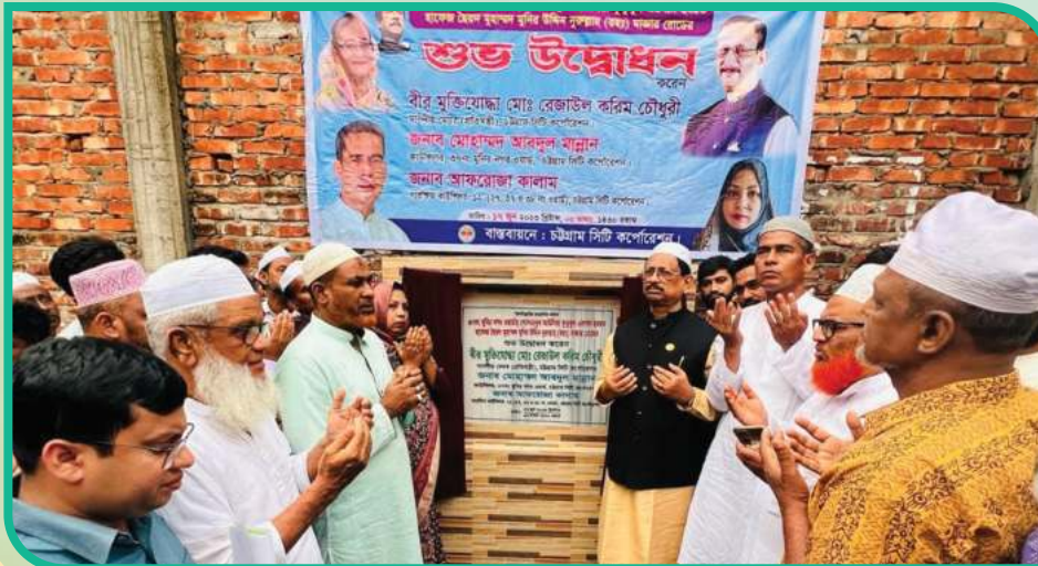
৩৭ নং উত্তর মধ্যম হালিশহরের উন্নয়নে মোট ১৬টি প্রকল্প শুভউদ্বোধন করছেন মাননীয় মেয়র (১৪.০৬.২০২৩)