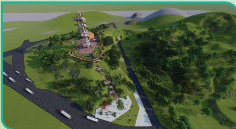
প্রস্তাবিত ওয়াচ টাওয়ার (স্থান : বাটালী হিল, টাইগারপাস, চট্টগ্রাম)।