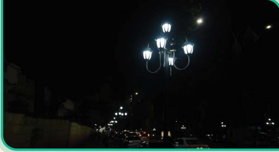
সড়ক বাতি ছবি-০১