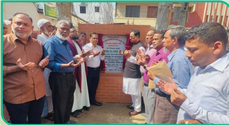
৬ নং পূর্ব ষোলশহর ওয়ার্ডস্থ বহরদারবাড়ি হাজরত আবিদ শাহ সড়ক, কাজীবাড়ী সড়ক এবং করমপাড়া পর্যন্ত উন্নয়ন ও লেন, বাইলেন উন্নয়ন (লট-২) কাজের উদ্বোধন করছেন মাননীয় মেয়র (১৪.০২.২০২৩)।