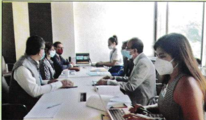
UNCTAD এর সঙ্গে দ্বিপাক্ষিক সভায় উপস্থিত বাংলাদেশ প্রতিনিধি দল