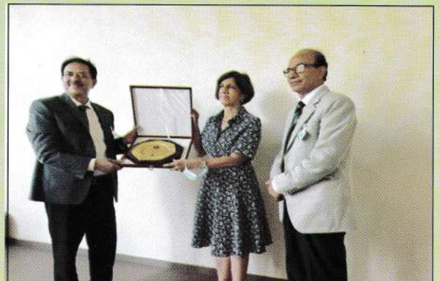
UNCTAD, CCPB এর প্রধানের হাতে ক্রেস্ট তুলে দিচ্ছেন কমিশনের চেয়ারপার্সন