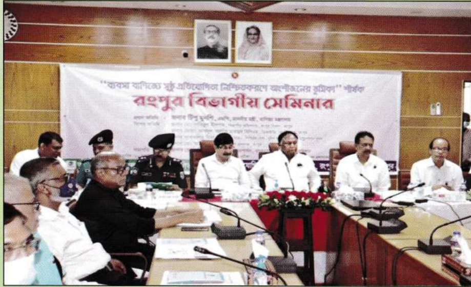
“ব্যবসা বাণিজ্যে সূষ্ঠু প্রতিযোগিতা নিশ্চিতকরণে অংশীজনের ভূমিকা” শীর্ষক রংপুর বিভাগীয় সেমিনারে বক্তব্য রাখছেন জনাব টিপু মুনশি, এমপি, মাননীয় মন্ত্রী, বাণিজ্য মন্ত্রণালয়