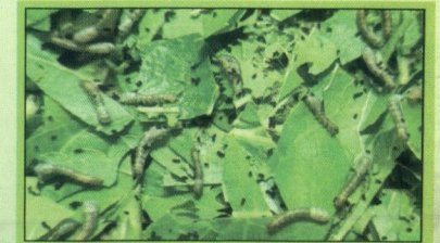
মেটে কলপের পলু

ডিম থেকে সদ্য মুখানো পলু ব্রাশিং করে বা ঝেড়ে নিয়ে পলুপালন ডালাতে স্থানান্তর করার পর থেকেই "মেটে কলপ" শুরু হয়। মেটে কলপে পলু ১২/১৩ ফিডিং অর্থাৎ ৩-৩ ৪ দিন পাতা খায়। মেটে কলপে পলু ২০ ঘন্টা রহা অবস্থায় থাকে।