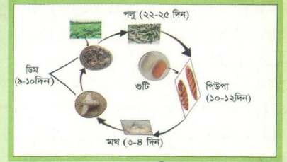
রেশম পোকাকার জীবনচক্র

মেটে কলপ হতে তে কলপের রহা থেকে উঠা পর্যন্ত অল্প বয়সের পলুকে চাকী পলু বলে। শোধ কলপ ও রোজের পলুকে বয়স্ক পলু বলা হয়।