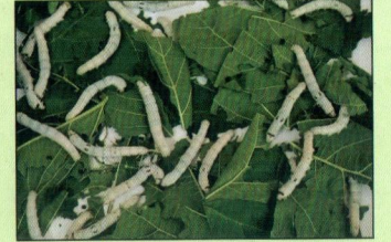
শোধ কলপের পলু

তেকলপের পলু রহা থেকে উঠেই শোধ কলপে গমন করে। শোধ কলপে সদ্য উঠা পলু দেখলে বোঝা যায়। পলু মাথা মোটা হয় এবং শরীর কুচকানো ও ধূসর রঙের হয়। এসময় পলুর ওজন ১০-১২% কমে যায়। এ কলপে পলু সাধারণত ৪-৪ ১/৪ দিন অর্থাৎ ১৬/১৭ ফিডিং পাতা খায়। শোধ কলপে পলু ২৮-৩০ ঘন্টা রহা অবস্থায় থাকে।