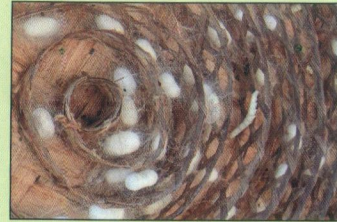
চন্দ্রকীতে রেশমগুটি তৈরি

ডালা থেকে পাকা পলু অর্থাৎ সোনালী ও চাকচিক্যের পলু চন্দ্রকীতে দেয়া হয়। চন্দ্রকীতে পলু দেয়ার পর ৭/৮ ঘন্টার মধ্যে পলু শেষ মলমূত্র ত্যাগ করে গুটি তৈরী করা শুরু করে এবং ৩৬-৪৮ ঘন্টার মধ্যে গুটি করা শেষ করে। পলু চন্দ্রকীতে দেওয়ার পর থেকে গুটি তৈরী শেষ করা পর্যন্ত প্রায় ২ দিন সময় লাগে। তবে গরমের সময় ২-৪ ঘন্টা কম এবং শীতে কিছু সময় বেশী লাগে।