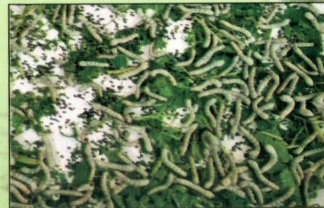
তে কলপের পলু

দোকলপে রহা থেকে উঠার পর পলু তেকলপে স্থানান্তরিত হয় এবং ৩-৩ ১/২ দিন স্থায়ী হয়।