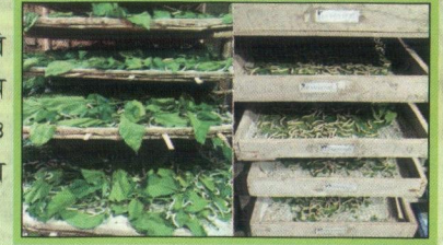
আদর্শ পলুঘরে পলুপালন

আদর্শ পলুঘরে কাঠের বা বাঁশের চাটাই এর তৈরি ডালাতে রেশম পোকা পালন করাকে পলুপালন বলে। পলুপালনের ক্ষেত্রে পরিমিত তাপমাত্রা ও আর্দ্রতা খুবই গুরুত্বপূর্ণ উপাদান। রেশম পোকাকে স্থানীয় ভাষায় পলু বলা হয়।