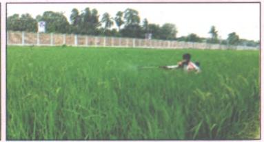
চিত্র ২: A লাইনে GA 3 প্রয়োগ