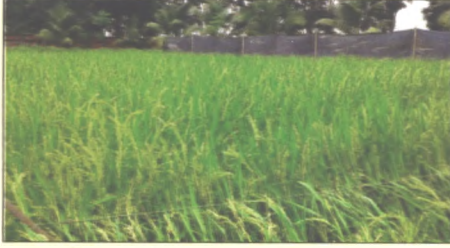
চিত্র ৩: রশি টেনে সম্পূরক পরাগায়ন