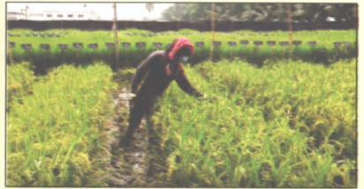
চিত্র ৪: R লাইন কর্তনের পর F_1 বীজ কাটার আগে অবাঞ্ছিত গাছ বাছাই