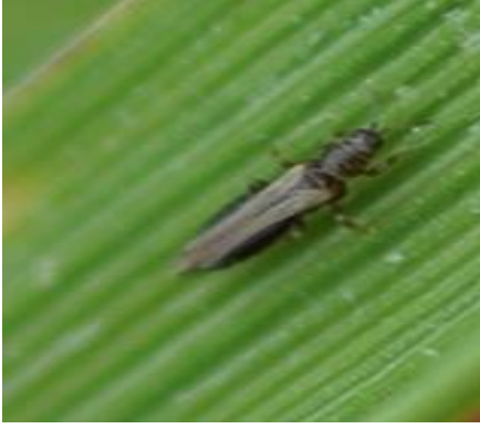
চিত্র ১: পূর্ণ বয়স্ক পোকা

পূর্ণবয়স্ক থ্রিপস খুবই ছোট (১-২ মিলিমিটার লম্বা), গাঢ় বাদামি রঙের। এরা পাখা বিশিষ্ট বা পাখা বিহীন হতে পারে। স্ত্রী পোকা পাতার মধ্যে ডিম ঢুকিয়ে দেয়। ডিমগুলো খুবই ছোট (১/৪ মিলি মিটার লম্বা)। প্রথম অবস্থায় ডিমগুলো স্বচ্ছ থাকে এবং ফোটার আগে আস্তে আস্তে হলদে রঙ ধারণ করে। সদ্য ফোটা ব্যাচাগুলো কিছুক্ষণ নিশ্চল থাকে। পরে মাঝখানের কচি পাতা ও পাতার খোলে গিয়ে খাওয়া শুরু করে এবং পূর্ণবয়স্ক হওয়ার পরও তাদের জীবনকাল এখানেই কাটায়। এ পোকা বাচ্চা ও পূর্ণবয়স্ক উভয় অবস্থায় ধানের পাতার রস শুষে খায়। ধানের বীজতলা এবং প্রাথমিক কুশি অবস্থায় গাছ বেশী আক্রান্ত হয়। সব মৌসুমে এই পোকাকার প্রাদুর্ভাব দেখা যায় তবে আউশ মৌসুমে প্রকোপ বেশী থাকে। আক্রান্ত গাছের পাতাগুলো লম্বালম্বিভাবে মুড়িয়ে সুচের মত আকার ধারণ করে। খুব বেশী আক্রান্ত পাতা শুকিয়ে মারা যায়।