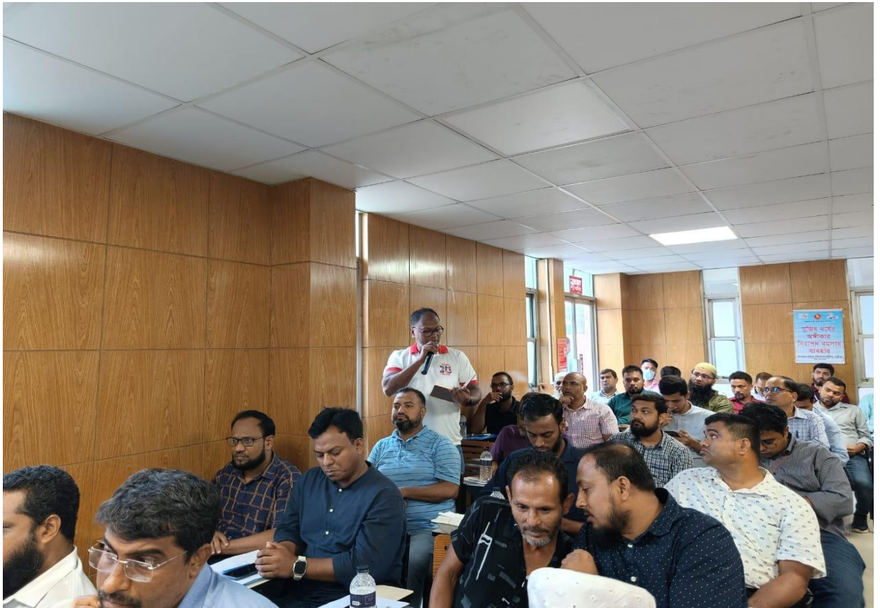
উপ-প্রধান বয়লার পরিদর্শকের কার্যালয়, গাজীপুর কর্তৃক আয়োজিত “বয়লার আইন, ২০২২ বাস্তবায়ন এবং দুর্নীতি প্রতিরোধ” শীর্ষক গণশুনানির একাংশ