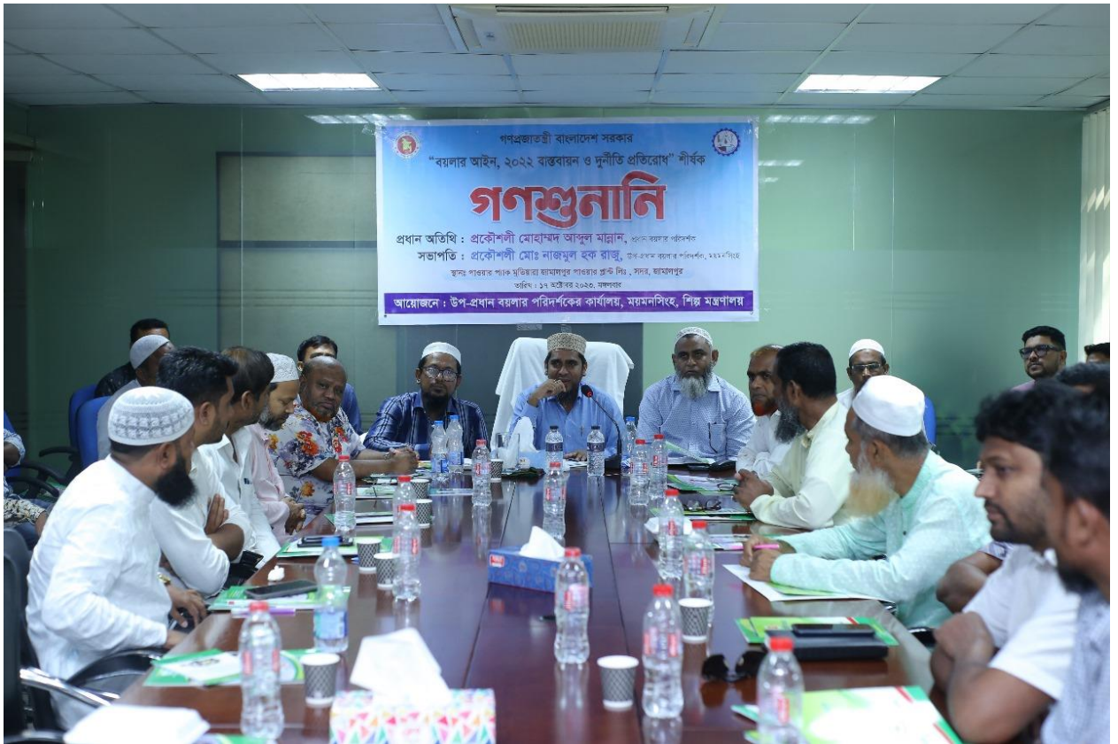
উপ-প্রধান বয়লার পরিদর্শকের কার্যালয়, ময়মনসিংহ কর্তৃক আয়োজিত “বয়লার আইন, ২০২২ বাস্তবায়ন এবং দুর্নীতি প্রতিরোধ” শীর্ষক গণশুনানির একাংশ