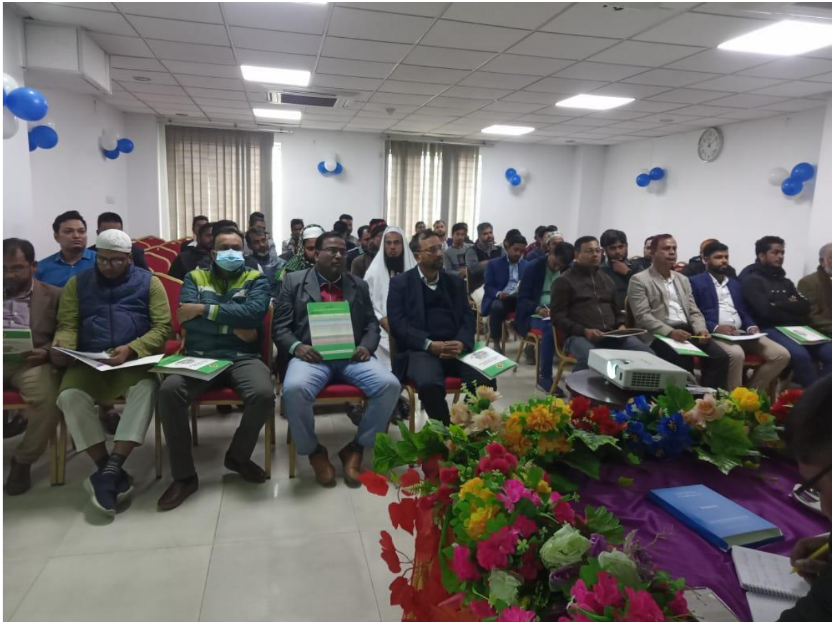
উপ-প্রধান বয়লার পরিদর্শকের কার্যালয়, খুলনা কর্তৃক আয়োজিত “বয়লার আইন, ২০২২ বাস্তবায়ন এবং দুর্নীতি প্রতিরোধ” শীর্ষক গণশুনানির একাংশ