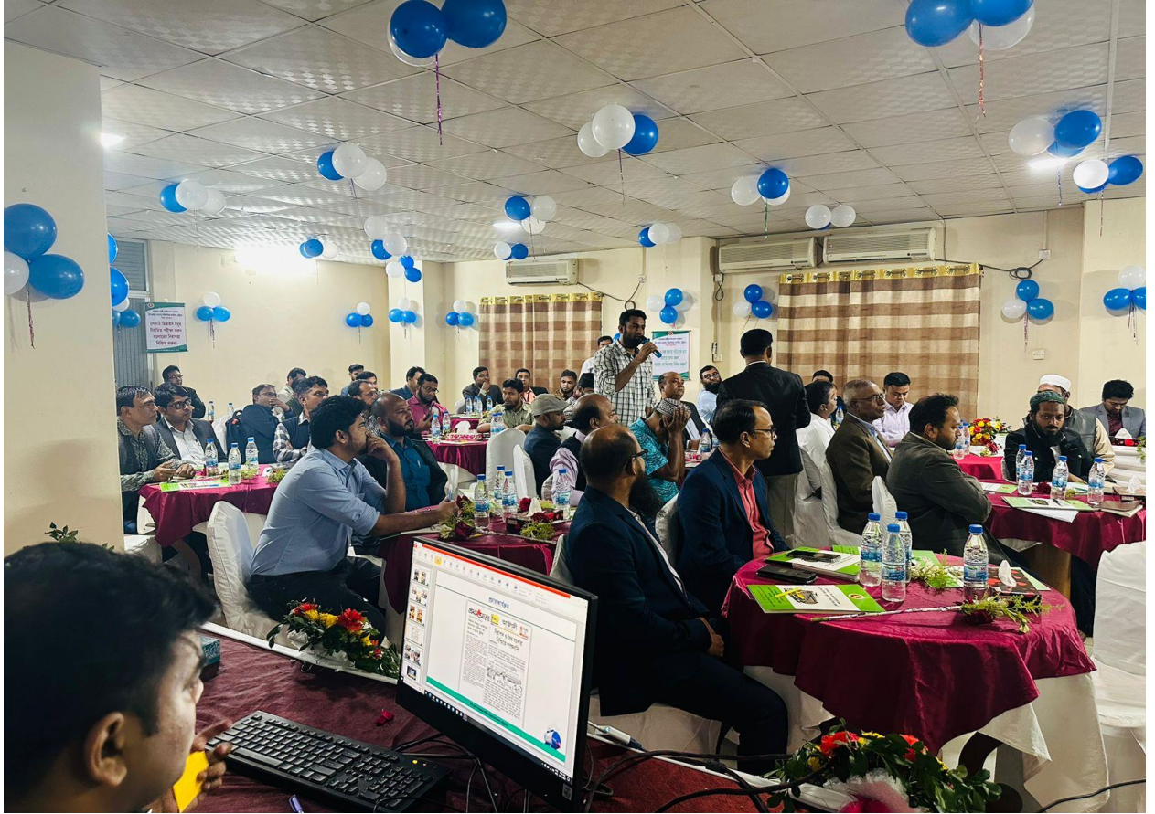
উপ-প্রধান বয়লার পরিদর্শকের কার্যালয়, চট্টগ্রাম কর্তৃক আয়োজিত “বয়লার আইন, ২০২২ বাস্তবায়ন এবং দুর্নীতি প্রতিরোধ” শীর্ষক গণশুনানির একাংশ