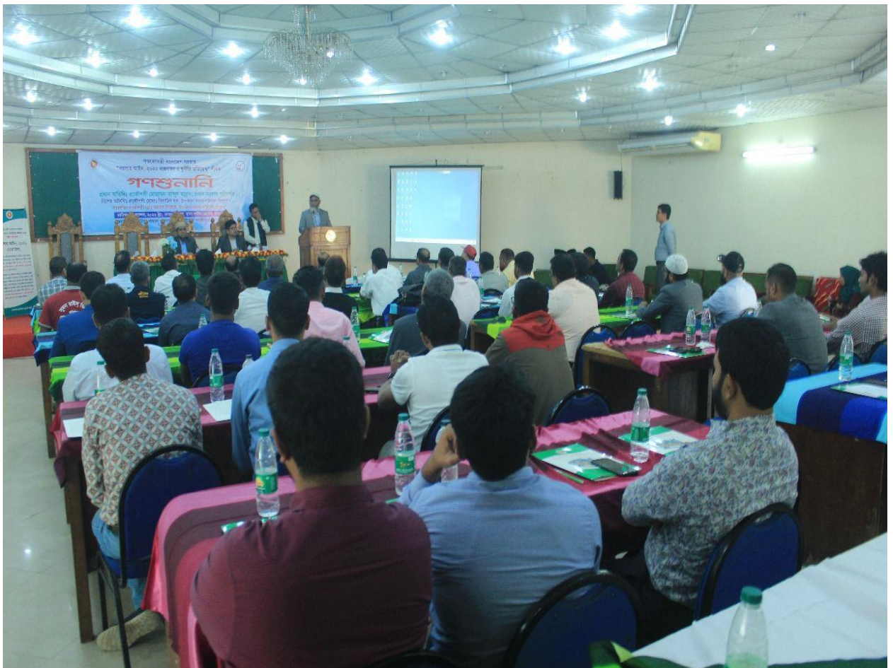
উপ-প্রধান বয়লার পরিদর্শকের কার্যালয়, রংপুর কর্তৃক আয়োজিত “বয়লার আইন, ২০২২ বাস্তবায়ন এবং দুর্নীতি প্রতিরোধ” শীর্ষক গণশুনানির একাংশ