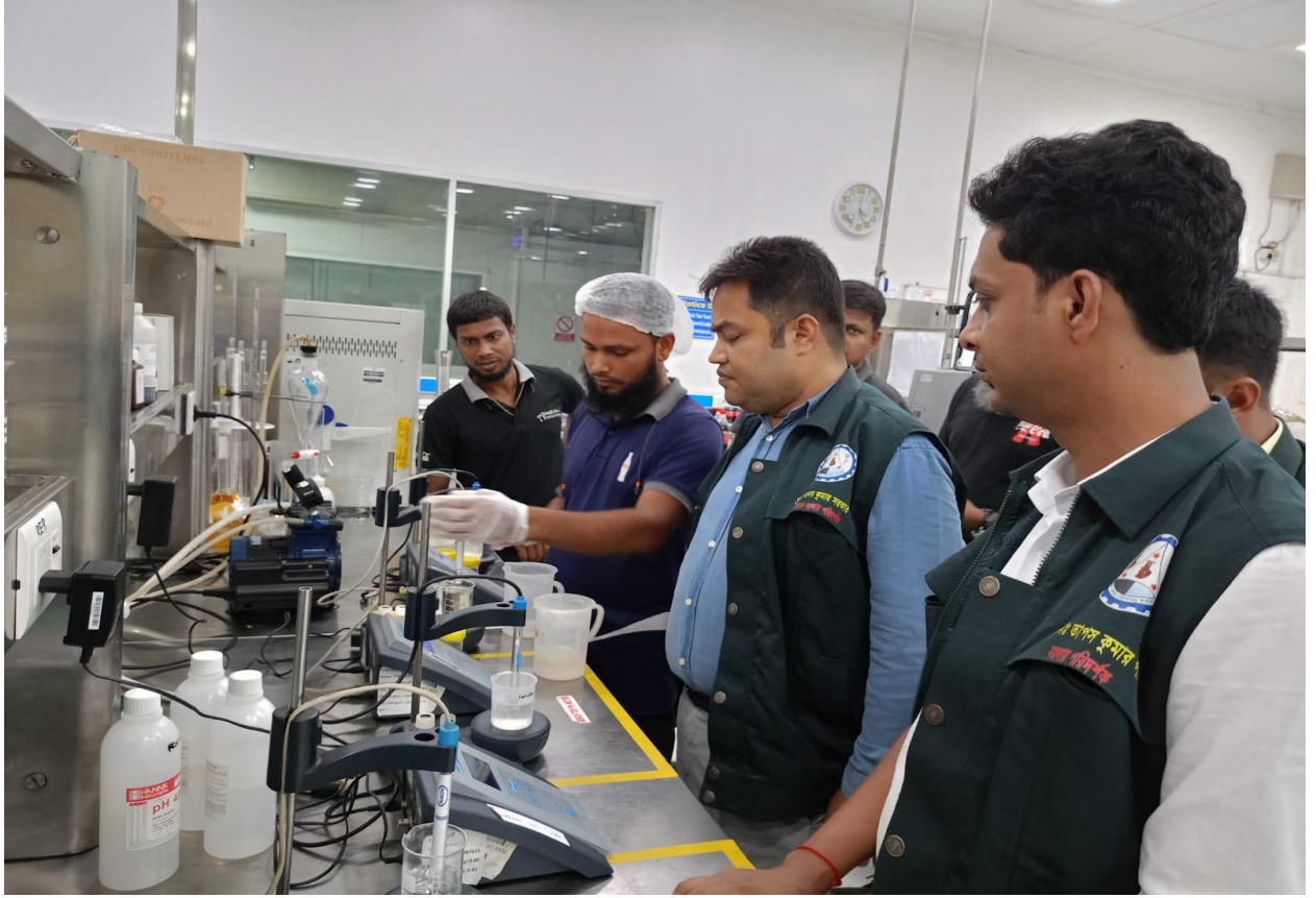
পানির মানমাত্রা পরীক্ষণ