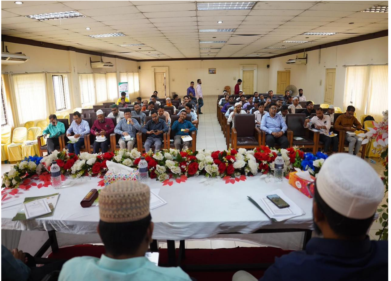
উপ-প্রধান বয়লার পরিদর্শকের কার্যালয়, নরসিংদী কর্তৃক আয়োজিত “বয়লার আইন, ২০২২ বাস্তবায়ন এবং দুর্নীতি প্রতিরোধ” শীর্ষক গণশুনানির একাংশ