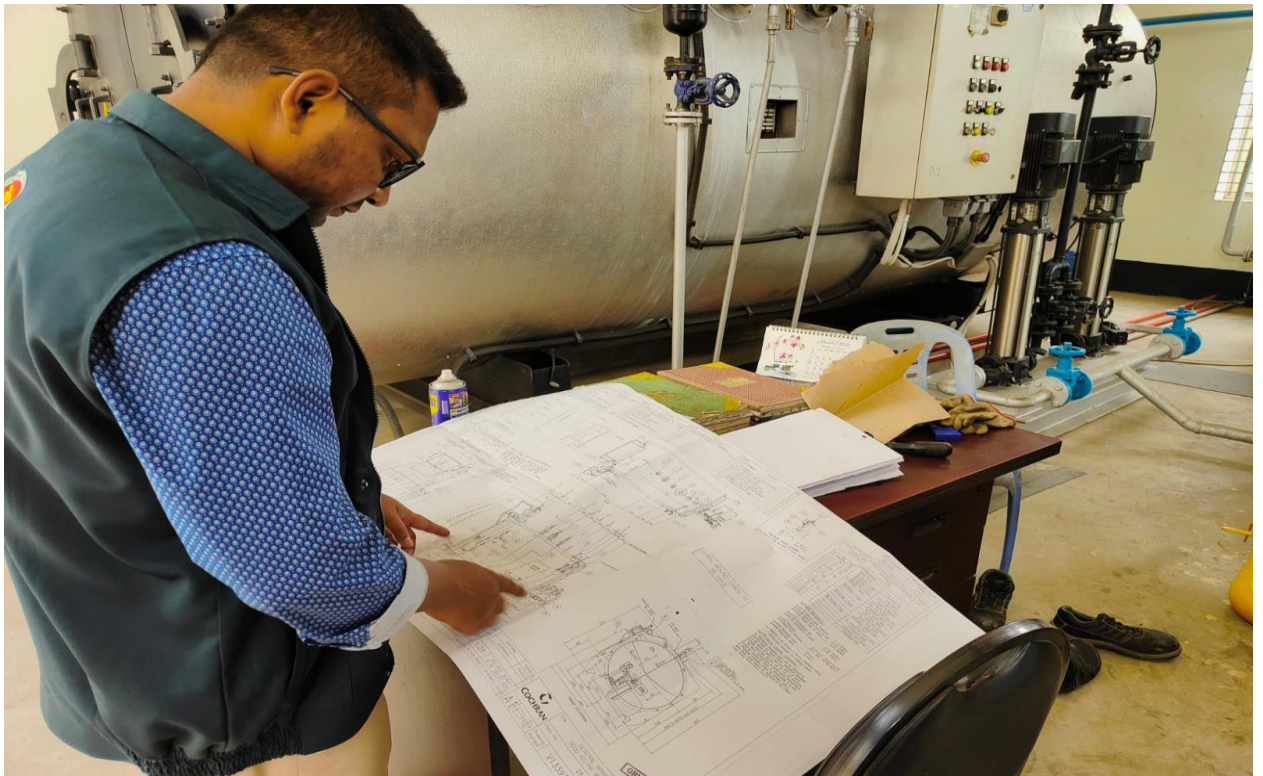
ড্রইং ডিজাইন পরীক্ষণ