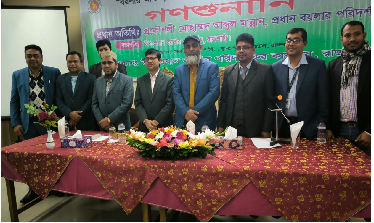
উপ-প্রধান বয়লার পরিদর্শকের কার্যালয়, রাজশাহী কর্তৃক আয়োজিত “বয়লার আইন, ২০২২ বাস্তবায়ন এবং দুর্নীতি প্রতিরোধ” শীর্ষক গণশুনানির একাংশ