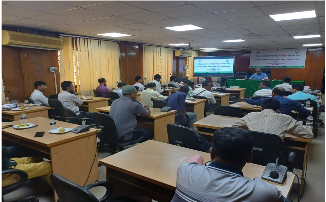
স্টেকহোল্ডারগণের সমন্বয়ে অভিযোগ প্রতিকার ব্যবস্থা বিষয়ক সভার একাংশ