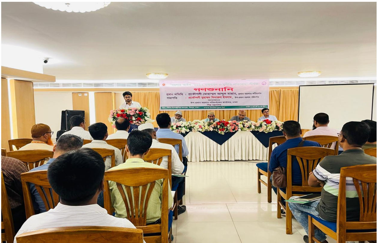
উপ-প্রধান বয়লার পরিদর্শকের কার্যালয়, ঢাকা কর্তৃক আয়োজিত গণশুনানির একাংশ