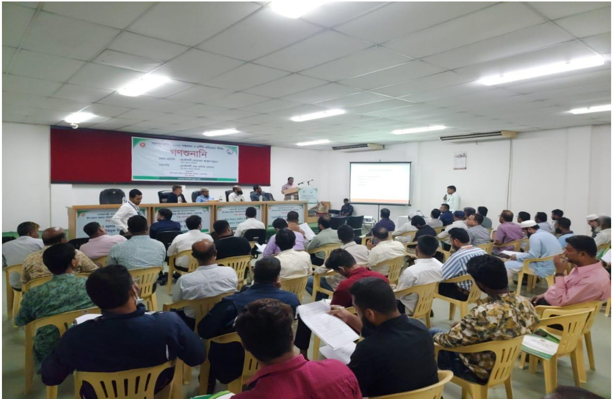
উপ-প্রধান বয়লার পরিদর্শকের কার্যালয়, নারায়ণগঞ্জ কর্তৃক আয়োজিত “বয়লার আইন, ২০২২ বাস্তবায়ন এবং দুর্নীতি প্রতিরোধ” শীর্ষক গণশুনানির একাংশ