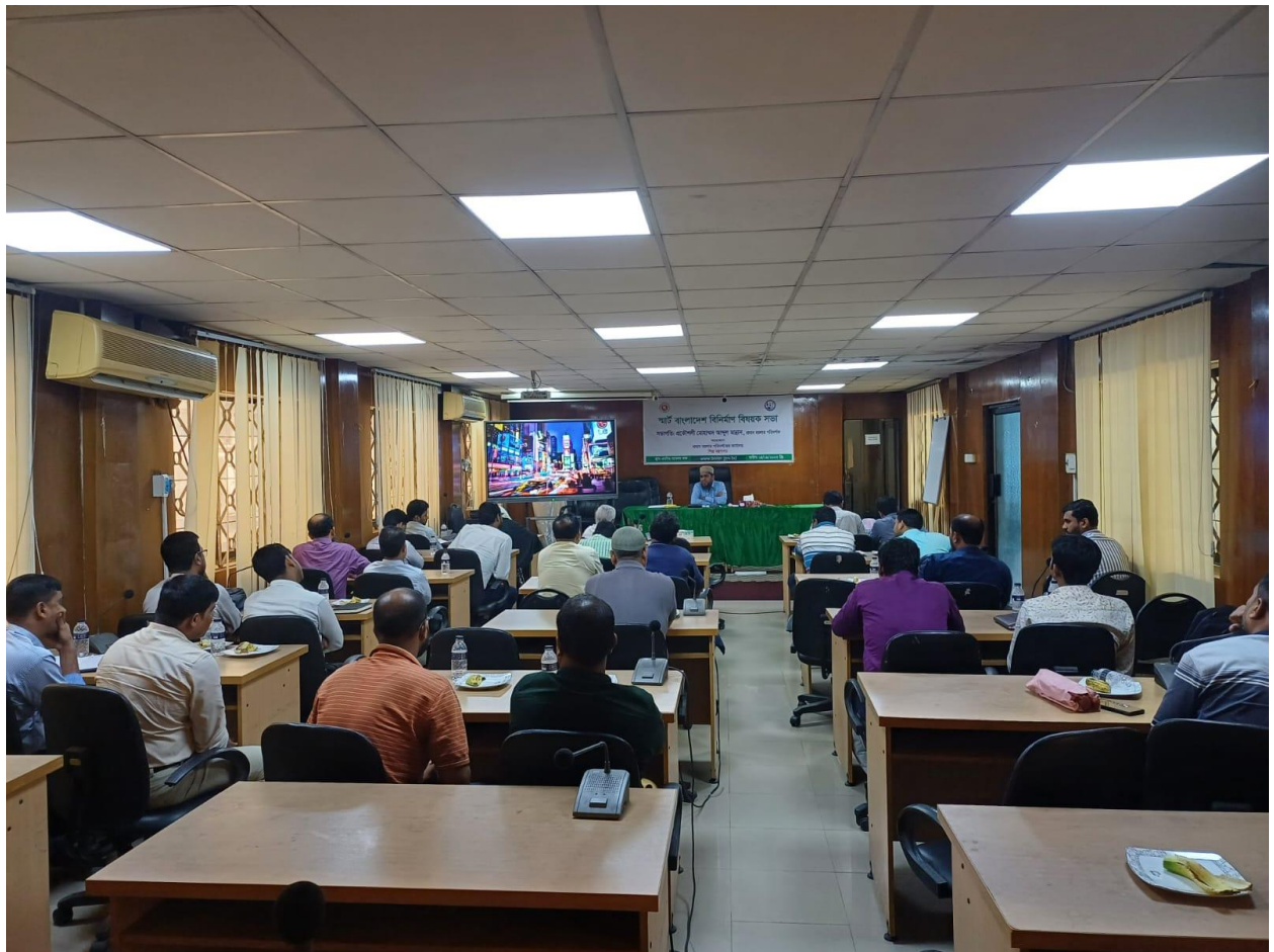
স্মার্ট বাংলাদেশ বিনির্মাণ বিষয়ক সভার একাংশ