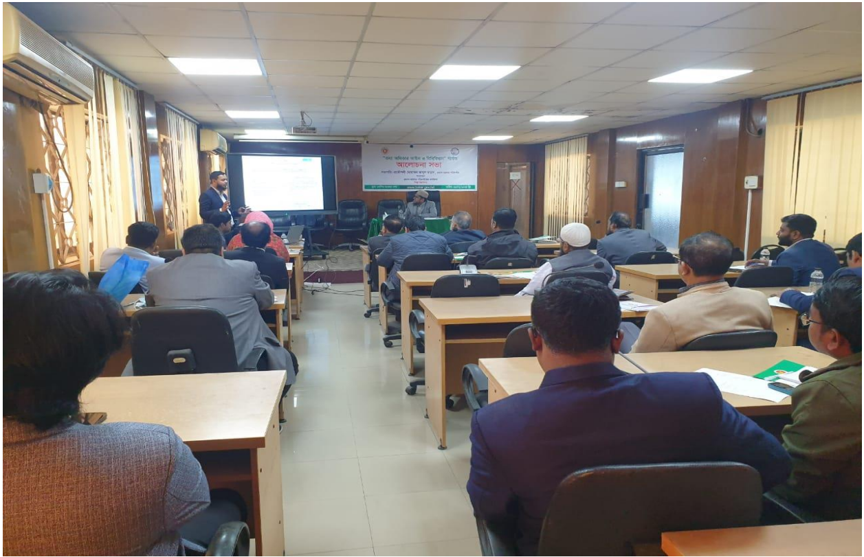
তথ্য অধিকার আইন ও বিধিবিধান সম্পর্কে জনসচেতনতা বৃদ্ধিকরণ সভার একাংশ