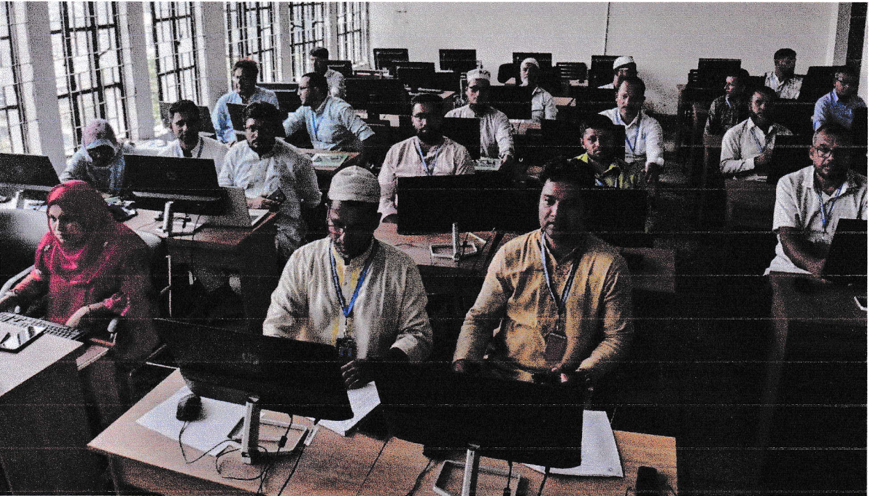
প্রশিক্ষার্থীদের কম্পিউটার ল্যাবে আইসিটি সেশন পরিচালনা করছেন বিএমটিটিআই-এর অধ্যক্ষ মহোদয়