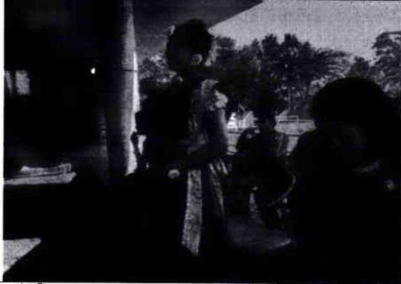
০২. উপস্থিত কল্ভতা