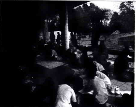
০৪. চিত্রাংকন প্রতিযোগিতা