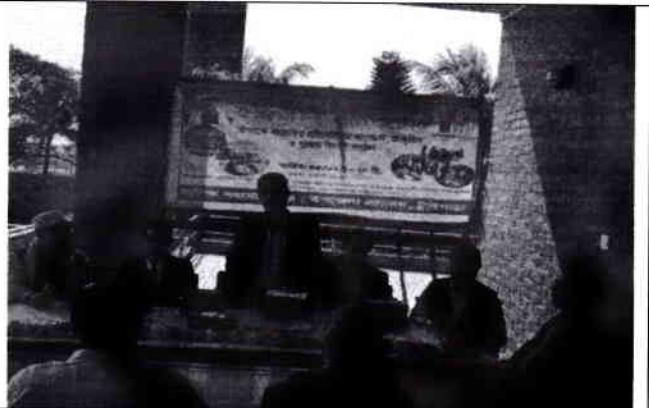
০৭. আলোচনা সভা : বক্তৃতা করছেন মিল্কভিটার চেয়ারম্যান।