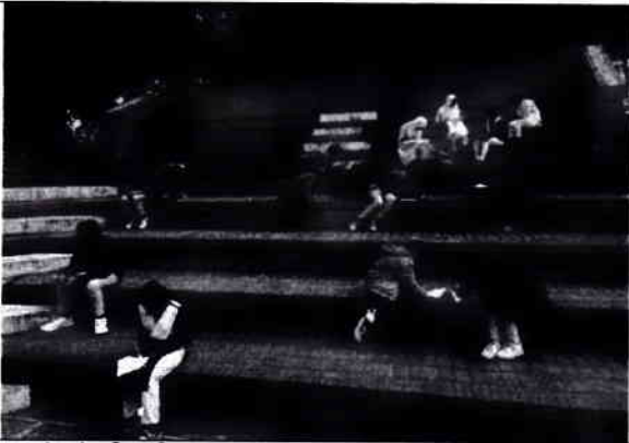
০৩. বইপাঠ প্রতিযোগিতা