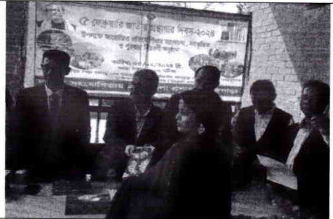
০৮. পুরস্কার প্রদান অনুষ্ঠান