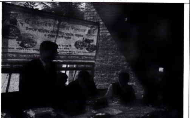
০৬. আলোচনা সভা : বক্তৃতা করছেন উপজেলা নির্বাহী অফিসার, চুঙ্গিপাড়া