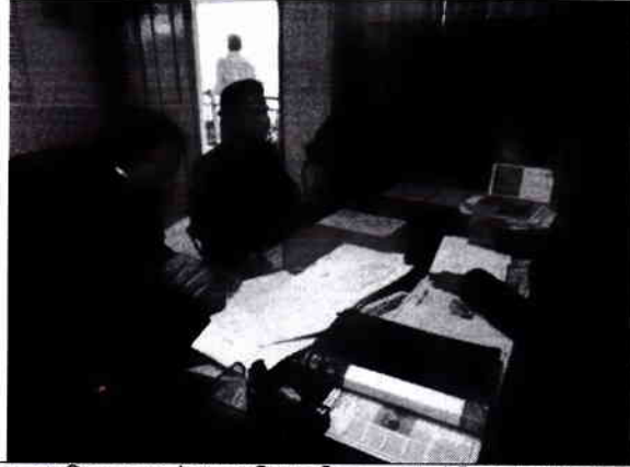
০১. প্রমুত্তিমূলক সভা, উপজেলা শিক্ষা অফিসারের দপ্তর, চুঙ্গিপাড়া, গোপালগঞ্জ।