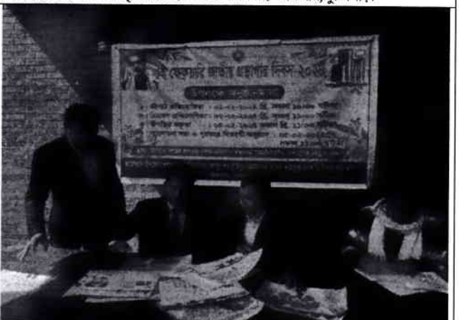
০৫. খাতা মূল্যায়ন

০৫/০২/২৪ ২৪/২/২৪ স্বাধীনতা স্বাধীনতা স্বাধীনতা