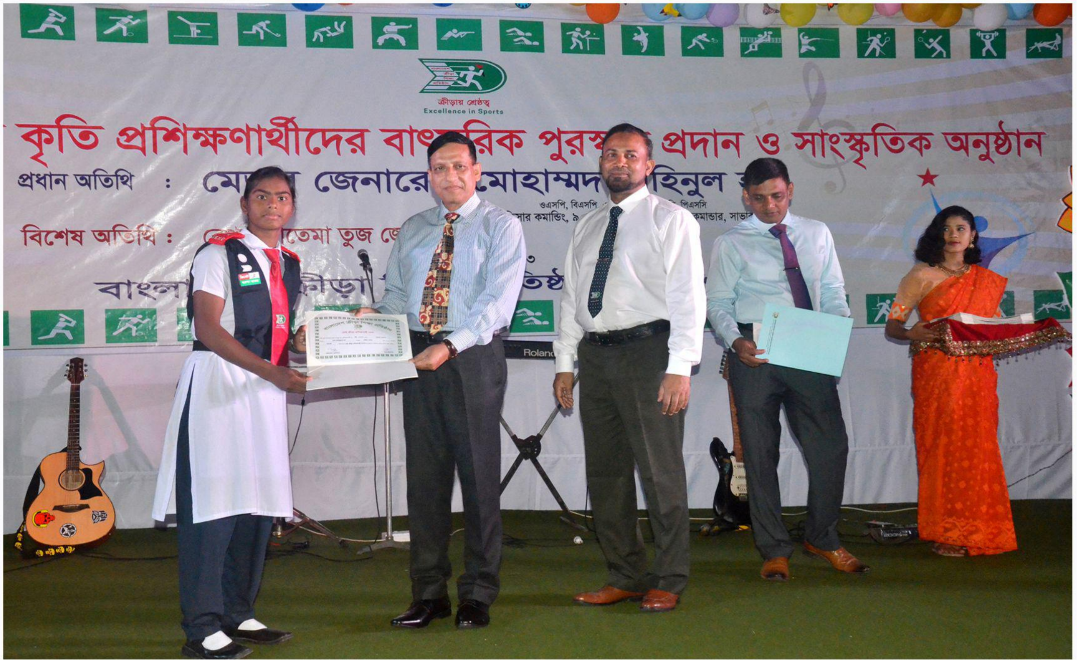
বিকেএসপি'র কৃতি প্রশিক্ষণার্থীদের বাৎসরিক 'সেরা খেলোয়াড় পুরস্কার' প্রদান অনুষ্ঠান-২০২৩। তারিখ: ২০/০৩/২০২৩খ্রি