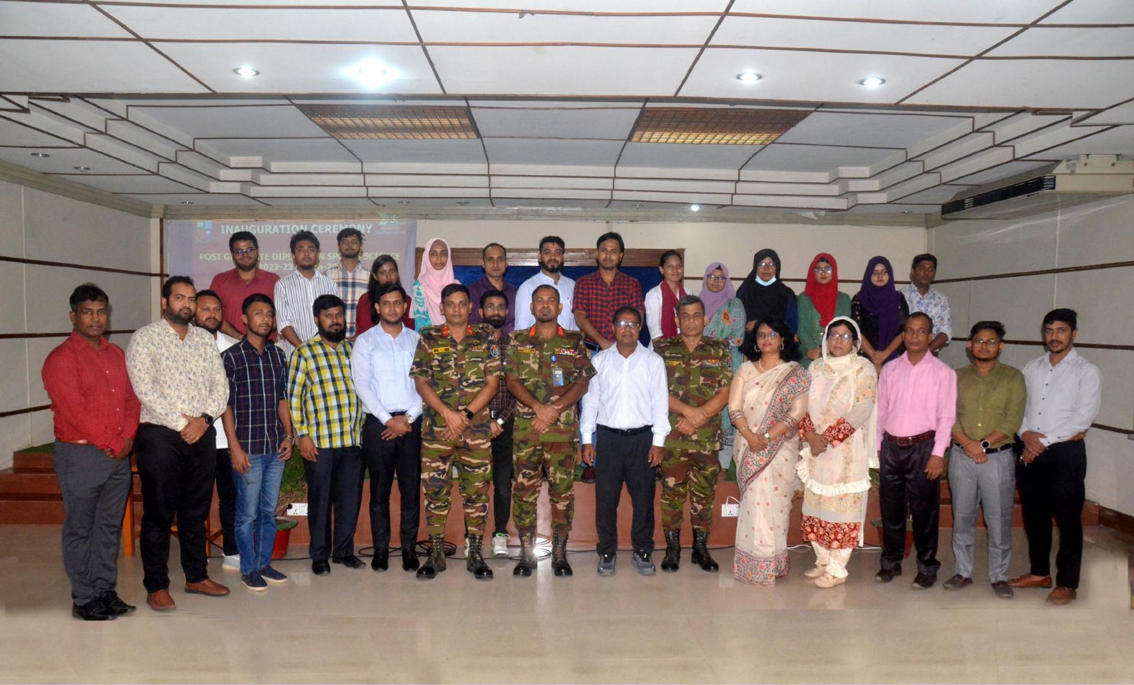
"পোস্ট গ্র্যাজুয়েট ডিপ্লোমা ইন স্পোর্টস সায়েন্স" (২০২২-২০২৩) শিক্ষাবর্ষের ২০তম ব্যাচের উদ্বোধনী অনুষ্ঠান শেষে বিকেএসপি'র মহাপরিচালক মহোদয়ের সাথে শিক্ষার্থীবৃন্দ।