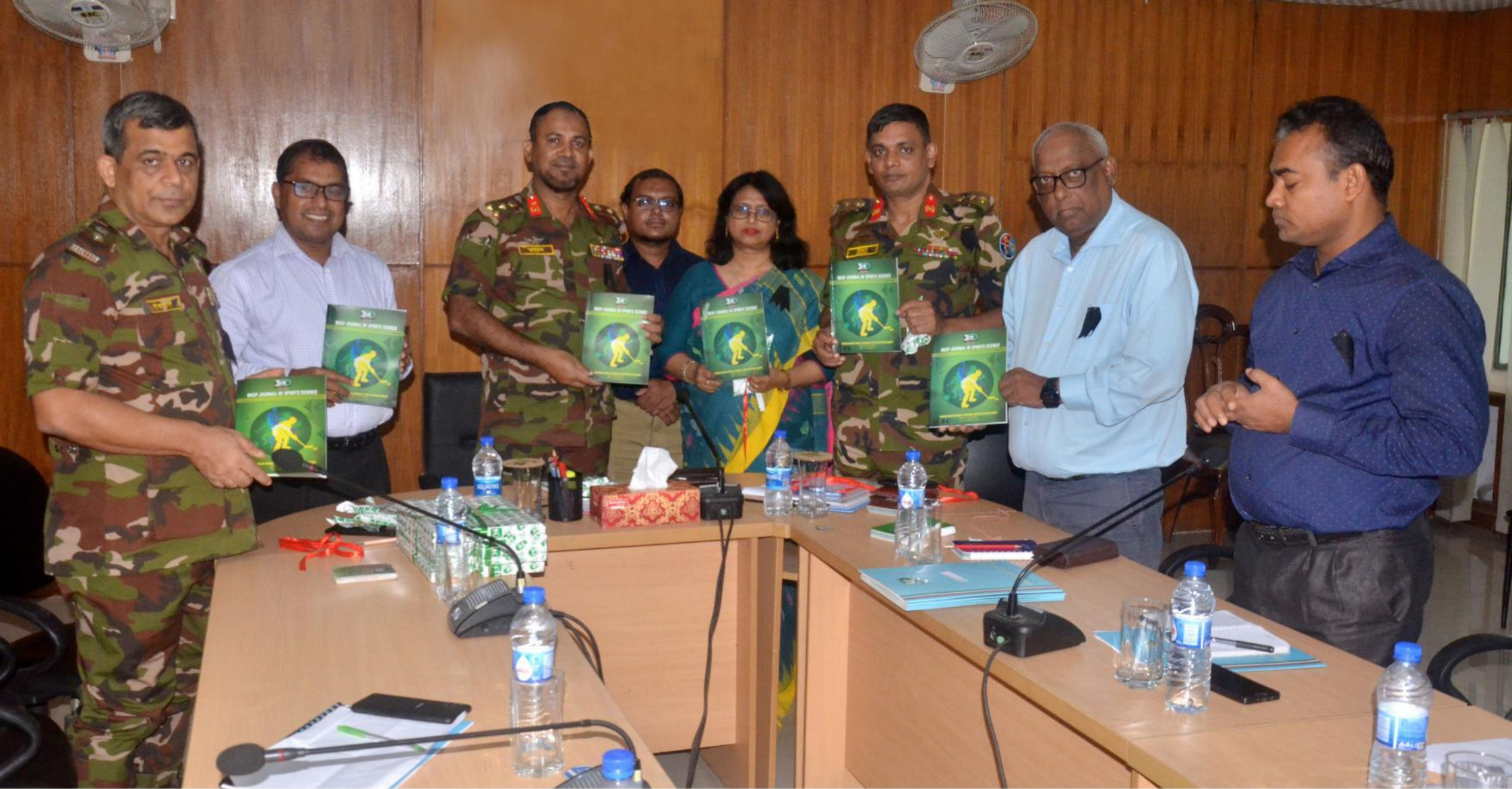
”বিকেএসপি জার্নাল অব স্পোর্টস সাইন্স”এর মোড়ক উন্মোচন অনুষ্ঠান-২০২৩। তারিখ:০৮/০৮/২০২৩ খ্রি