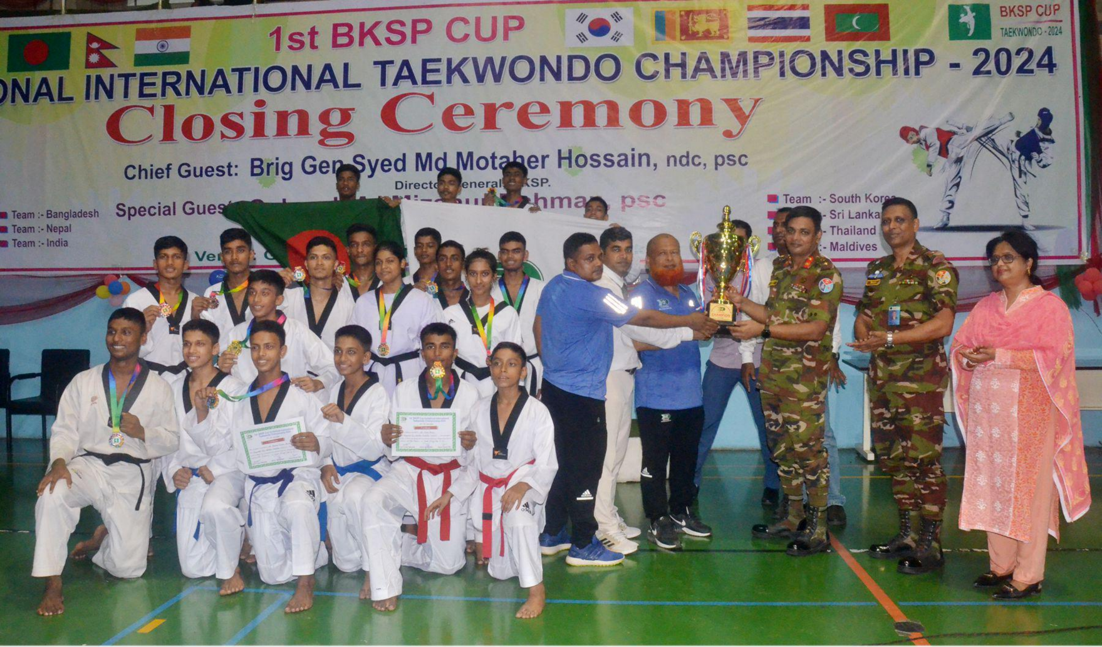
১ম বিকেএসপি কাপ আমন্ত্রণমূলক আন্তর্জাতিক তায়কোয়ন্ডো প্রতিযোগিতা ২০২৪ এর চ্যাম্পিয়ন দলকে ট্রফি তুলে দিচ্ছেন পরিচালক(প্রশিক্ষণ)। তারিখ: ১৩/০৬/২০২৪খ্রি.।