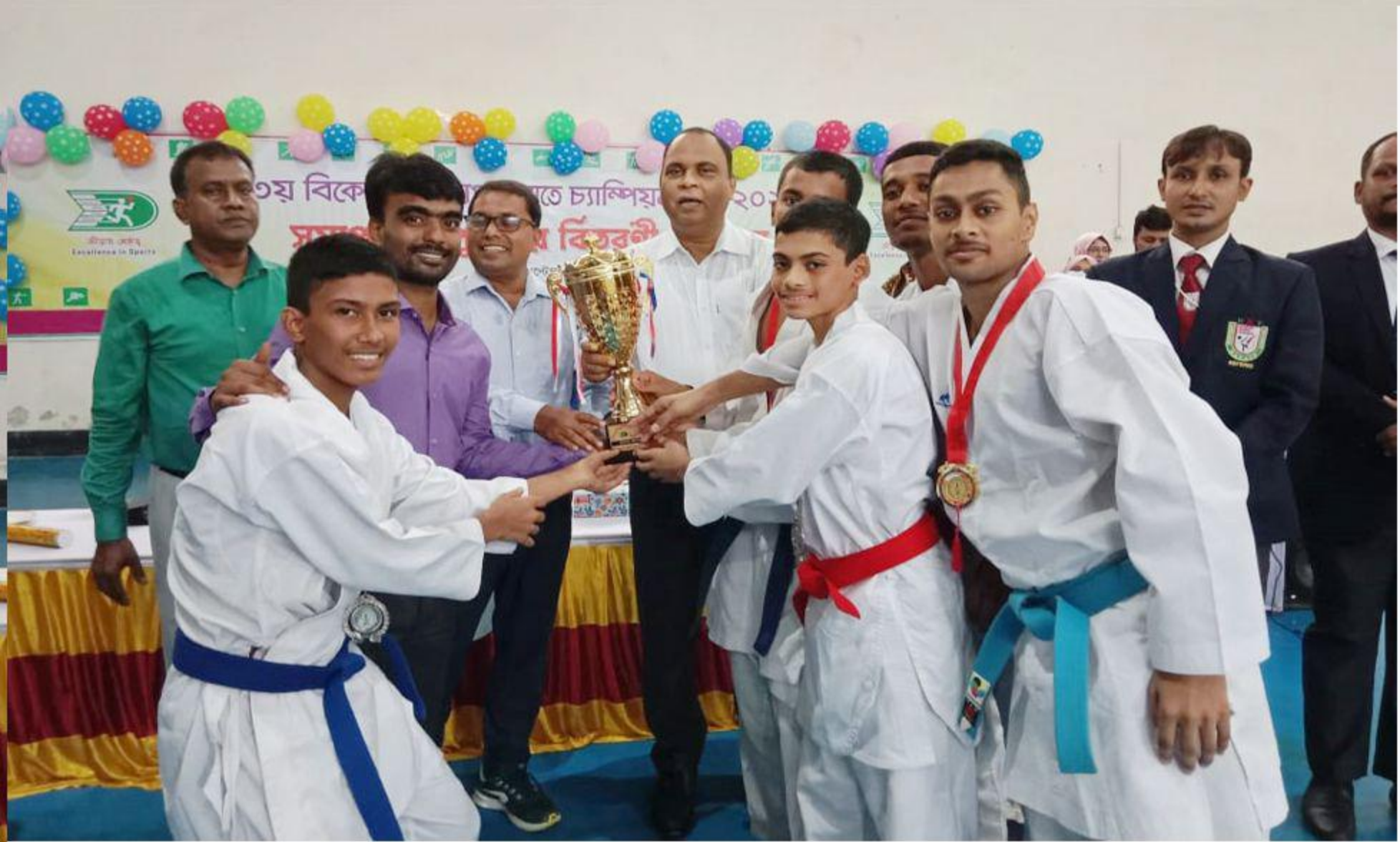
৩য় বিকেএসপি কাপ প্রতিযোগিতা ২০২৩ চ্যাম্পিয়ন ট্রফি হাতে বিকেএসপি কারাতে দল