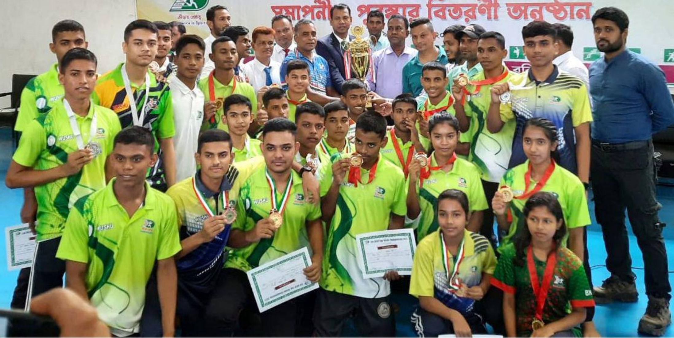
৩য় বিকেএসপি কাপ উশু ২০২৩ চ্যাম্পিয়ন বিকেএসপি উশু দল