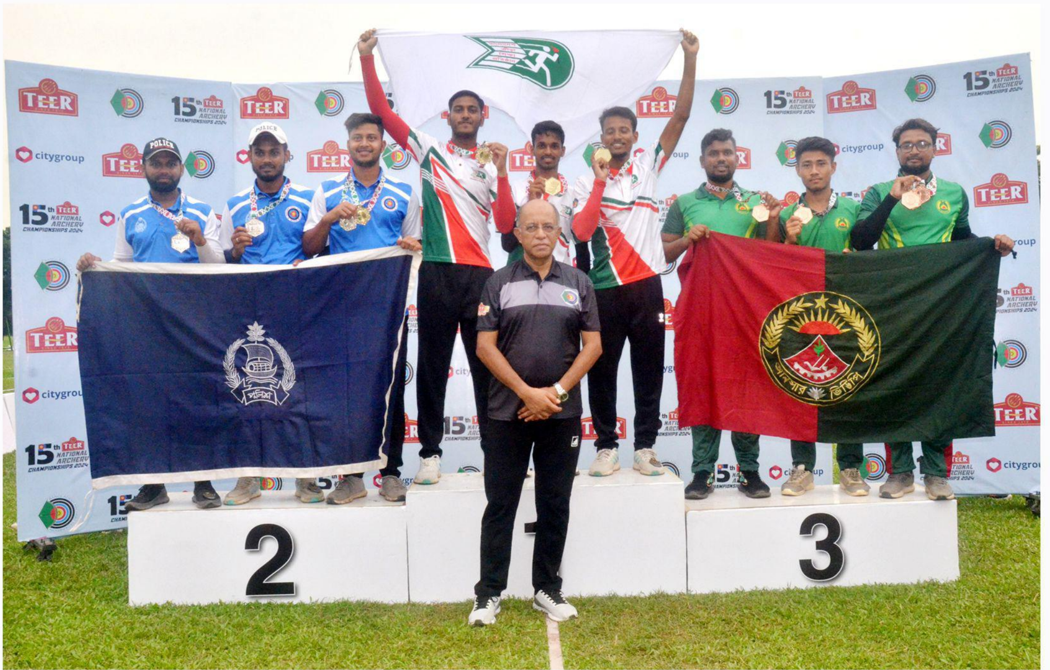
১৫তম জাতীয় অ্যাচারি প্রতিযোগিতা ২০২৪ এর বিকেএসপি'র পদকজয়ীদের সাথে বাংলাদেশ অ্যাচারি ফেডারেশনের সভাপতি। তারিখ: ১৩/০৬/২০২৪খ্রি.।