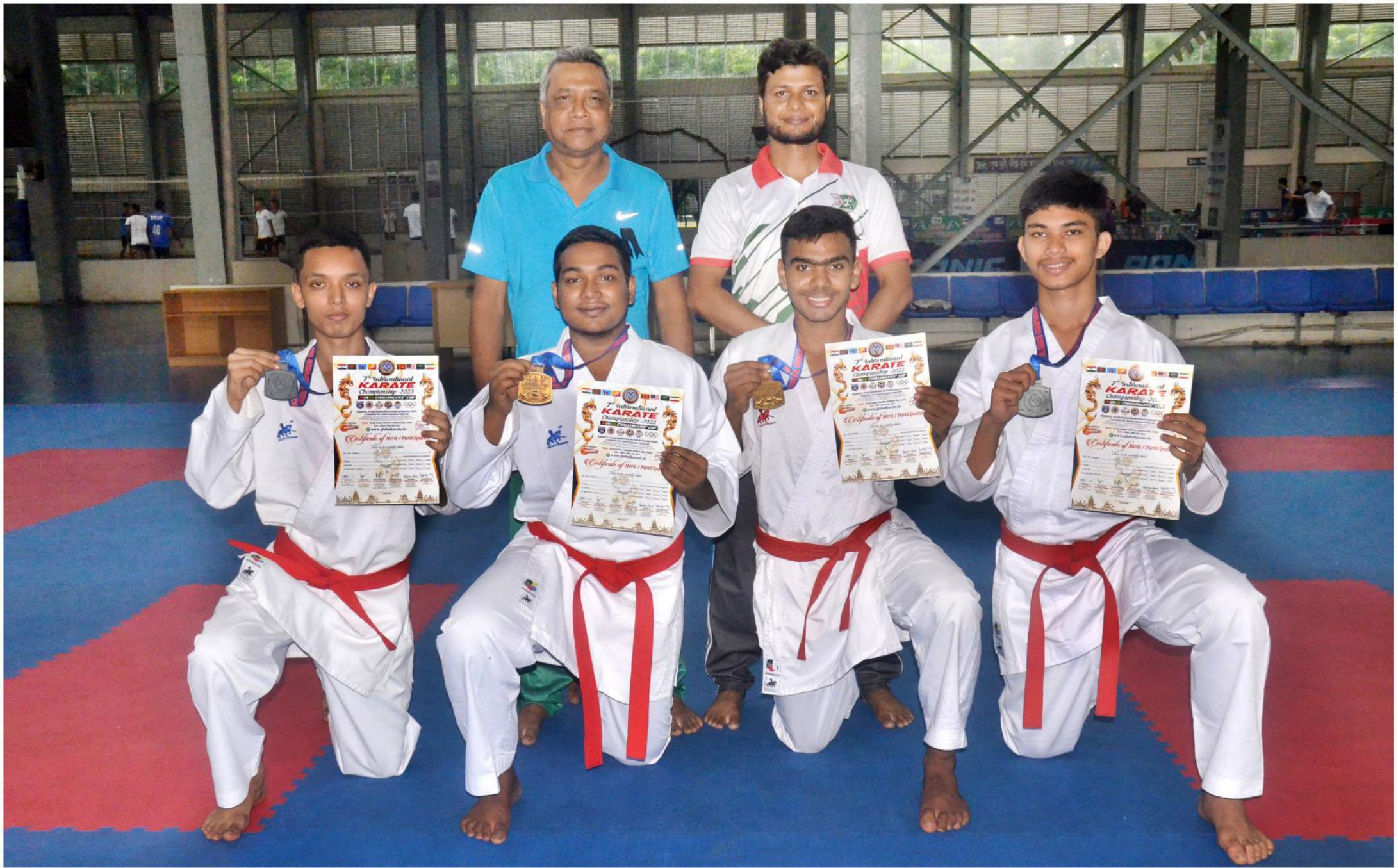
৭ম আমন্ত্রণমূলক আন্তর্জাতিক কারাতে চ্যাম্পিয়নশীপস, ভারত-২০২৩ এর স্বর্ণ ও রৌপ্য পদকজয়ী প্রশিক্ষণার্থীদের সাথে প্রশিক্ষকবন্দ।