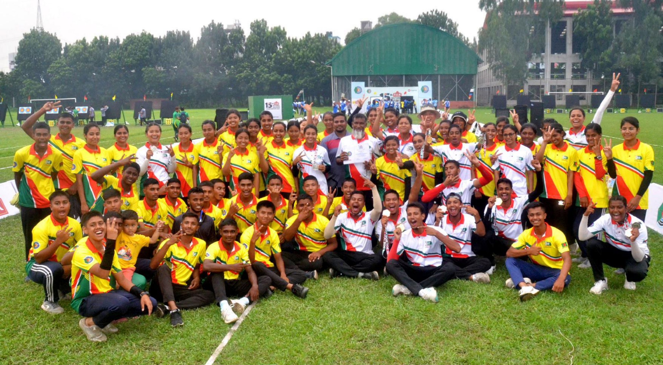
১৫তম জাতীয় অ্যাচারি প্রতিযোগিতা ২০২৪ এর বিকেএসপি'র পদকজয়ী অ্যাচারি খেলোয়াড়দের সাথে প্রশিক্ষকবৃন্দ । তারিখ:১৩/০৬/২০২৪খ্রি.।