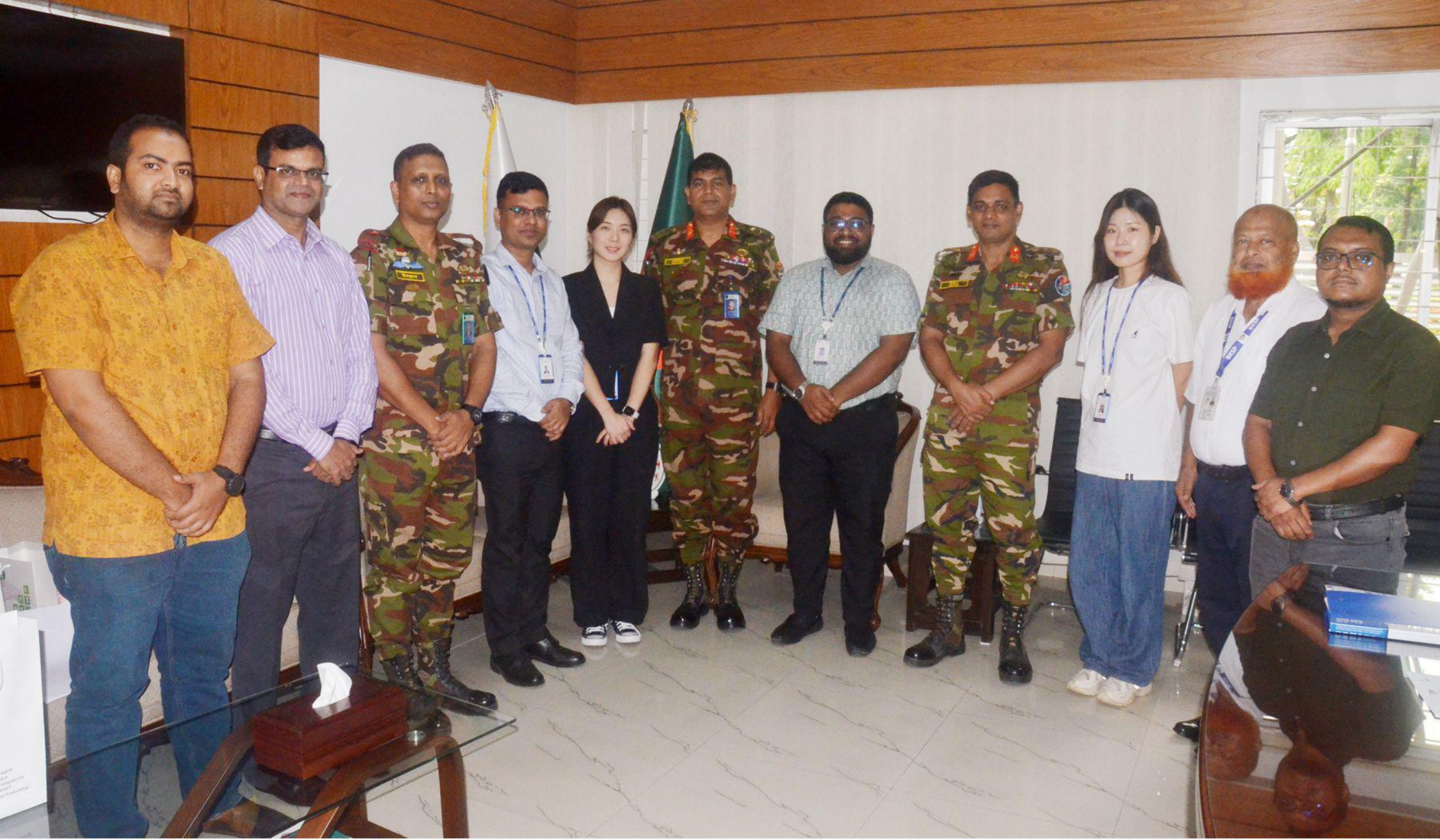
কোরিয়ান প্রতিনিধি দল (কোয়কা) এর বিকেএসপি'র বিভিন্ন ক্রীড়া স্থাপনা পরিদর্শন । তারিখ:০৬/০৪/২০২৪খ্রি. ।