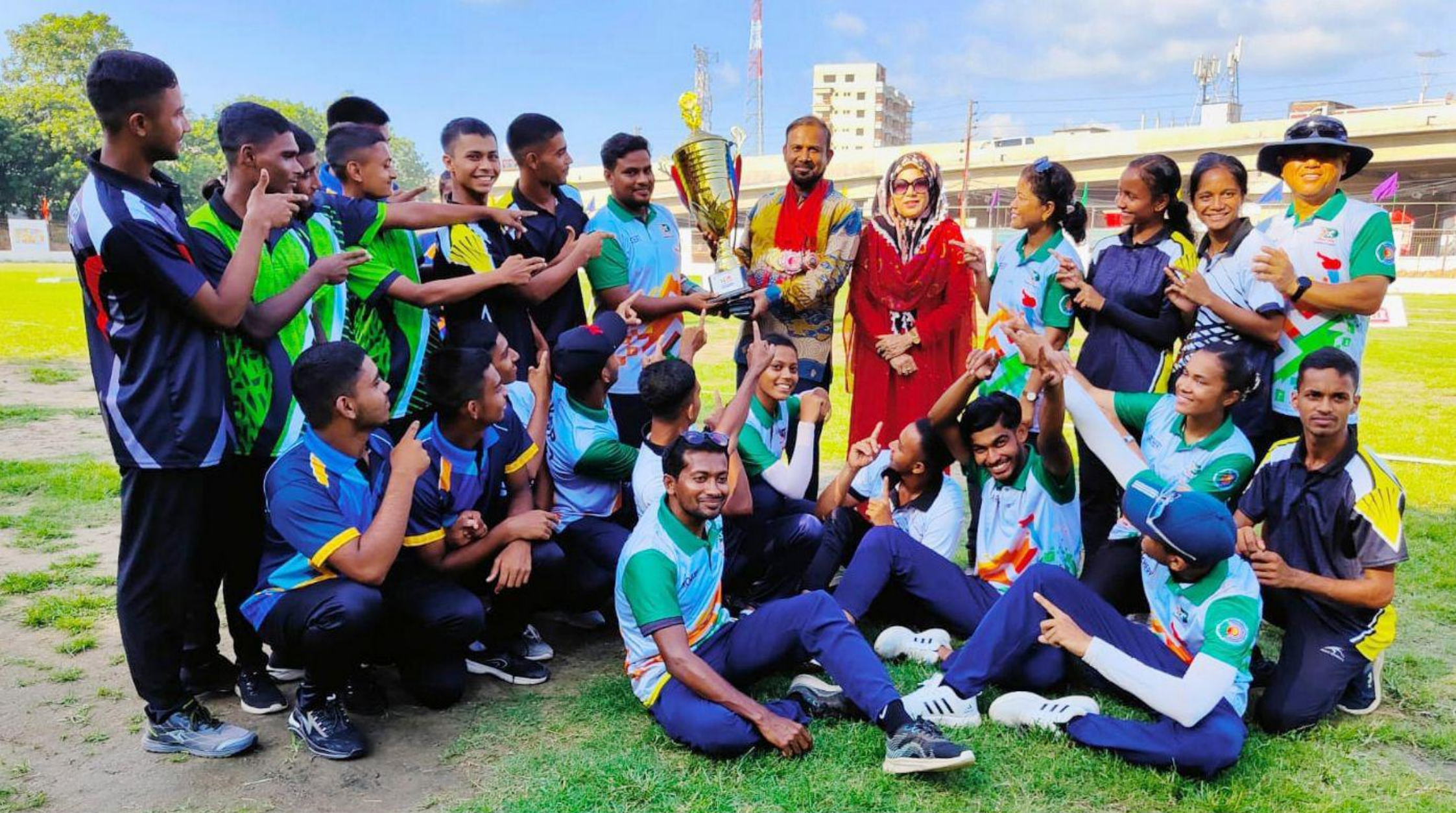
তীর ১৪৩ম জাতীয় অ্যাচারি চ্যাম্পিয়নশীপস্-২০২৩ এর রানার্স-আপ বিকেএসপি দলের সাথে মহাপরিচালক।