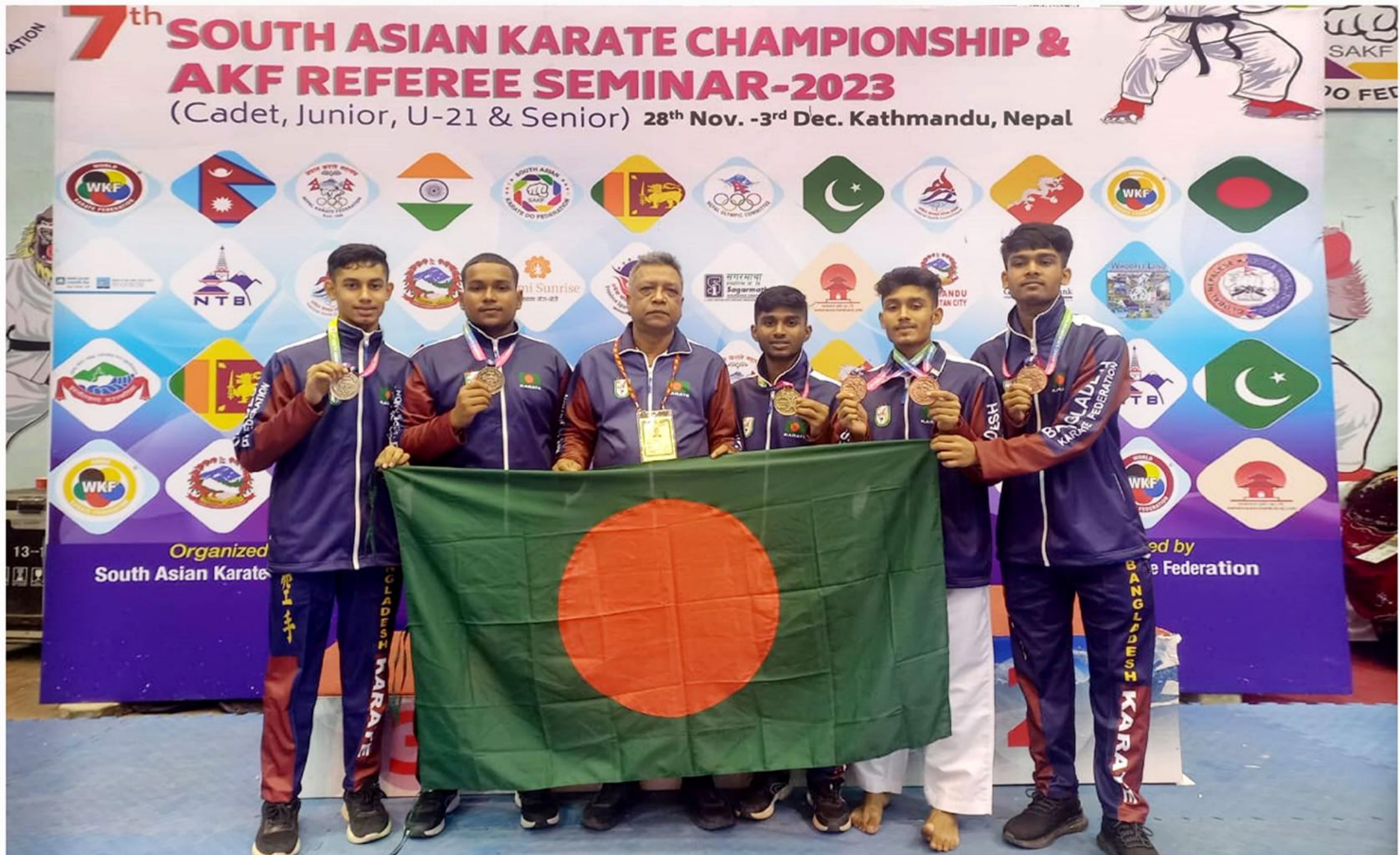
৭ম সাউথ এশিয়ান কারাতে চ্যাম্পিয়নশিপ-২০২৩, কাঠমুন্ড, নেপাল এর পদক জয়ী বিকেএসপি'র কারাতে প্রশিক্ষণার্থীবৃন্দ। তারিখঃ ০৩/১২/২০২৩খ্রিঃ।