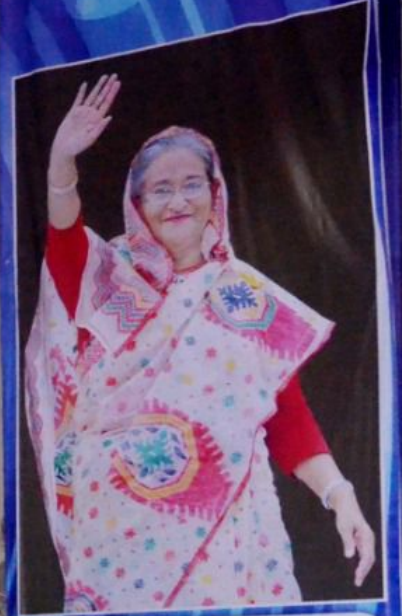
মাননীয় প্রধানমন্ত্রী শেখ হাসিনা