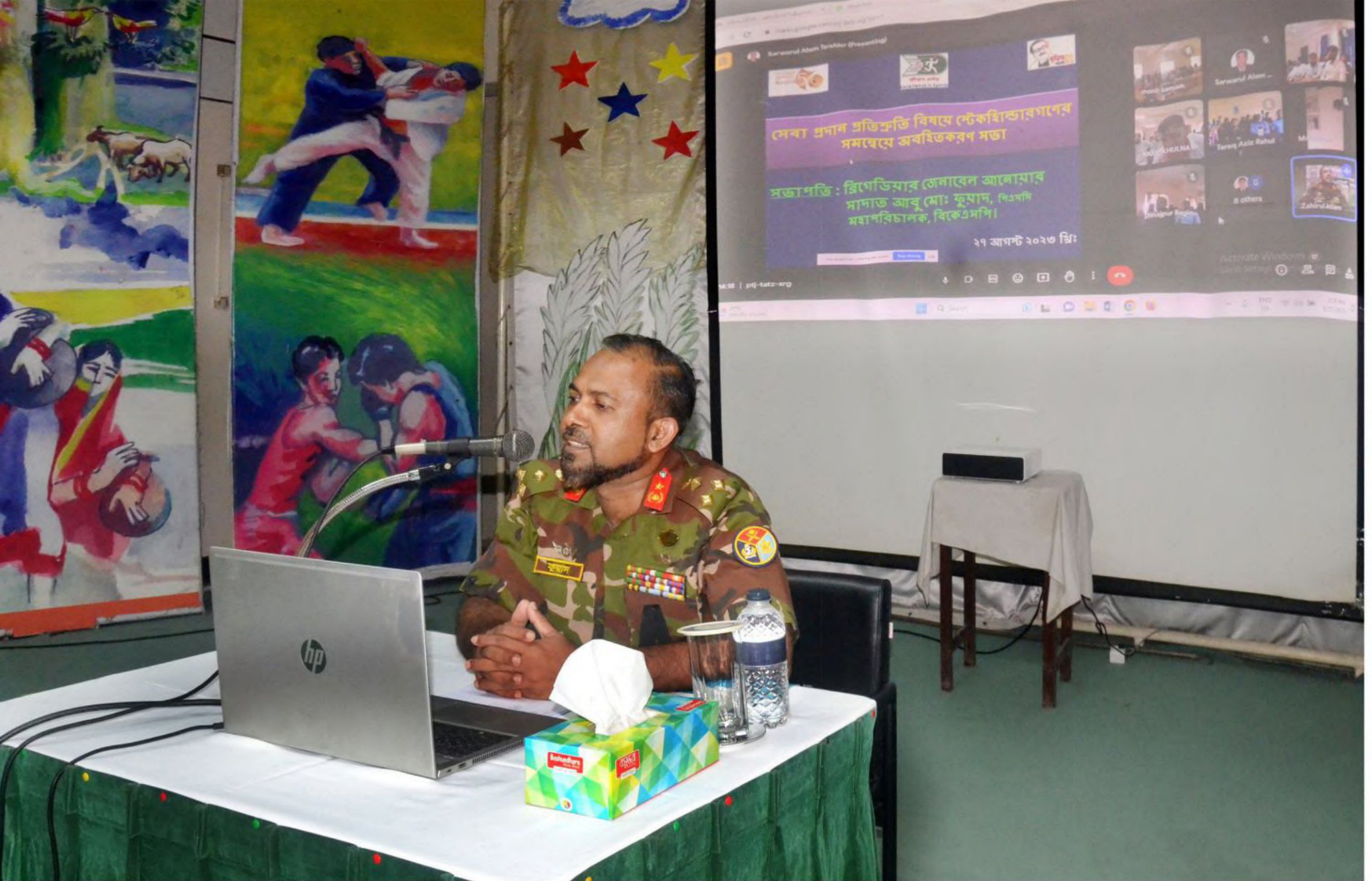
সেবা প্রদান প্রতিশ্রুতি বিষয়ে অংশীজনের সমন্বয়ে অবহিতকরণ সভা ২০২৩ এর বিকেএসপি'র সর্বস্তরের কর্মকর্তা-কর্মচারীদের সাথে মহাপরিচালক মহোদয়ের মতবিনিময়। তারিখঃ ২৭/০৮/২০২৩খ্রিঃ।