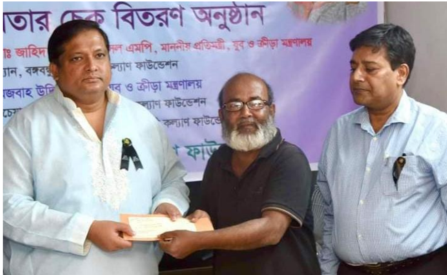
চিত্র-৩: ক্রীড়াসেবীদের চিকিৎসা ও আর্থিক সহায়তার চেক প্রদান করছেন যুব ও ক্রীড়া মন্ত্রণালয়ের মাননীয় প্রতিমন্ত্রী ও চেয়ারম্যান, বিকেকেএফ, জনাব মোঃ জাহিদ আহসান রাসেল এম,পি।

বঙ্গবন্ধু ক্রীড়াসেবী কল্যাণ ফাউন্ডেশন কর্তৃক ২০১৮-২০১৯ অর্থবছর থেকে অসচ্ছল, আহত ও অসমর্থ ক্রীড়াসেবীদের মাঝে চিকিৎসা সহায়তা প্রদান করা হচ্ছে। ২০২১-২০২২ অর্থবছর পর্যন্ত সর্বমোট ৭১ জন ক্রীড়াসেবীদের-কে চিকিৎসা/আর্থিক সহায়তা হিসেবে ৭৭,১৫,০০০/- (সাতাত্তর লক্ষ পনের হাজার) টাকা প্রদান করা হয়েছে।