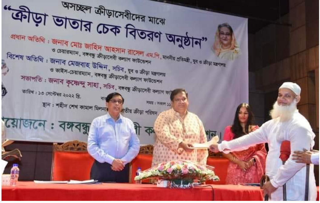
চিত্র-২: বঙ্গবন্ধু ক্রীড়াসেবী কল্যাণ ফাউন্ডেশন কর্তৃক ক্রীড়াসেবীর ক্রীড়া ভাতা প্রদান।