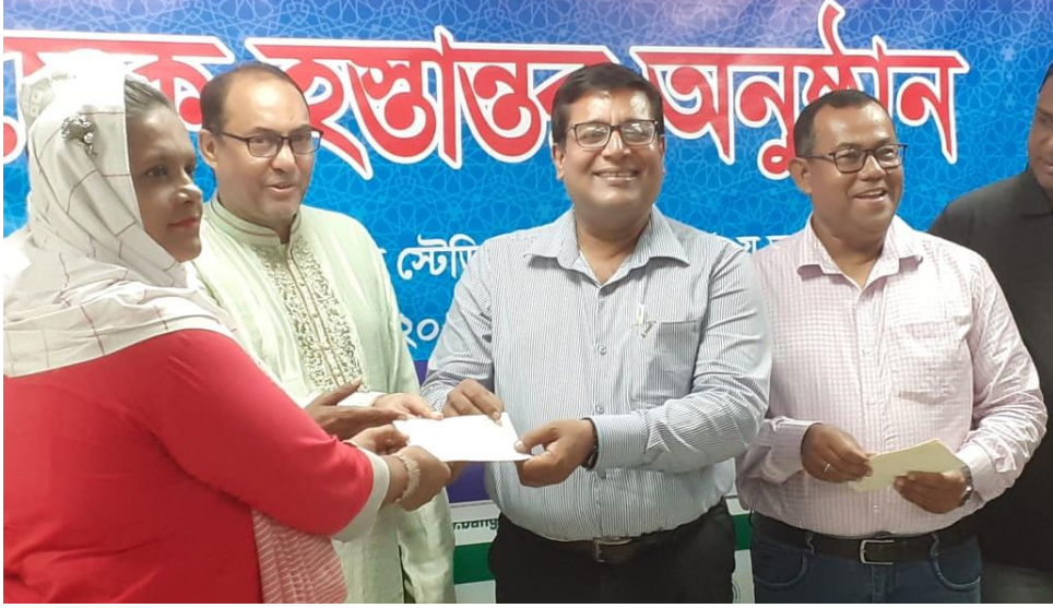
চিত্র-৪: করোনাকালীন বিশেষ অনুদানের চেক বিতরণ।

২০২১-২০২২ অর্থবছরে বঙ্গবন্ধু ক্রীড়াসেবী কল্যাণ ফাউন্ডেশন কর্তৃক ৭৭৬৭ (সাত হাজার সাতশত সাতষাট) জন অসচ্ছল ক্রীড়াসেবীদের প্রতিজনকে ৫,০০০/- টাকা হারে সর্বমোট ৩,৮৮,৩৫,০০০/- (তিন কোটি আটাত্তালিশ লক্ষ পঁয়ত্রিশ হাজার) টাকা করোনাকালীন বিশেষ অনুদান প্রদান করা হয়েছে।