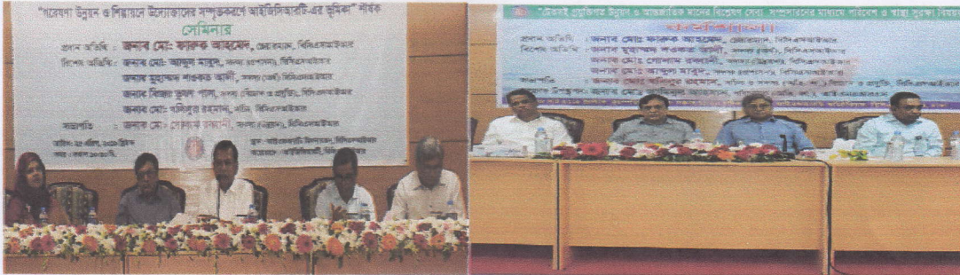
ছবি: স্টেকহোল্ডারদের সাথে মতবিনিময় সভা

বিসিএসআইআর -এর সেবাগ্রহীতা বা স্টেকহোল্ডারদের সাথে নিয়মিতভাবে মতবিনিময় সভা আয়োজন করা হয়ে থাকে। প্রত্যেকটি গবেষণাগার তাদের সংশ্লিষ্ট স্টেকহোল্ডারদের সাথে বিদ্যমান সেবার মনোময় বিষয়ে আলোচনা করেন। এর ফলে স্টেকহোল্ডারদের সাথে আন্তরিকতা বৃদ্ধি পায় এবং সেবার মনোময় সহজ হয়।