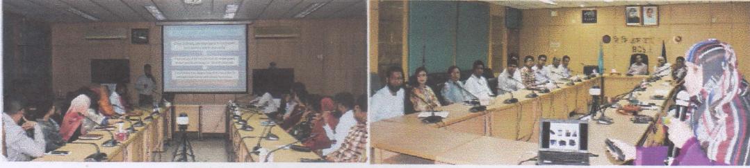
ছবি: চলমান গবেষণা প্রকল্পের উপর উপস্থাপনা প্রদান

বিসিএসআইআর - এর চলমান গবেষণা ও উন্নয়ন (R&D) প্রকল্পসমূহের বাস্তবায়ন অগ্রগতি পর্যালোচনার জন্য নিয়মিতভাবে প্রকল্প প্রধানগণ কর্তৃক পাওয়ার পয়েন্টের মাধ্যমে উপস্থাপনা প্রদানের ব্যবস্থা গ্রহণ করা হয়েছে। এর ফলে বিজ্ঞানীগণ একজন আরেকজনের গবেষণা সম্পর্কে জানতে পারছেন, নতুন নতুন আইডিয়া সৃষ্টিসহ সংশ্লিষ্ট বিজ্ঞানীদের কাজের গতিশীলতা ও জবাবদিহিতা বৃদ্ধি পাচ্ছে।