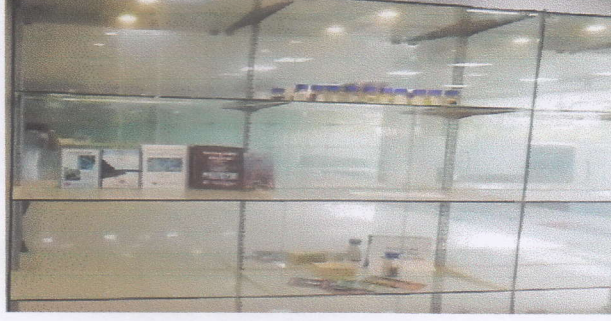
ছবি: ইনোভেশন গ্যালারী, (বিসিএসআইআর গবেষণাগার চট্টগ্রাম)

বিসিএসআইআর-তে কেন্দ্রীয়ভাবে একটি দৃষ্টিনন্দন ইনোভেশন গ্যালারী স্থাপন করা হয়েছে। সেই সাথে আঞ্চলিক অফিস বিসিএসআইআর গবেষণাগার চট্টগ্রাম ও রাজশাহীতেও ইনোভেশন গ্যালারী স্থাপন করা হয়েছে। যার ফলে বিসিএসআইআর-এর স্টেকহোল্ডার গন, লীজিরা এবং দর্শনার্থীরা এক জায়গা থেকেই বিসিএসআইআর উল্লখযোগ্য অর্জনসহ সেবার তালিকা, উদ্ভাবিত পন্য ও প্রসেস সম্পর্কে বিস্তারিত জানতে পারে। সেইসাথে বিসিএসআইআর-এর কার্যাবলী সম্পর্কে জনগন অবহিত হচ্ছে এবং প্রদত্ত সেবা সম্পর্কে জানতে পারছে।