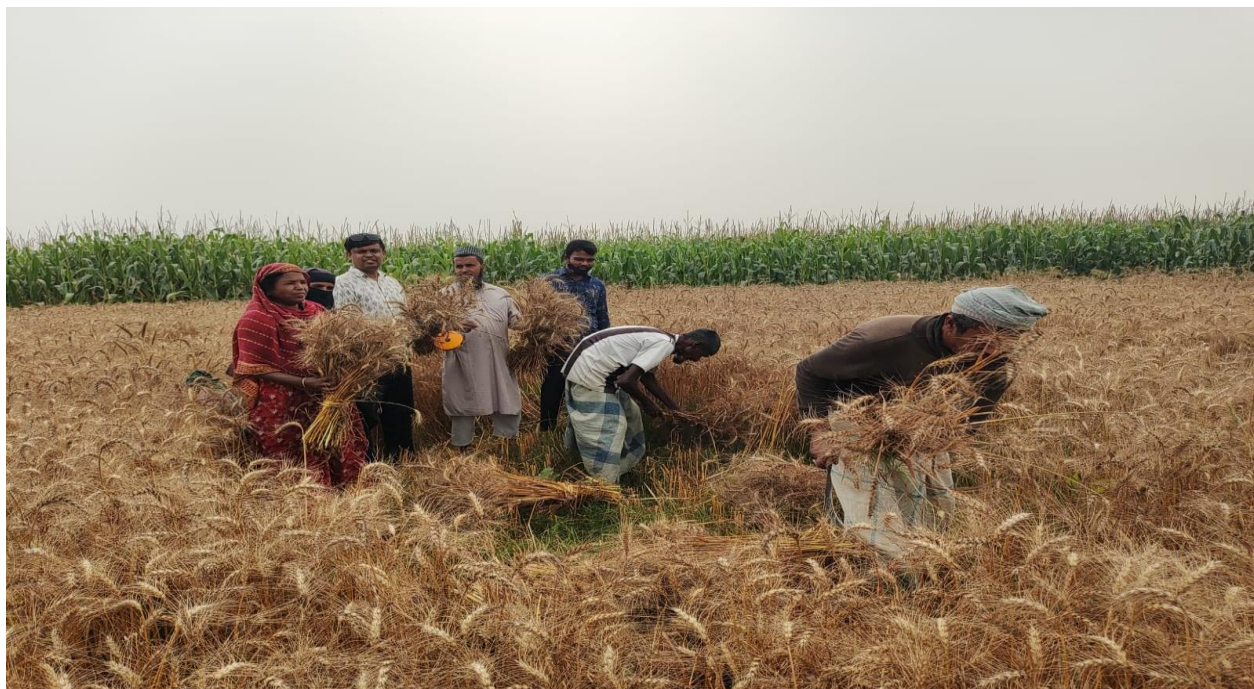
SVRS প্রকল্পের কাজ পরিদর্শন