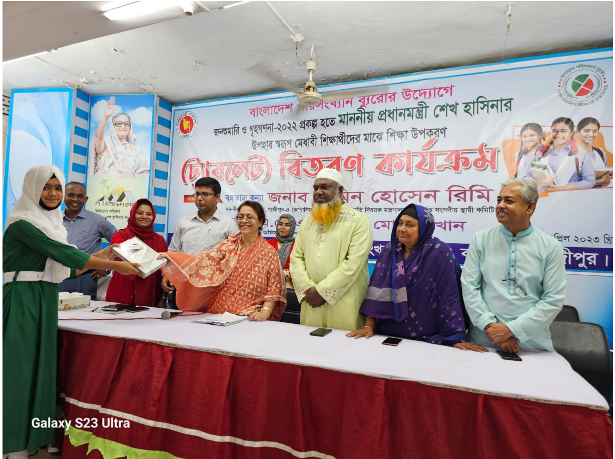
Galaxy S23 Ultra