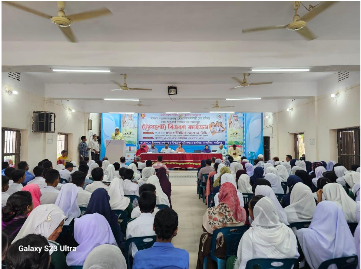
Galaxy S23 Ultra