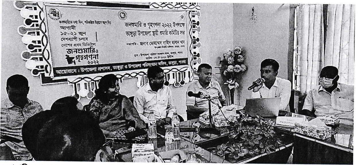
জনশুমারি ও গৃহগণনা ২০২২ এর ভাঞ্জুড়া উপজেলা শুমারি কমিটির সভা

জনশুমারি ও গৃহগণনা ২০২১ প্রকল্প এর অধীন ট্যাবলেট ব্যবহারপূর্বক Computer Assisted Personal Interviewing (CAPI) পদ্ধতিতে দেশের প্রথম ডিজিটাল শুমারি 'জনশুমারি ও গৃহগণনা ২০২২' গত ১৫-২১ জুন, ২০২২ খ্রি. সারাদেশের ন্যায় পাবনা জেলার ভাঞ্জুড়া উপজেলায় সফলভাঞ্জুড়াইবে সম্পন্ন হয়েছে। জনশুমারি ও গৃহগণনা ২০২২ এর প্রিলিমিনারি রিপোর্ট গত ২৭ জুলাই, ২০২২ খ্রি. প্রকাশিত হয়েছে।