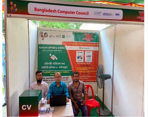
বালকাঠি স্মার্ট কর্মসংস্থান মেলায় বিসিসি বরিশাল আঞ্চলিক কার্যালয়ের অংশগ্রহণ