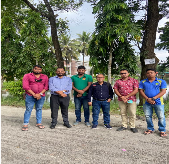
চিত্র: Fiber @ home দলের সাথে মাঠপর্যায়ের নেটওয়ার্কের সাপোর্ট প্রদানের সময় একাংশ

২০২৩-২৪ অর্থ বছরে এপিএর লক্ষ্যমাত্রা অর্জনে অত্র কার্যালয় হতে নেটওয়ার্ক সম্পর্কিত ১৮০টি নেটওয়ার্ক ও ভিডিও সাপোর্ট প্রদান করা হয়েছে।