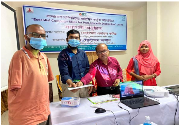
Essential Computer Skills for Persons with Disabilities-০২ প্রোগ্রামে সমাপনী অনুষ্ঠান