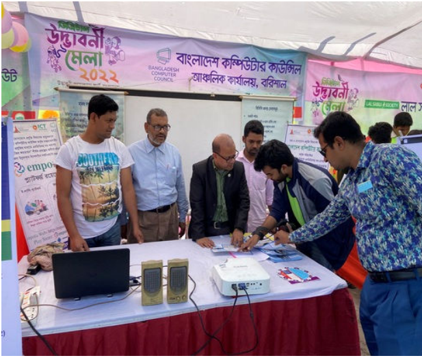
বিসিসি বরিশাল আঞ্চলিক কার্যালয় ডিজিটাল উত্তাবনী মেলায় অংশগ্রহণ, দর্শনার্থীগণের স্বতস্পূর্ত ভাবে উক্ত স্টল হতে তথ্য গ্রহণ করছে।