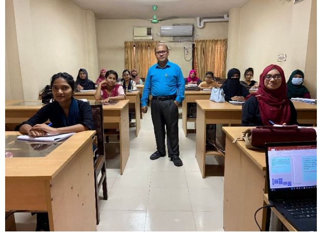
বরিশাল আঞ্চলিক কার্যালয়ে “Introduction to Computer and application Packages with Unicode Bangla Under WID ” প্রোগ্রামের মেয়েদের