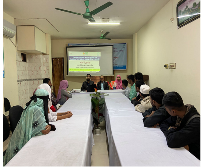
Essential Computer Skills for Persons with Disabilities-০২ প্রোগ্রামে উদ্বোধনী অনুষ্ঠান