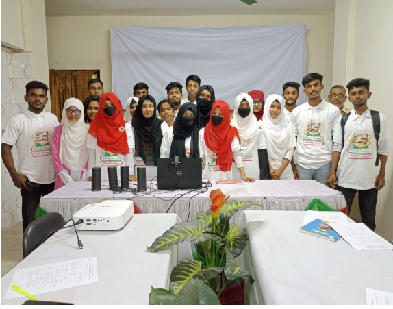
বরিশাল আঞ্চলিক কার্যালয়ে “Computer Programming for young learners” Progm -01 ব্যাচের সমাপনীর একাংশ