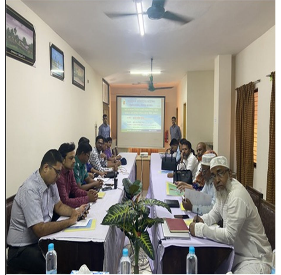
বিভিন্ন অফিসের কর্মকর্তাবৃন্দের উপস্থিতিতে কর্মশালার একাংশ