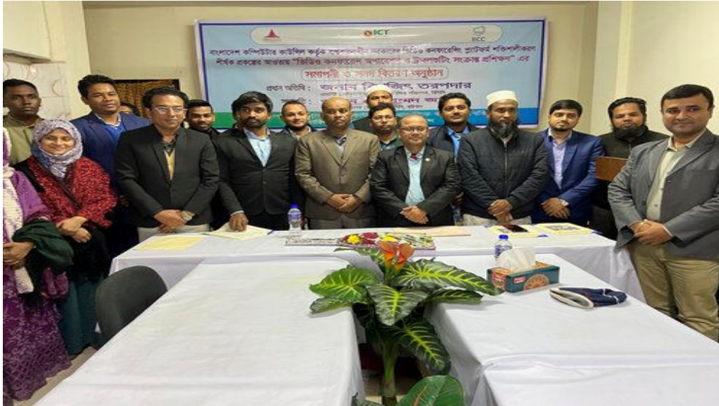
ভিডি বাংলাদেশ কম্পিউটার কাউন্সিলের বাস্তবায়নকৃত সরকারের "ভিডিও কনফারেন্সিং সিস্টেম প্ল্যাটফরম শক্তিশালীকরণ" প্রকল্পের আওতায় ৩দিন ব্যাপি বরিশাল বিভাগীয় জেলা/উপজেলা কার্যালয়ের প্রোগ্রামার/সহঃ প্রোগ্রামার ও সহঃ নেটওয়ার্ক ইঞ্জিঃ নিয়ে Video conference training