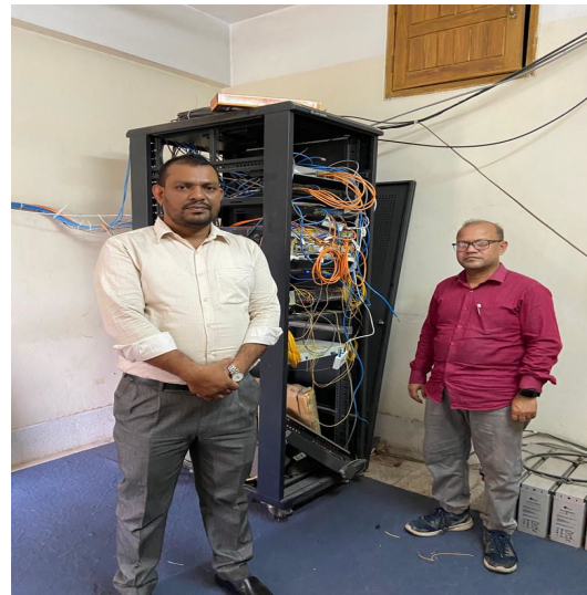
চিত্র: DHQ সার্ভার রুমের আঞ্চলিক পরিচালক মহোদয়ের পরিদর্শন