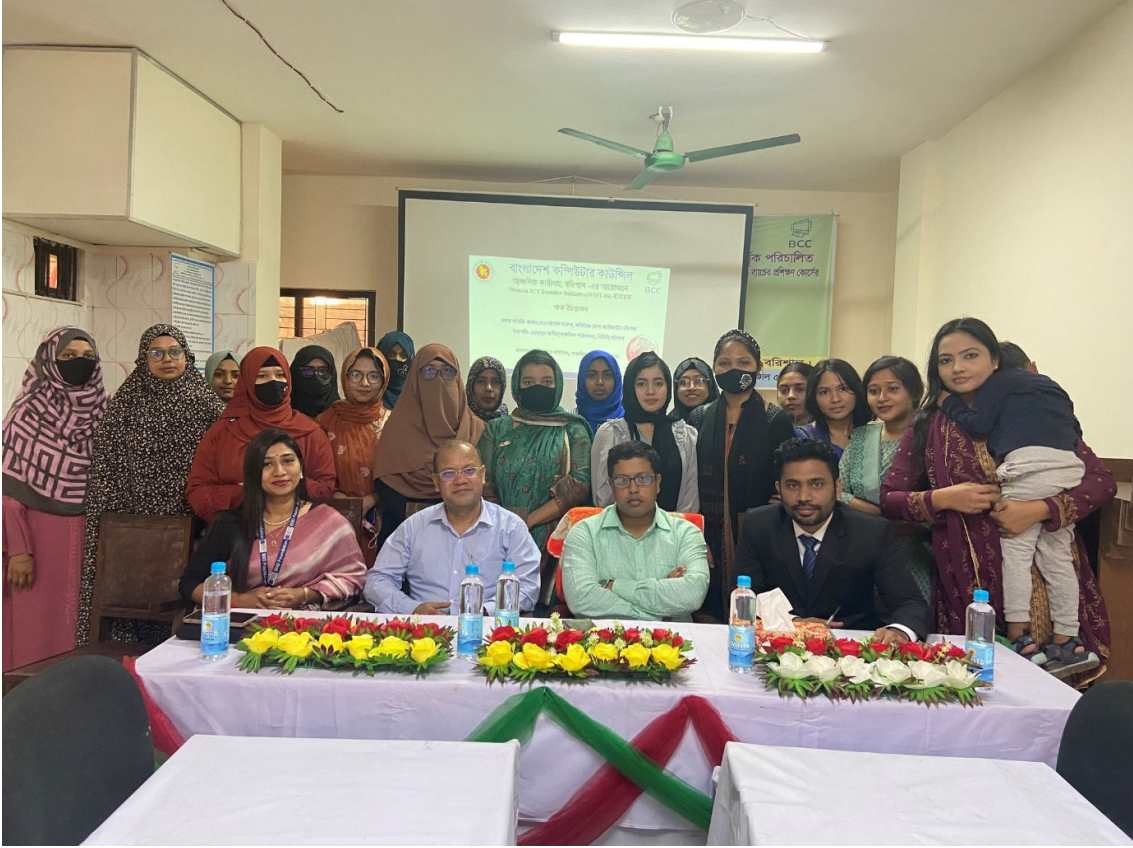
ছবি: উদ্বোধনী অনুষ্ঠানের একাংশ