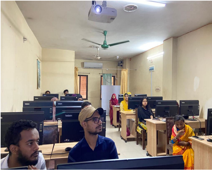
স্মার্ট বাংলাদেশ বিনির্মাণে ৪র্থ শিল্প বিপ্লব মোকাবিলায় ২দিন ব্যাপী প্রশিক্ষণ