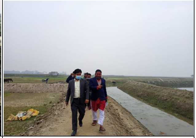
খাল পুন:খনন কাজ