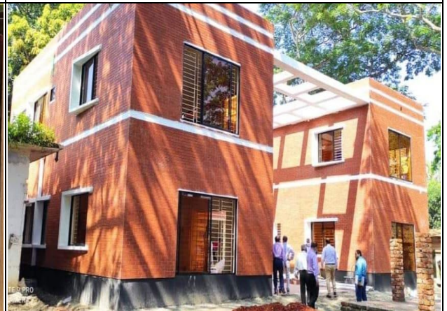
কসবা উপজেলায় বিএডিসি কসবা ইউনিট অফিস কাম ট্রেনিং সেন্টার নির্মাণ কাজ