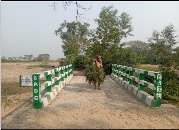
হাইড্রোলিক স্ট্রাকচার নির্মাণ