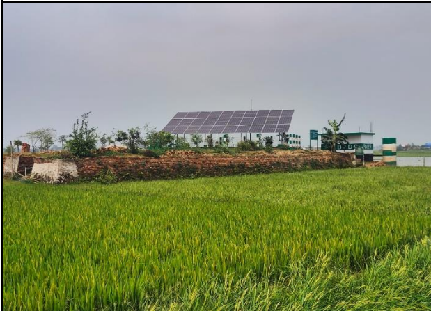
১- কিউসেক এলএলপি ফীমে সোলার প্যানেল ও পাম্প স্থাপনসহ বারিড পাইপ সেচনালা নির্মাণ কাজ।