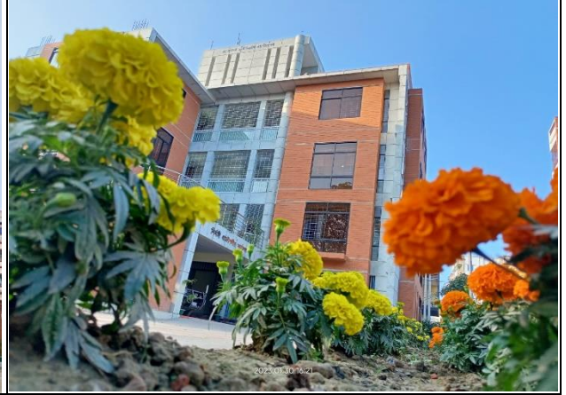
ব্রাহ্মণবাড়িয়া রিজিয়ন অফিস বিল্ডিং কাম ট্রেনিং সেন্টার নির্মাণ