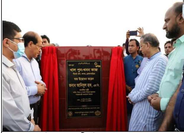
কসবা উপজেলায় সীনাই খাল পুন:খনন কাজ।

দপ্তরের নাম : নির্বাহী প্রকৌশলী (ক্ষুদ্রসেচ) এর কার্যালয়, বিএডিসি, ব্রাহ্মণবাড়িয়া রিজিয়ন, ব্রাহ্মণবাড়িয়া। মন্ত্রণালয় : কৃষি মন্ত্রণালয় বিভাগ : বাংলাদেশ কৃষি উন্নয়ন কর্পোরেশন (বিএডিসি)।