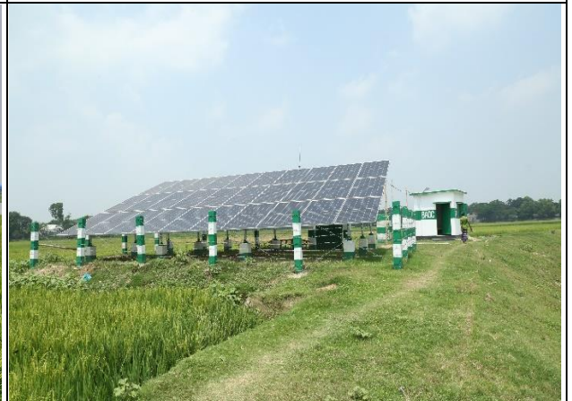
১- কিউসেক এলএলপি ফীমে সোলার প্যানেল ও পাম্প স্থাপনসহ বারিড পাইপ সেচনালা নির্মাণ কাজ।