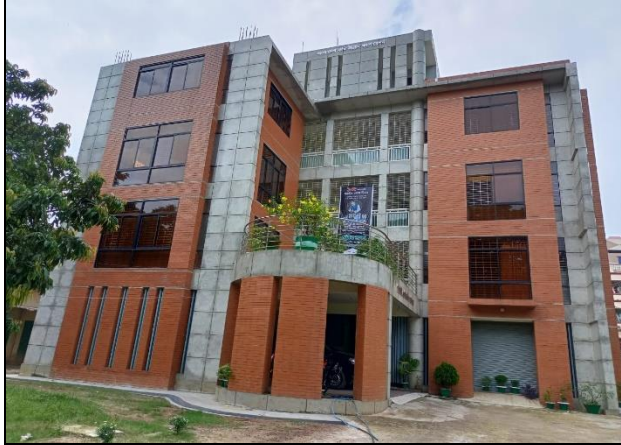
ব্রাহ্মণবাড়িয়া রিজিয়ন অফিস বিল্ডিং কাম ট্রেনিং সেন্টার নির্মাণ