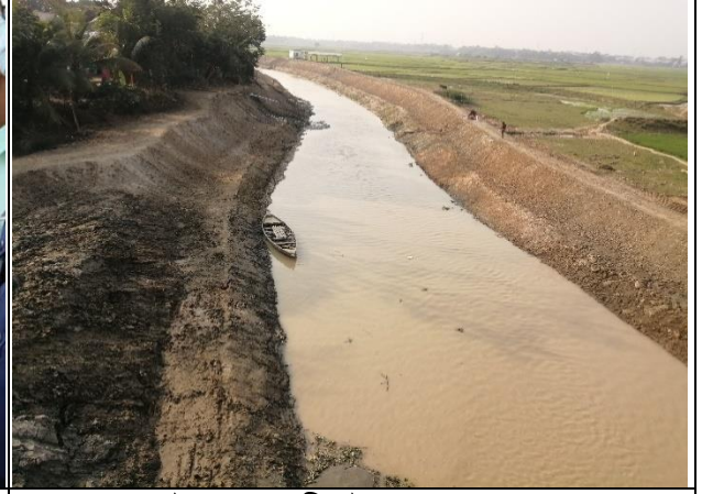
কসবা উপজেলায় সীনাই খাল পুন:খনন কাজ।