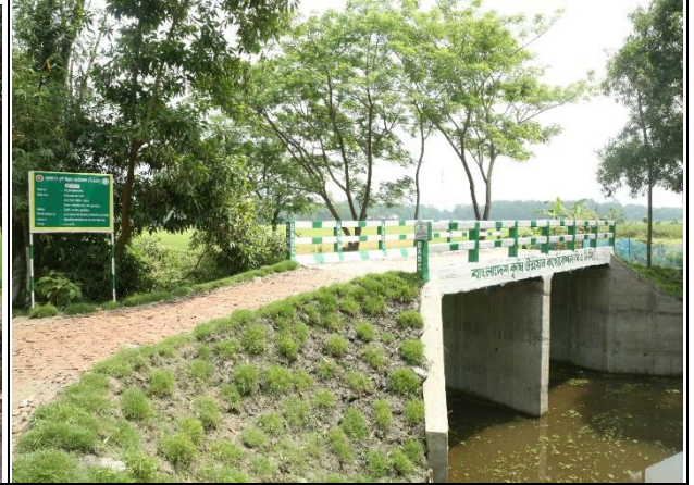
হাইড্রোলিক স্ট্রাকচার নির্মাণ