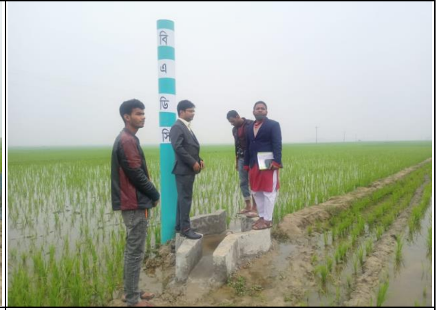
২- কিউসেক এলএলপি সেচ স্কীমে বরিড পাইপ (ভূ-গর্ভস্থ সেচনালা) নির্মাণ কাজ