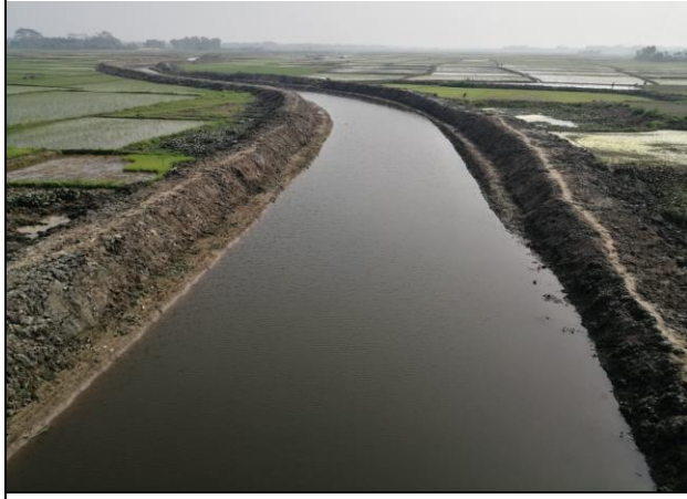
খাল পুন:খনন কাজ

দপ্তরের নাম : নির্বাহী প্রকৌশলী (ক্ষুদ্রসেচ) এর কার্যালয়, বিএডিসি, ব্রাহ্মণবাড়িয়া রিজিয়ন, ব্রাহ্মণবাড়িয়া। মন্ত্রণালয় : কৃষি মন্ত্রণালয় বিভাগ : বাংলাদেশ কৃষি উন্নয়ন কর্পোরেশন (বিএডিসি)।