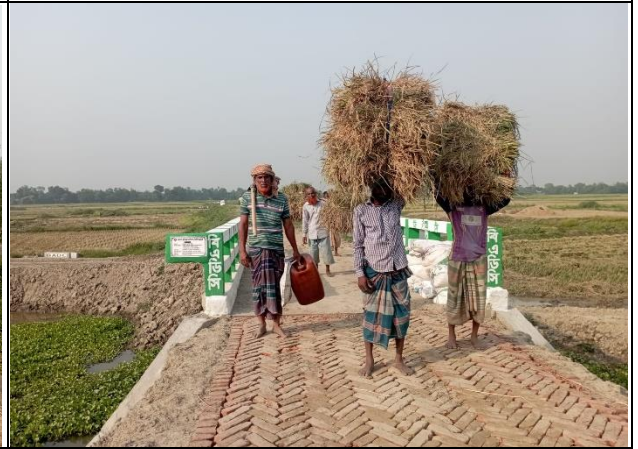
হাইড্রোলিক স্ট্রাকচার নির্মাণ