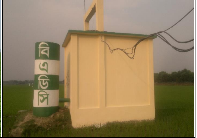
২- কিউসেক গনকু ফীমের পাম্প হাউজ নির্মাণসহ বারিড পাইপ (ভূ-গর্ভস্থ সেচনালা) নির্মাণ কাজ।