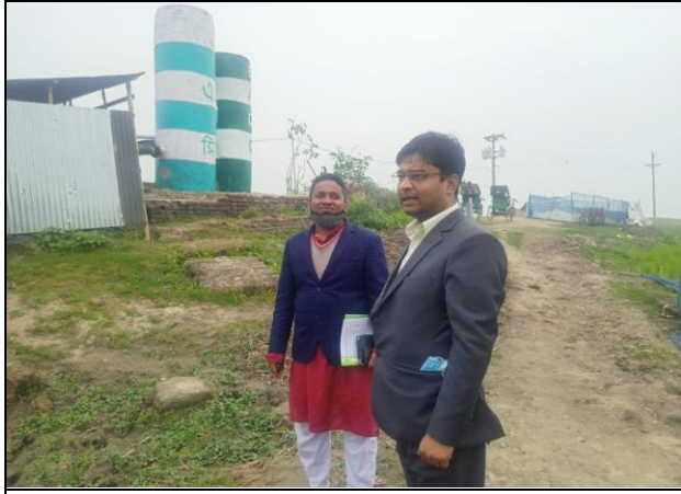
২- কিউসেক এলএলপি সেচ স্কীমে বরিড পাইপ (ভূ-গর্ভস্থ সেচনালা) নির্মাণ কাজ