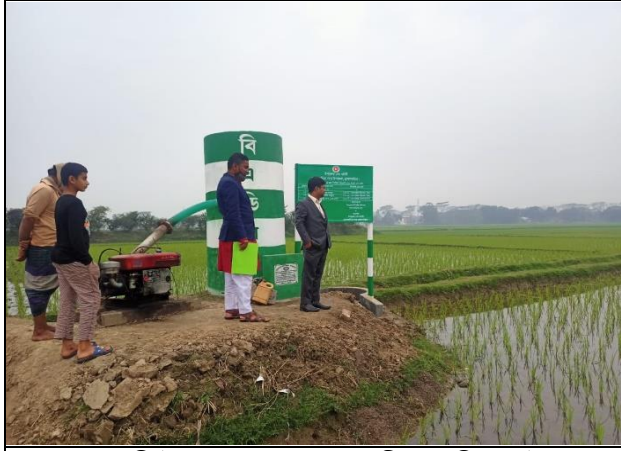
০.৫- কিউসেক STW সেচ স্কীমে বরিড পাইপ (ভূ-গর্ভস্থ সেচনালা) নির্মাণ কাজ