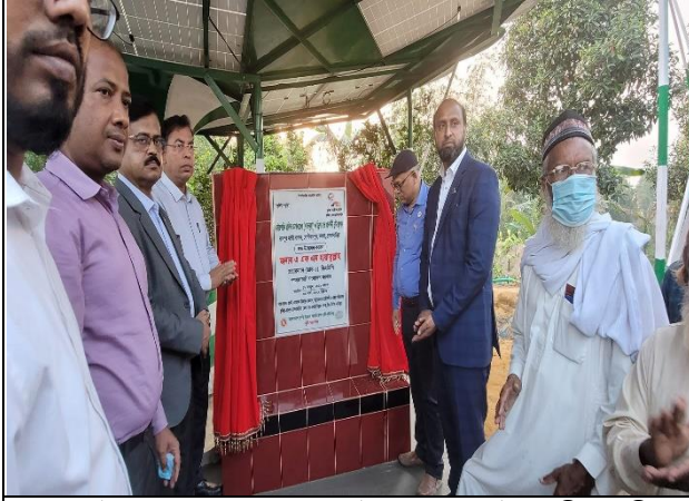
কসবা উপজেলায় রামপুর মাল্টা বাগানে সৌরশক্তি চালিত ডাগওয়েল নির্মাণ কাজ।

দপ্তরের নাম : নির্বাহী প্রকৌশলী (ক্ষুদ্রসেচ) এর কার্যালয়, বিএডিসি, ব্রাহ্মণবাড়িয়া রিজিয়ন, ব্রাহ্মণবাড়িয়া। মন্ত্রণালয় : কৃষি মন্ত্রণালয় বিভাগ : বাংলাদেশ কৃষি উন্নয়ন কর্পোরেশন (বিএডিসি)।