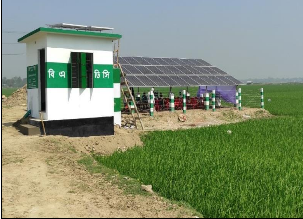
১- কিউসেক এলএলপি ফীমে সোলার প্যানেল ও পাম্প স্থাপনসহ বারিড পাইপ সেচনালা নির্মাণ কাজ।