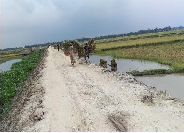
ফসল রক্ষা বাঁধ নির্মাণ

দপ্তরের নাম : নির্বাহী প্রকৌশলী (ক্ষুদ্রসেচ) এর কার্যালয়, বিএডিসি, ব্রাহ্মণবাড়িয়া রিজিয়ন, ব্রাহ্মণবাড়িয়া। মন্ত্রণালয় : কৃষি মন্ত্রণালয় বিভাগ : বাংলাদেশ কৃষি উন্নয়ন কর্পোরেশন (বিএডিসি)।