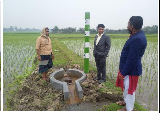
০.৫- কিউসেক STW সেচ স্কীমে বরিড পাইপ (ভূ-গর্ভস্থ সেচনালা) নির্মাণ কাজ