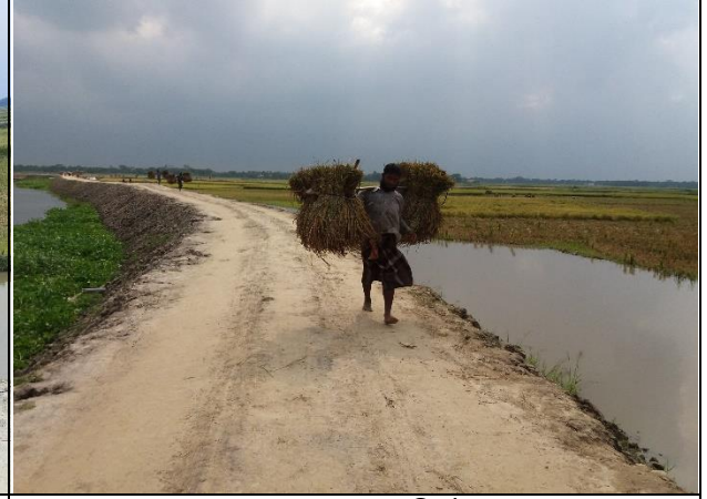
ফসল রক্ষা বাঁধ নির্মাণ