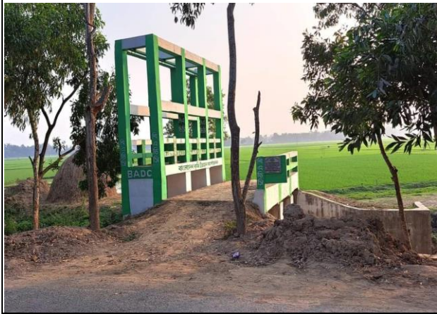
হাইড্রোলিক স্ট্রাকচার নির্মাণ