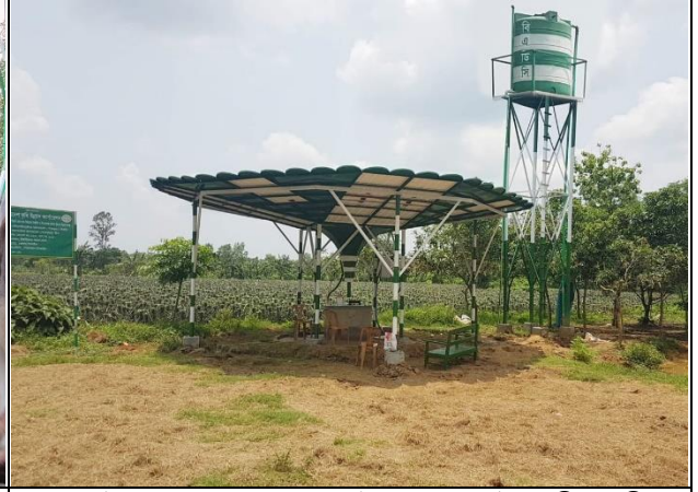
কসবা উপজেলায় রামপুর মাল্টা বাগানে সৌরশক্তি চালিত ডাগওয়েল নির্মাণ কাজ।