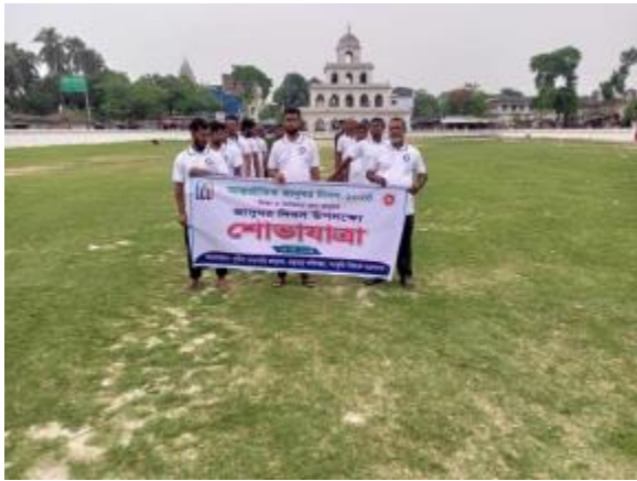
১৮ই মে আন্তর্জাতিক জাদুঘর দিবস উপলক্ষে পুঠিয়া রাজবাড়ি জাদুঘর কর্তৃক আয়োজিত শোভাযাত্রার আলোকচিত্র