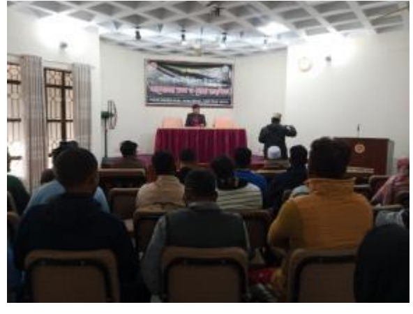
১৪ই ডিসেম্বর শহীদ বুদ্ধিজীবী দিবসে পাহাড়পুর প্রত্নতাত্ত্বিক জাদুঘরে আলোচনা সভা ও দোয়া মাহফিলের আয়োজন করা হয়