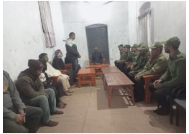
‘১৬ ডিসেম্বর’ মহান বিজয় দিবস উপলক্ষে পুঠিয়া রাজবাড়ি জাদুঘরে বিশেষ আলোচনা সভার দৃশ্য