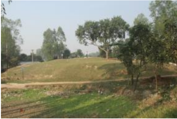
উৎখনন পূর্ববর্তী টিবির আলোকচিত্র (দক্ষিণ-পূর্ব দিক হতে ধারণকৃত)