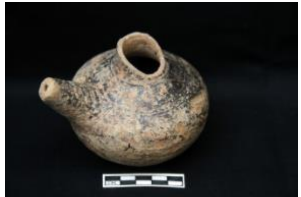
বিরাট রাজার টিবিতে উৎখননে প্রাপ্ত মৃৎপাত্রের তৈরি নলযুক্ত ছোট পাত্র। উপরিভাগ ও নলের অংশ ভাঙ্গা। ধূসর বর্ণের ও কালো রংয়ের প্রলেপযুক্ত। অন্তর চিকন দানা বিশিষ্ট। তলার অংশটি সমতল।