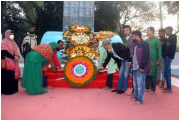
মহান বিজয় দিবস উপলক্ষ্যে জেলা প্রশাসনের সাথে সমন্বয় করে রাজশাহী ও রংপুর আঞ্চলিক কার্যালয় কর্তৃক মুক্তির ফুলবাড়িতে পুষ্পস্তবক অর্পণের আলোকচিত্র

মহান বিজয় দিবস ২০২৩ উপলক্ষ্যে রাজশাহী ও রংপুর আঞ্চলিক কার্যালয় এবং নিয়ন্ত্রণাধীন দপ্তরসমূহে বিভিন্ন কার্যক্রম গ্রহণ করা হয়। তন্মধ্যে অফিস ভবন/জাদুঘর আলোকসজ্জাকরণ, জাতীয় পতাকা উত্তোলন, পুষ্পস্তবক অর্পণ, আলোচনা সভা, দোয়া মাহফিল উল্লেখযোগ্য।