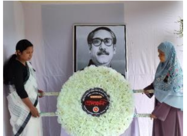
স্বাধীনতার মহান স্থপতি জাতির পিতা বঙ্গবন্ধু শেখ মুজিবুর রহমান ঐর ৪৮তম শাহাদাত বার্ষিকীতে মহা-স্থান প্রত্নতাত্ত্বিক জাদুঘরের পক্ষ থেকে তাঁর অস্থায়ী প্রতিকৃতিতে পুষ্পস্তবক অর্পণ করা হয়