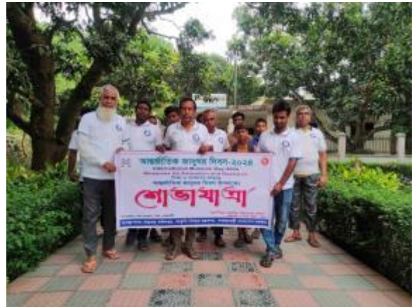
১৮ই মে আন্তর্জাতিক জাদুঘর দিবস উপলক্ষে পুঠিয়া রাজবাড়ি জাদুঘর কর্তৃক আয়োজিত শোভাযাত্রার আলোকচিত্র