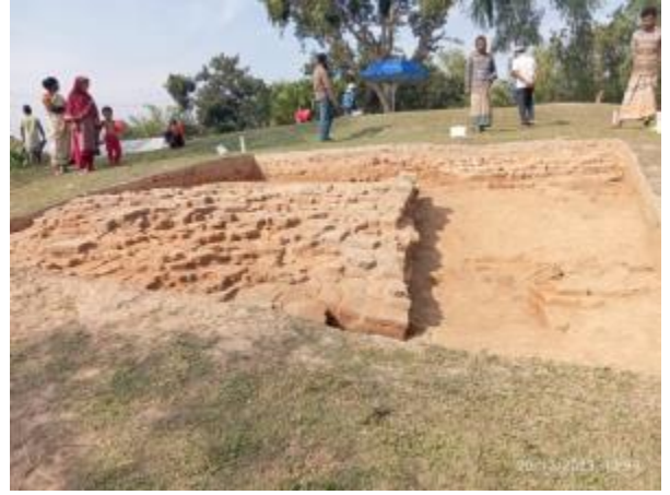
সংরক্ষিত পুরাকীর্তি 'বিরাত রাজার টিবি' প্রত্নস্থানে প্রত্নতাত্ত্বিক উৎখননে উন্মোচিত স্থাপত্য কাঠামোর ক্ষতিগ্রস্ত দেয়ালের একাংশ