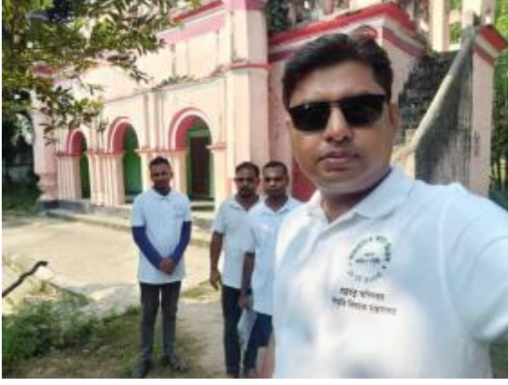
২০২৩-২৪ অর্থ বছরে জরিপ কাজের আলোকচিত্র

২০২৩-২৪ অর্থ বছরে জয়পুরহাট জেলার কালাই, পাঁচবিবি ও ক্ষেতলাল উপজেলার প্রত্নস্থলসমূহের অনুসন্ধানমূলক জরিপ কার্যক্রম গ্রহণ করা হয়।