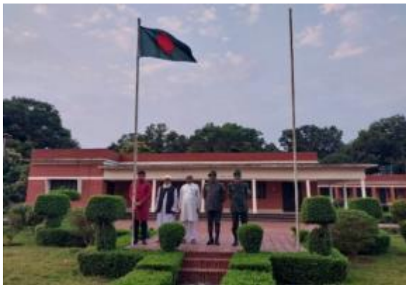
২৬ই মার্চ স্বাধীনতা দিবস উপলক্ষ্যে পাহাড়পুর প্রত্নতাত্ত্বিক জাদুঘরে পতাকা উত্তোলন করা হয়