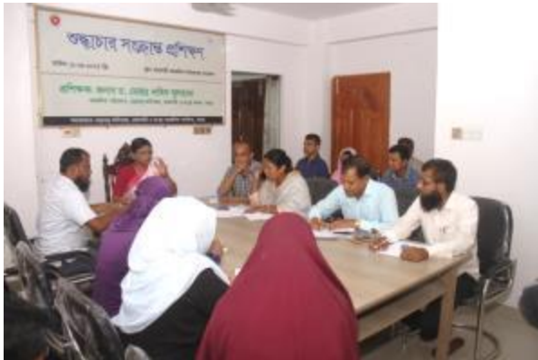
বার্ষিক কর্মসম্পাদন চুক্তি (এপিএ) ২০২৩-২৪ এর লক্ষ্যমাত্রা পূরণের নিমিত্ত রাজশাহী ও রংপুর আঞ্চলিক কার্যালয় কর্তৃক শুদ্ধাচার সংক্রান্ত প্রশিক্ষণের আয়োজন করা হয়।