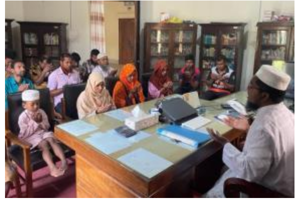
১৭ই মার্চ জাতির পিতা বঙ্গবন্ধু শেখ মুজিবুর রহমান ঐর ১০৪ তম জন্মবার্ষিকী ও জাতীয় শিশু দিবস উপলক্ষে শাহজাদপুর রবীন্দ্র কাছারি বাড়িতে আলোচনা সভা ও দোয়া মাহফিলের আলোকচিত্র