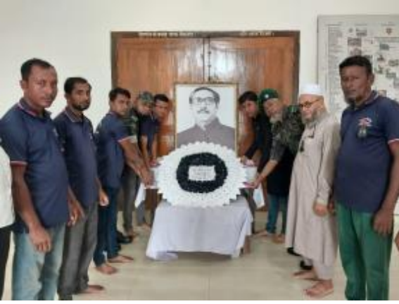
স্বাধীনতার মহান স্থপতি জাতির পিতা বঙ্গবন্ধু শেখ মুজিবুর রহমান ঐর ৪৮তম শাহাদাত বার্ষিকীতে পাহাড়পুর প্রত্নতাত্ত্বিক জাদুঘরের পক্ষ থেকে তাঁর অস্থায়ী প্রতিকৃতিতে পুষ্পস্তবক অর্পণ করা হয়