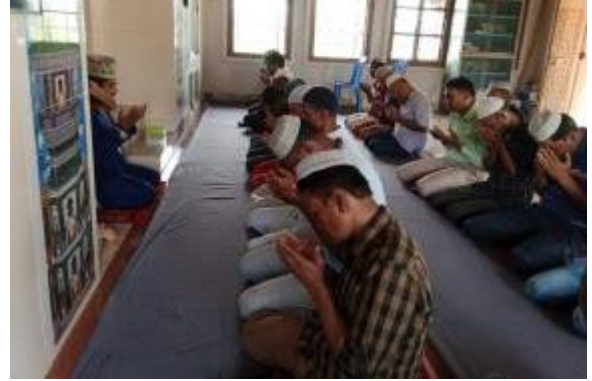
২৫ই মার্চ গণহত্যা দিবস পাহাড়পুর প্রত্নতাত্ত্বিক জাদুঘর কর্তৃক আলোচনা সভা ও দোয়া মাহফিলের আলোকচিত্র