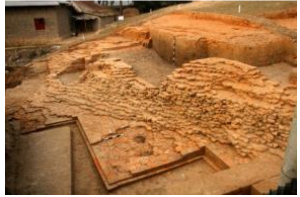
পশ্চিম দক্ষিণের বহুভাজ দেয়াল