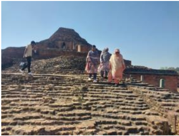
মহাপরিচালক মহোদয়ের পাহাড়পুর বৌদ্ধ বিহার পরিদর্শনের আলোকচিত্র