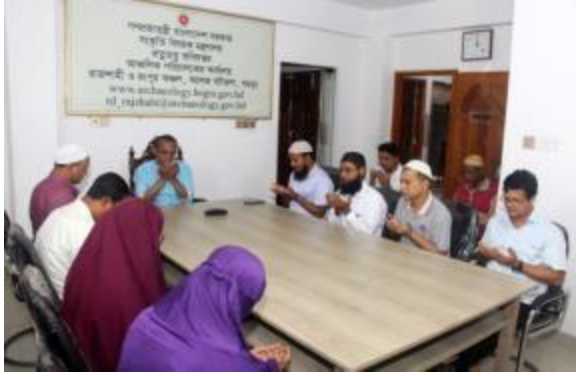
২৫ই মার্চ গণহত্যা দিবস উপলক্ষ্যে রাজশাহী ও রংপুর আঞ্চলিক কার্যালয় কর্তৃক আলোচনা সভা ও দোয়া মাহফিলের আলোকচিত্র