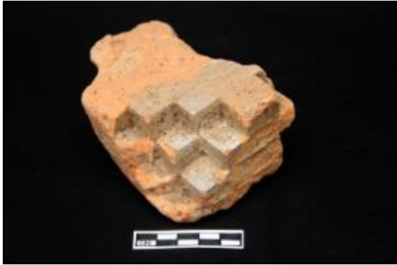
বিরাট রাজার টিবিতে উৎখননে প্রাপ্ত অলংকৃত ইটের ভগ্নাংশ। ইটের এক দিকে পিরামিড নকশা করা এবং আংশিক ক্ষতিগ্রস্ত।