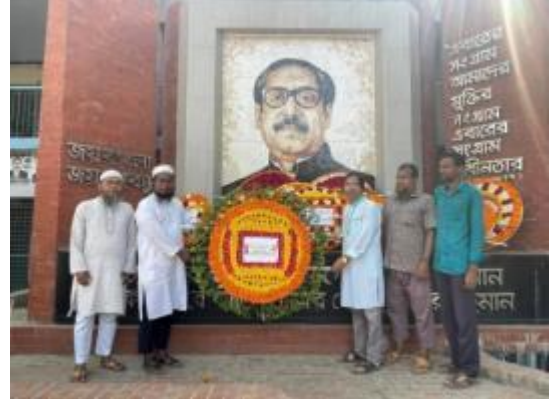
১৭ই মার্চ জাতির পিতা বঙ্গবন্ধু শেখ মুজিবুর রহমান ঐর ১০৪ তম জন্মবার্ষিকী ও জাতীয় শিশু দিবস উপলক্ষে শাহজাদপুর রবীন্দ্র কাছারি বাড়ির পক্ষে উপজেলা প্রশাসনের সাথে সমন্বয় করে জাতির পিতা বঙ্গবন্ধু শেখ মুজিবুর রহমান ঐর অস্থায়ী প্রতিকৃতিতে পুষ্পস্তবক অর্পণ করা হয়