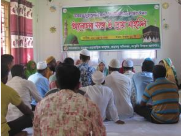
পবিত্র ঈদ-ই-মিলাদুন্নবী (সা.) উপলক্ষ্যে মহাস্থান প্রত্নতাত্ত্বিক জাদুঘরে আলোচনা সভা ও দোয়া মাহফিলের আয়োজন করা হয়।