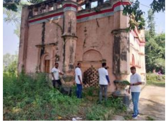
২০২৩-২৪ অর্থ বছরে জরিপ কাজের আলোকচিত্র