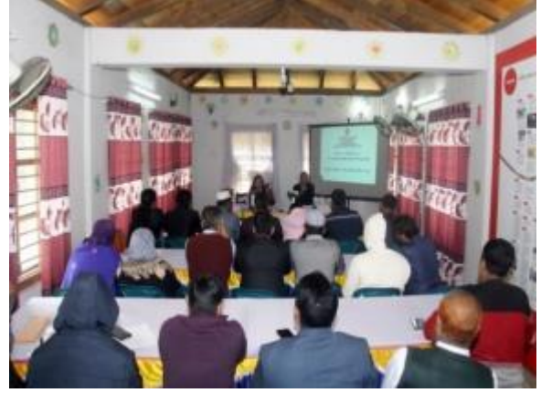
আঞ্চলিক কার্যালয়ের নিয়ন্ত্রণাধীন মহাস্থান প্রত্নতাত্ত্বিক জাদুঘরে অভিযোগ প্রতিকার ব্যবস্থা ও জি.আর.এস বিষয়ক প্রশিক্ষণের আলোকচিত্র