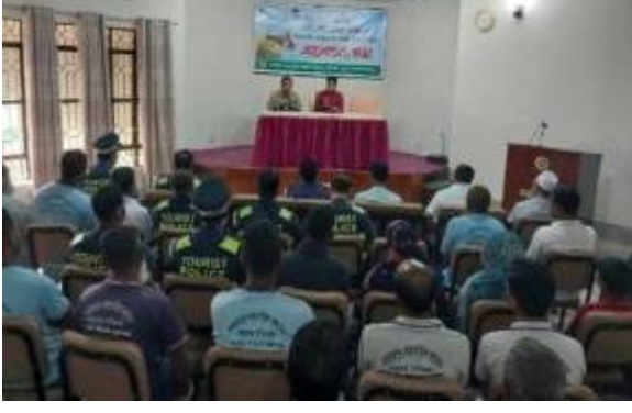
২৬ই মার্চ স্বাধীনতা দিবস উপলক্ষ্যে শাহজাদপুর রবীন্দ্র কাছারি বাড়ি কর্তৃক আলোচনা সভা ও দোয়া মাহফিলের আলোকচিত্র