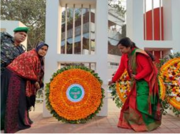
মহান বিজয় দিবস উপলক্ষে উপজেলা প্রশাসনের সাথে সমন্বয় করে মহাস্থান জাদুঘর কর্তৃক পুষ্পস্তবক অর্পণের আলোকচিত্র