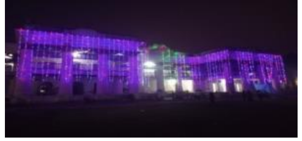
১৬ ডিসেম্বর ২০২৩ উপলক্ষে পুঠিয়া রাজবাড়ি জাদুঘর দপ্তরে আলোকসজ্জাকরণের আলোকচিত্র