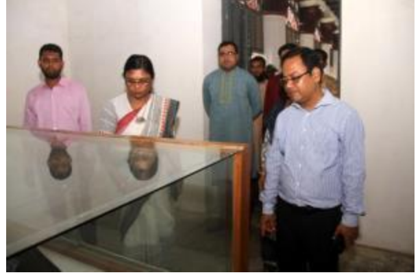
মহাপরিচালক মহোদয় রাজশাহী জেলা পুঠিয়া উপজেলার পুঠিয়া রাজবাড়ি জাদুঘর পরিদর্শন করেন