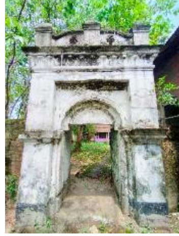
শাখারঞ্জ অমিত চৌধুরীর জমিদার বাড়ির সাধারণ দৃশ্য