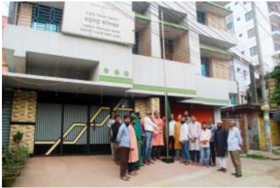
২৬ই মার্চ স্বাধীনতা দিবস উপলক্ষ্যে রাজশাহী ও রংপুর আঞ্চলিক কার্যালয়ে পতাকা উত্তোলন করা হয়