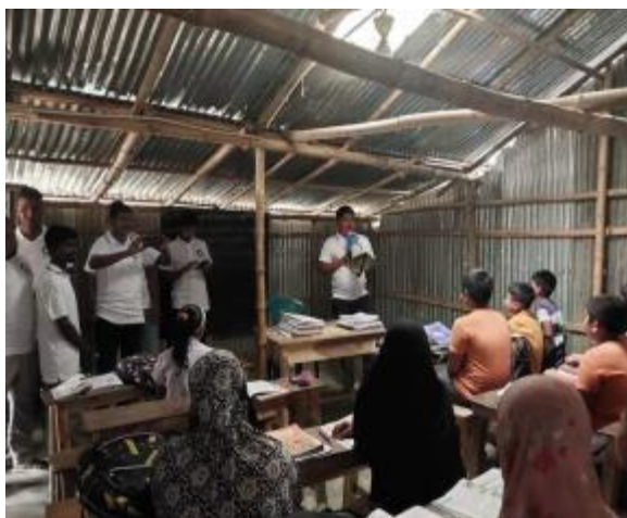
১৮ই মে আন্তর্জাতিক জাদুঘর দিবস উপলক্ষে পাহাড়পুর প্রত্নতাত্ত্বিক জাদুঘর কর্তৃক ছাত্র-ছাত্রীদের নিয়ে আয়োজিত আলোচনা সভার আলোকচিত্র