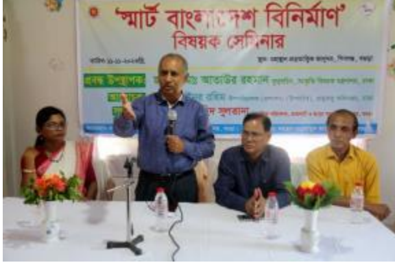
রাজশাহী ও রংপুর আঞ্চলিক কার্যালয় কর্তৃক মহাস্থান প্রল্পতান্ত্রিক জাদুঘরে 'স্মার্ট বাংলাদেশ বিনির্মাণ' বিষয়ে সেমিনার মহাস্থানে প্রল্পতান্ত্রিক জাদুঘরে অনুষ্ঠিত হয়।