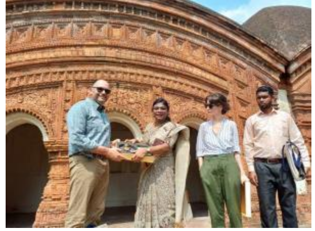
বাংলাদেশে নিযুক্ত আমেরিকান রাষ্ট্রদূত জনাব পিটার হাস মহোদয়কে শুভেচ্ছা উপহার প্রদান করা হয়