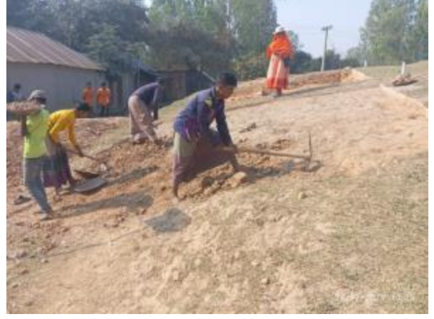
সংরক্ষিত পুরাকীর্তি 'বিরাত রাজার টিবি' প্রত্নস্থানে চলমান উৎখনন কাজ