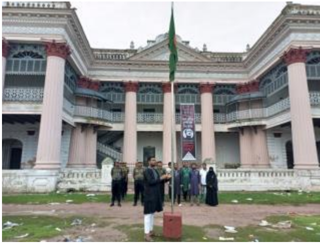
স্বাধীনতার মহান স্থপতি জাতির পিতা বঙ্গবন্ধু শেখ মুজিবুর রহমান ঐর ৪৮তম শাহাদাত বার্ষিকীতে পুঠিয়া রাজবাড়ি জাদুঘরে জাতীয় পতাকা