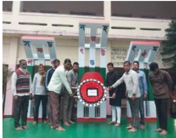
শহীদ দিবস ও আন্তর্জাতিক মাতৃভাষা দিবস উপলক্ষ্যে পাহাড়পুর প্রত্নতাত্ত্বিক জাদুঘরের পক্ষে কেন্দ্রীয় শহীদ মিনারে ভাষা শহীদদের প্রতি পুষ্পস্তবক অর্পণ