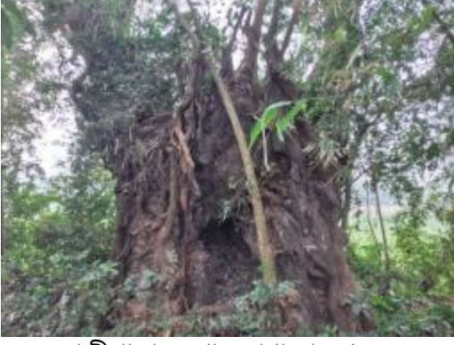
কাজীপাড়া দরগার সাধারণ দৃশ্য