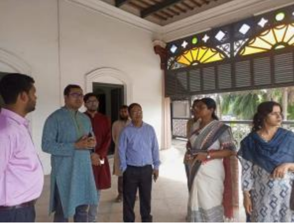
মহাপরিচালক মহোদয় রাজশাহী জেলা পুঠিয়া উপজেলার পুঠিয়া রাজবাড়ি জাদুঘর পরিদর্শন করেন