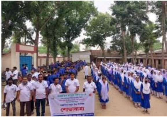
১৮ই মে আন্তর্জাতিক জাদুঘর দিবস উপলক্ষে পাহাড়পুর প্রত্নতাত্ত্বিক জাদুঘর কর্তৃক আয়োজিত শোভাযাত্রার আলোকচিত্র