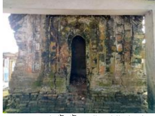
কালাইহাট দরগার সাধারণ দৃশ্য