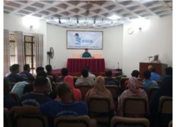
শেখ রাসেল দিবস উপলক্ষ্যে পাহাড়পুর জাদুঘরে আলোচনা সভা ও দোয়া মাহফিলের আয়োজন করা হয়