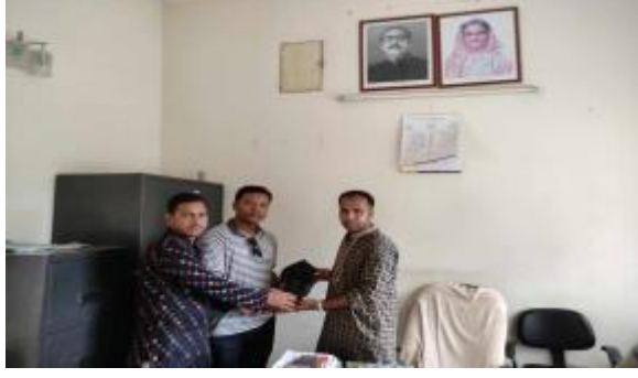
সৈয়দপুর থানা, নীলফামারী হতে কালো পাথরের একটি মূর্তির খন্ডাংশ সংগ্রহ করছেন এসিসট্যান্ট কাস্টোডিয়ান, কান্তনগর প্রত্নতাত্ত্বিক জাদুঘর, কাহারোল, দিনাজপুর