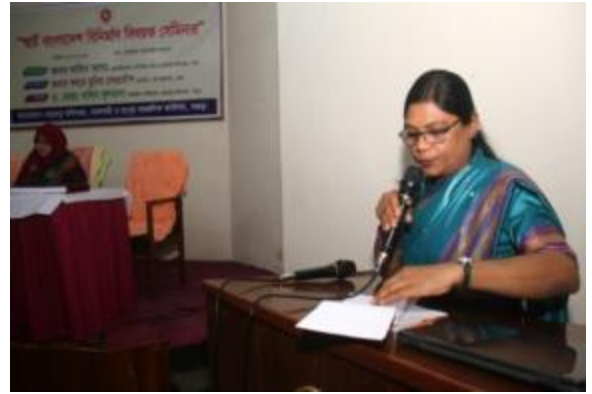
পাহাড়পুর প্রত্নতাত্ত্বিক জাদুঘরে “স্মার্ট বাংলাদেশ বিনির্মাণ” বিষয়ক সেমিনারের আলোকচিত্র