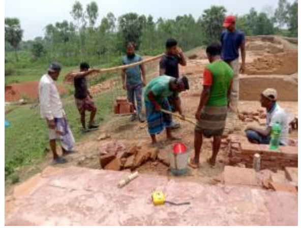
নওগাঁ জেলার খামইরহাট উপজেলার জগদল বিহারের সংস্কার-সংরক্ষণ কাজ