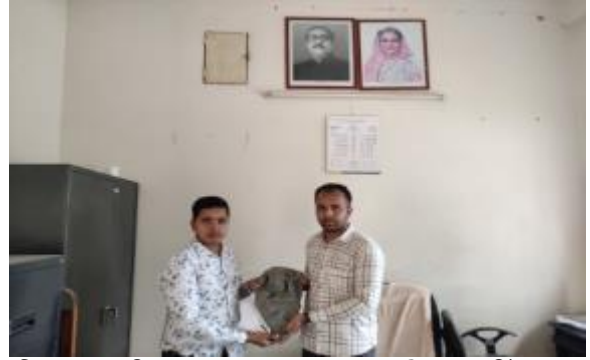
বীরগঞ্জ থানা, দিনাজপুর হতে কালোপাথরের একটি গণেশ মূর্তি খন্ডাংশ গ্রহণ করছেন এসিসট্যান্ট কাস্টোডিয়ান, কান্তনগর প্রত্নতাত্ত্বিক জাদুঘর, কাহারোল, দিনাজপুর