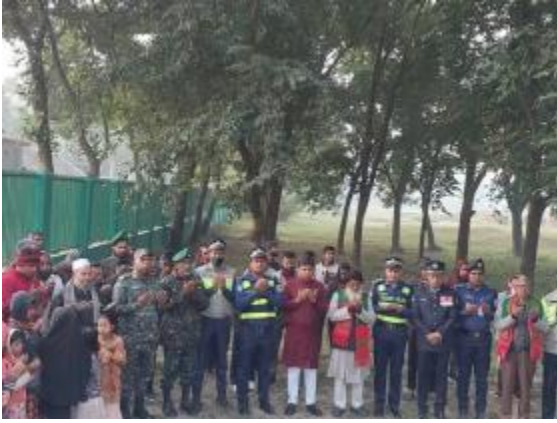
মহান মুক্তিযুদ্ধে নিহত সকল শহীদ বীর মুক্তিযোদ্ধাসহ ১৯৭৫ সালের ১৫ আগস্ট বঙ্গবন্ধুসহ তাঁর পরিবারের সকল শাহাদত বরণকারী শহীদের আত্মার মাগফেরাত কামনা করে পাহাড়পুর জাদুঘরে আয়োজিত দোয়া মাহফিলের আলোকচিত্র