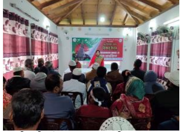
মহান বিজয় দিবস উপলক্ষে মহাস্থান প্রত্নতাত্ত্বিক জাদুঘরে আলোচনা সভার আয়োজন করা হয়।