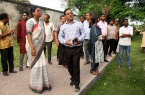
মহাপরিচালক মহোদয় রাজশাহী জেলা পুঠিয়া উপজেলার রাণী মহল পরিদর্শন করেন