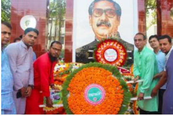
১৭ই মার্চ জাতির পিতা বঙ্গবন্ধু শেখ মুজিবুর রহমান ঐর ১০৪ তম জন্মবার্ষিকী ও জাতীয় শিশু দিবস উপলক্ষে রাজশাহী ও রংপুর আঞ্চলিক কার্যালয়ের পক্ষে জেলা প্রশাসনের সাথে সমন্বয় করে জাতির পিতা বঙ্গবন্ধু শেখ মুজিবুর রহমান ঐর অস্থায়ী প্রতিকৃতিতে পুষ্পস্তবক অর্পণ করা হয়