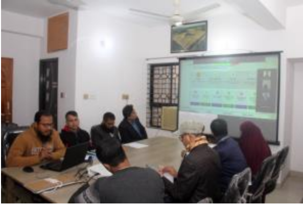
বার্ষিক কর্মসম্পাদন চুক্তি (এপিএ) ২০২৩-২৪ এর লক্ষ্যমাত্রা পূরণের নিমিত্ত রাজশাহী ও রংপুর আঞ্চলিক কার্যালয় কর্তৃক অভিযোগ প্রতিকার ব্যবস্থা ও GRS সফটওয়্যার বিষয়ক প্রশিক্ষণে (অনলাইন/অফলাইন) আয়োজন করা হয়।