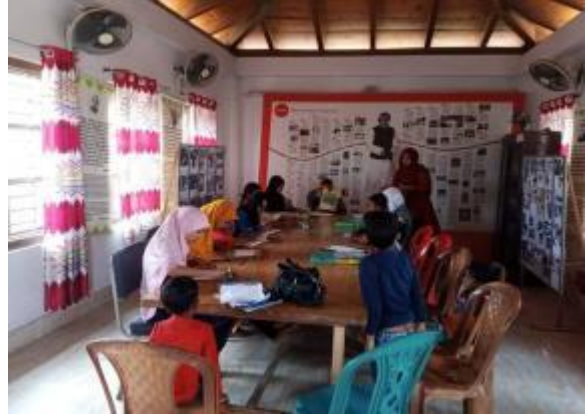
শহীদ দিবস ও আন্তর্জাতিক মাতৃভাষা দিবস উপলক্ষে পাহাড়পুর পত্রতান্ত্রিক জাদুঘরের পক্ষে রচনা প্রতিযোগিতার আলোকচিত্র