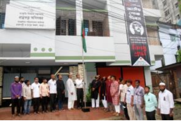
স্বাধীনতার মহান স্থপতি জাতির পিতা বঙ্গবন্ধু শেখ মুজিবুর রহমান ঐর ৪৮তম শাহাদাত বার্ষিকীতে রাজশাহী ও রংপুর আঞ্চলিক কার্যালয়ের জাতীয় পতাকা অর্ধনমিত করা হয়