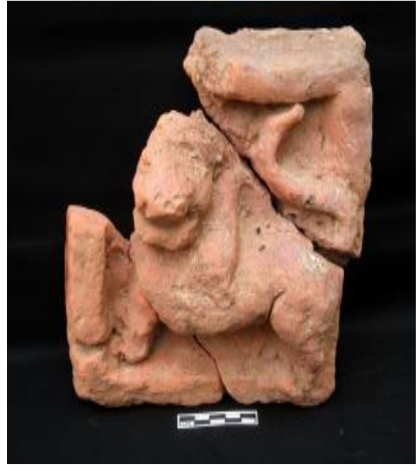
বিরাত রাজার টিবিতে উৎখননে প্রাপ্ত পোড়ামাটির ফলকটিরের ভগ্নাংশ। খুব সম্ভব একটি সিংহের প্রতিকৃতি অঙ্কিত। মাথার উপরিভাগ এবং পিছনের দিকের অংশ নেই।