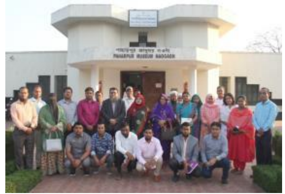
পাহাড়পুর প্রত্নতাত্ত্বিক জাদুঘরে অনুষ্ঠিত “স্মার্ট বাংলাদেশ বিনির্মাণ” বিষয়ক সেমিনা শেষে মহাপরিচালক মহোদয়সহ অংশগ্রহণকারীগণের গ্রুপ আলোকচিত্র (০৯-০৩-২০২৪)