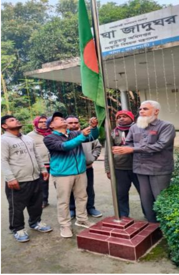
মহান বিজয় দিবস ২০২৩ উপলক্ষ্যে সূর্যোদয়ের সাথে সাথে বাঘা জাদুঘরে জাতীয় পতাকা উত্তোলন করা হয়