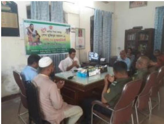
১৭ই মার্চ জাতির পিতা বঙ্গবন্ধু শেখ মুজিবুর রহমান ঐর ১০৪ তম জন্মবার্ষিকী ও জাতীয় শিশু দিবস উপলক্ষে রংপুর তাজহাট জমিদার বাড়িতে আলোচনা সভা ও দোয়া মাহফিলের আলোকচিত্র