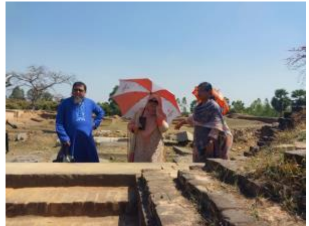
মহাপরিচালক মহোদয়ের নওগাঁ জেলার ধামইরহাট উপজেলার সংরক্ষিত পুরাকীর্তি জগদল বিহার পরিদর্শনের আলোকচিত্র