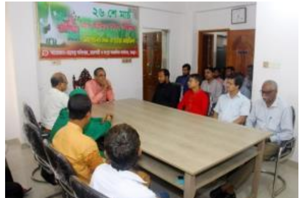
২৬ই মার্চ স্বাধীনতা দিবস উপলক্ষ্যে রাজশাহী ও রংপুর আঞ্চলিক কার্যালয় কর্তৃক আলোচনা সভা ও দোয়া মাহফিলের আলোকচিত্র