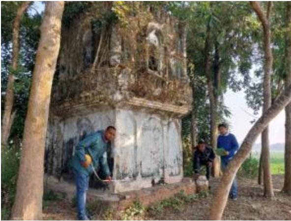
জয়পুরহাট জেলার কালাই উপজেলার জিন্দারপুর ইউনিয়নের কাদিরপুর গ্রামে অনুসন্ধানমূলক জরিপ চলাকালীন প্রাপ্ত প্রাচীন মঠ