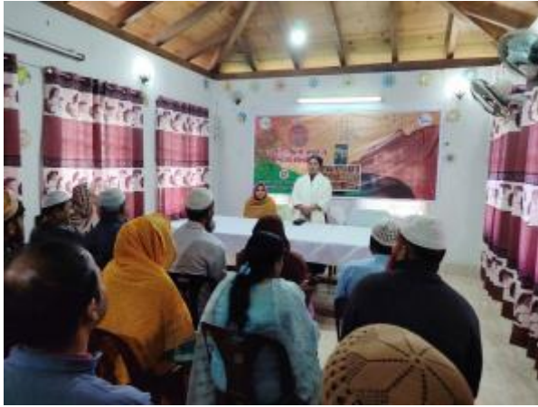
১৪ই ডিসেম্বর শহীদ বুদ্ধিজীবী দিবসে মহাস্থান প্রত্নতাত্ত্বিক জাদুঘরে আলোচনা সভা ও দোয়া মাহফিলের আয়োজন করা হয়