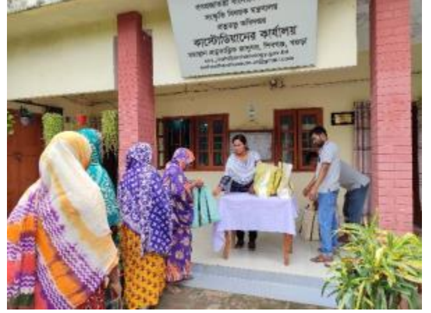
স্বাধীনতার মহান স্থপতি জাতির পিতা বঙ্গবন্ধু শেখ মুজিবুর রহমান ঐর ৪৮তম শাহাদাত বার্ষিকীতে মহাস্থান জাদুঘরের পক্ষ থেকে গরীব অসহায়দের খাদ্য সহায়তা প্রদান করা হয়