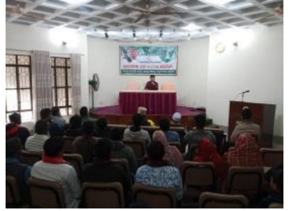
মহান বিজয় দিবস উপলক্ষ্যে পাহাড়পুর জাদুঘরে আলোচনা সভার আয়োজন করা হয়