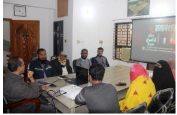
১৪ই ডিসেম্বর শহীদ বুদ্ধিজীবী দিবসে রাজশাহী ও রংপুর আঞ্চলিক কার্যালয়ে আলোচনা সভা ও দোয়া মাহফিলের আয়োজন করা হয়