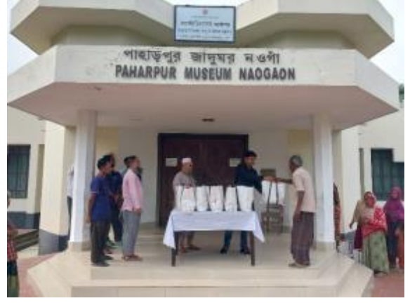
স্বাধীনতার মহান স্থপতি জাতির পিতা বঙ্গবন্ধু শেখ মুজিবুর রহমান ঐর ৪৮তম শাহাদাত বার্ষিকীতে পাহাড়পুর জাদুঘরের পক্ষ থেকে গরীব অসহায়দের খাদ্য সহায়তা প্রদান করা হয়