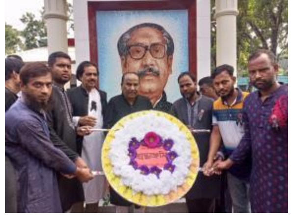
স্বাধীনতার মহান স্থপতি জাতির পিতা বঙ্গবন্ধু শেখ মুজিবুর রহমান ঐর ৪৮তম শাহাদাত বার্ষিকীতে পুঠিয়া রাজবাড়ি জাদুঘরের পক্ষ থেকে তাঁর অস্থায়ী প্রতিকৃতিতে পুষ্পস্তবক অর্পণ করা হয়