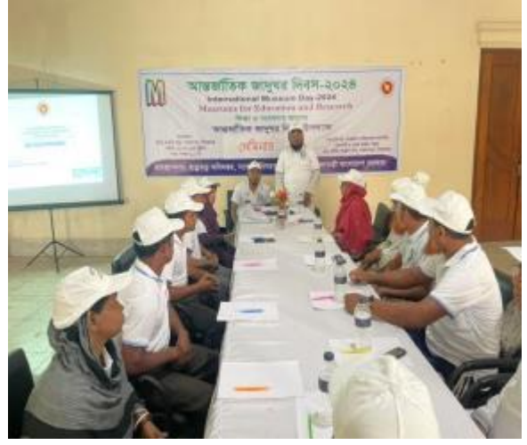
১৮ই মে আন্তর্জাতিক জাদুঘর দিবস উপলক্ষে শাহজাদপুর রবীন্দ্র কাছারি বাড়ি কর্তৃক আয়োজিত আলোচনা সভার আলোকচিত্র