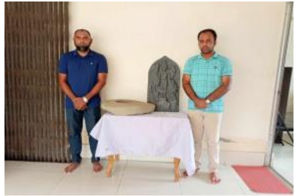
বিরল থানা, দিনাজপুর হতে কালোপাথরের একটি বিষ্ণুমূর্তি ও একটি গৌরিপট্ট সংগ্রহ করছেন এসিসট্যান্ট কাস্টোডিয়ান, কান্তনগর প্রত্নতাত্ত্বিক জাদুঘর, কাহারোল, দিনাজপুর