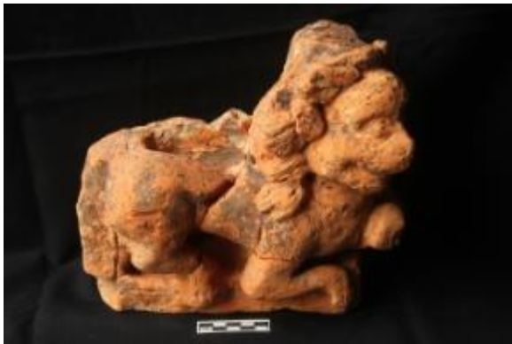
বিরাট রাজার টিবিতে উৎখননে প্রাপ্ত পোড়ামাটির ফলক। ফলকে বসে থাকা একটি সিংহের প্রতিকৃতি রয়েছে। আংশিক ভাঙ্গা এবং নাই (তিন অংশে ভাঙ্গা)