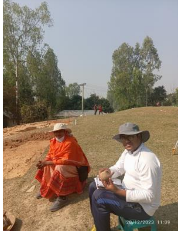
সংরক্ষিত পুরাকীর্তি 'বিরাত রাজার টিবি' প্রত্নস্থানে প্রত্নতাত্ত্বিক উৎখননে প্রাপ্ত প্রত্নবস্তু