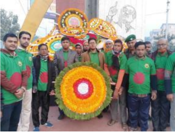
মহান বিজয় দিবস উপলক্ষে রংপুর জাদুঘর কর্তৃক পুষ্পস্তবক অর্পণের আলোকচিত্র