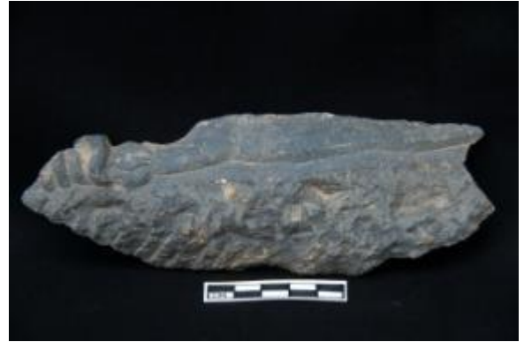
বিরাট রাজার টিবিতে উৎখননে প্রাপ্ত অলংকৃত কালো পাথরের ভগ্নাংশ।