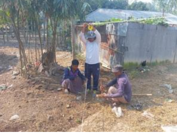
সংরক্ষিত পুরাকীর্তি 'বিরাত রাজার টিবি' প্রত্নস্থানে প্রত্নতাত্ত্বিক উৎখনন আরম্ভের পূর্বে সেকশন পরিমাপের আলোকচিত্র