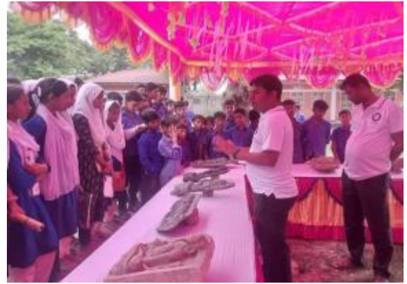
১৮ই মে আন্তর্জাতিক জাদুঘর দিবস উপলক্ষে পাহাড়পুর প্রত্নতাত্ত্বিক কর্তৃক আয়োজিত প্রত্নবস্তু প্রদর্শনীর আলোকচিত্র