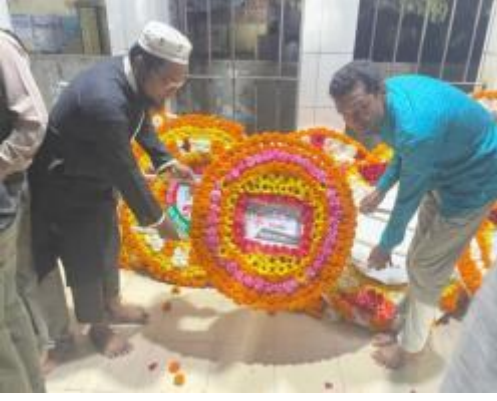
শহীদ দিবস ও আন্তর্জাতিক মাতৃভাষা দিবস উপলক্ষে শাহজাদপুর রবীন্দ্র কাছারি বাড়ির পক্ষে কেন্দ্রীয় শহীদ মিনারে ভাষা শহীদদের প্রতি পুষ্পস্তবক অর্পণ