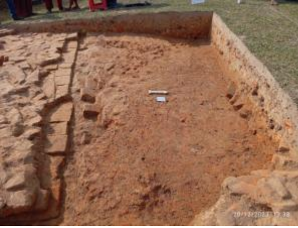
সংরক্ষিত পুরাকীর্তি 'বিরাত রাজার টিবি' প্রত্নস্থানে প্রত্নতাত্ত্বিক উৎখননে উন্মোচিত স্থাপত্য কাঠামোর ক্ষতিগ্রস্ত দেয়ালের একাংশ