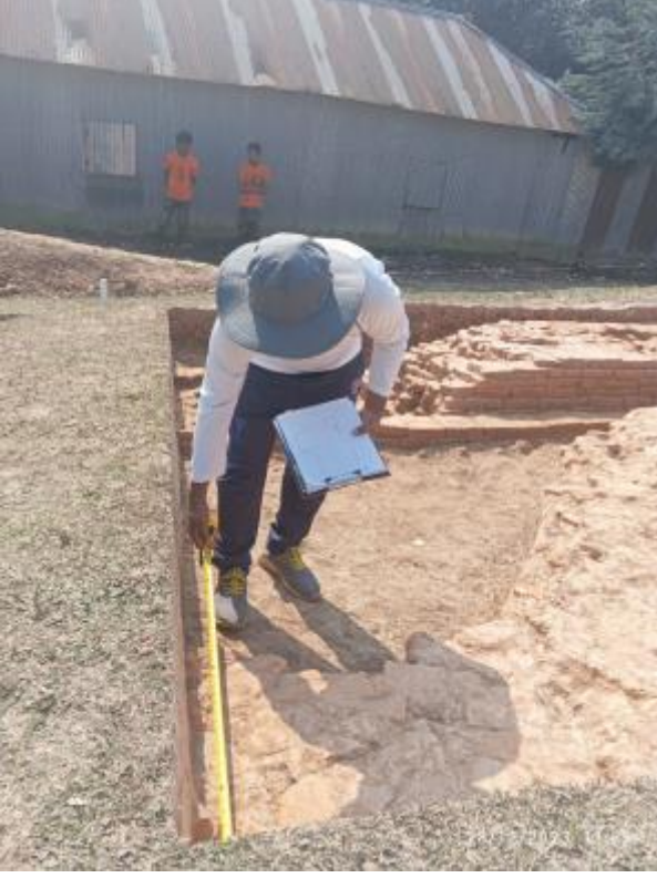
সংরক্ষিত পুরাকীর্তি 'বিরাত রাজার টিবি' প্রত্নস্থানে প্রত্নতাত্ত্বিক উৎখননে উন্মোচিত স্থাপত্য কাঠামোর দেয়ালের প্রশস্ততা পরিমাপের আলোকচিত্র