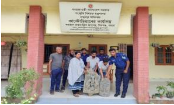
দুপচাঁচিয়া থানা, বগুড়ার হতে কালোপাথরের তৈরি একটি বিষ্ণু মূর্তি ও একটি সূর্যমূর্তি গ্রহণ করছেন কাস্টোডিয়ান, মহাস্থান প্রত্নতাত্ত্বিক জাদুঘর, শিবগঞ্জ, বগুড়া