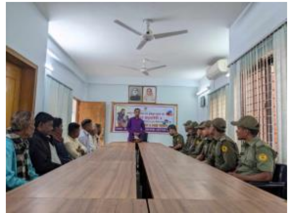
১৭ই মার্চ জাতির পিতা বঙ্গবন্ধু শেখ মুজিবুর রহমান ঐর ১০৪ তম জন্মবার্ষিকী ও জাতীয় শিশু দিবস উপলক্ষে কান্তনগর প্রত্নতাত্ত্বিক জাদুঘরে আলোচনা সভা ও দোয়া মাহফিলের আলোকচিত্র