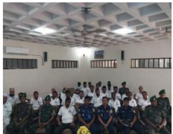
১৮ই মে আন্তর্জাতিক জাদুঘর দিবস উপলক্ষে পাহাড়পুর প্রত্নতাত্ত্বিক জাদুঘর কর্তৃক আয়োজিত সেমিনারের আলোকচিত্র