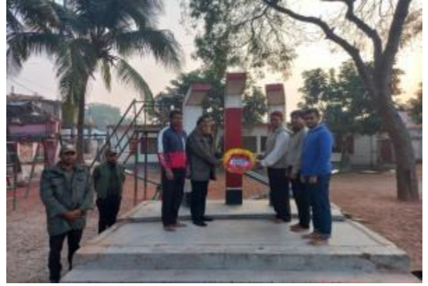
মহান বিজয় দিবস উপলক্ষ্যে পতিসর রবীন্দ্র স্মৃতি জাদুঘর কর্তৃক পুষ্পস্তবক অর্পণের আলোকচিত্র