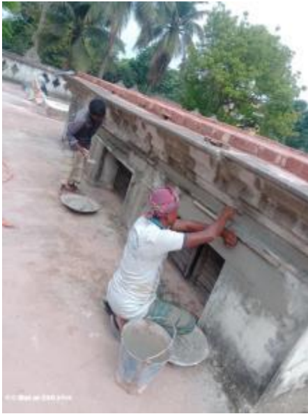
নাটোর জেলার সদর উপজেলার বৈঠকখানা প্রহরস্থলের সংস্কার-সংরক্ষণ কাজ