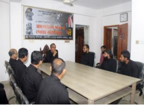
শহীদ দিবস ও আন্তর্জাতিক মাতৃভাষা দিবস উপলক্ষে রাজশাহী আঞ্চলিক কার্যালয়ের পক্ষে আলোচনা সভা ও দোয়া মাহফিল