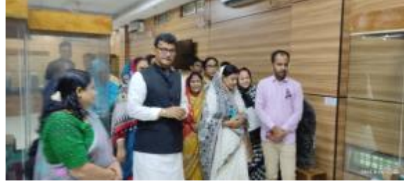
জনাব খালিদ মাহমুদ চৌধুরী, মাননীয় প্রতিমন্ত্রী, নৌ-পরিবহন মন্ত্রণালয় কান্তনগর প্রত্নতাত্ত্বিক জাদুঘর পরিদর্শন করেন