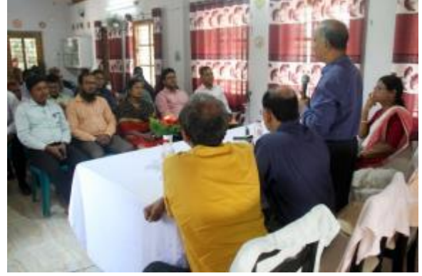
রাজশাহী ও রংপুর আঞ্চলিক কার্যালয় কর্তৃক মহাস্থান প্রল্পতান্ত্রিক জাদুঘরে 'স্মার্ট বাংলাদেশ বিনির্মাণ' বিষয়ে সেমিনার মহাস্থানে প্রল্পতান্ত্রিক জাদুঘরে অনুষ্ঠিত হয়।