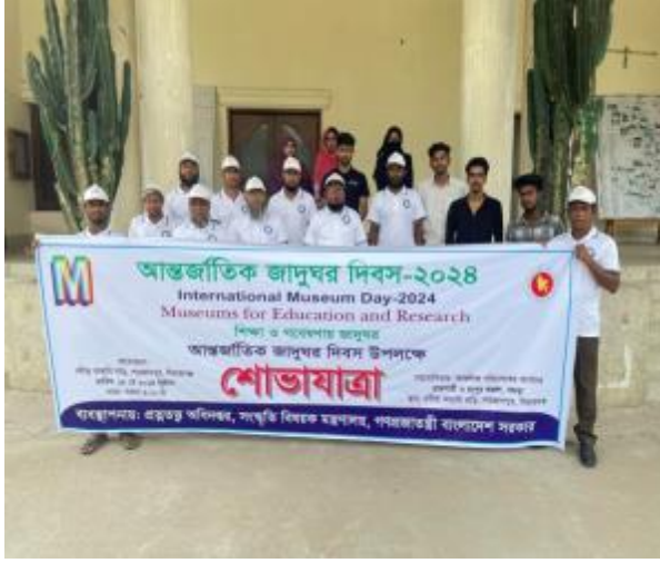
১৮ই মে আন্তর্জাতিক জাদুঘর দিবস উপলক্ষে শাহজাদপুর রবীন্দ্র কাছারি বাড়ি কর্তৃক আয়োজিত শোভাযাত্রার আলোকচিত্র