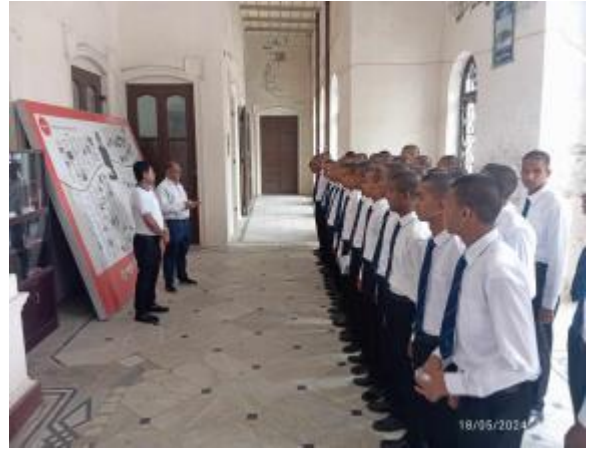
১৮ই মে আন্তর্জাতিক জাদুঘর দিবস উপলক্ষে রংপুর তাজহাট জমিদার বাড়ি কর্তৃক ছাত্রদের নিয়ে আয়োজিত আলোচনা সভার আলোকচিত্র