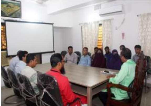
১৭ই মার্চ জাতির পিতা বঙ্গবন্ধু শেখ মুজিবুর রহমান ঐর ১০৪ তম জন্মবার্ষিকী ও জাতীয় শিশু দিবস উপলক্ষে রাজশাহী ও রংপুর আঞ্চলিক কার্যালয়ের আলোচনা সভা ও দোয়া মাহফিলের আলোকচিত্র