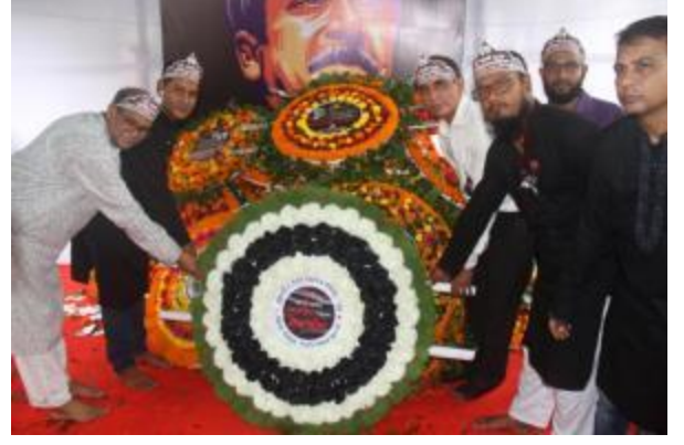
স্বাধীনতার মহান স্থপতি জাতির পিতা বঙ্গবন্ধু শেখ মুজিবুর রহমান ঐর ৪৮তম শাহাদাত বার্ষিকীতে রাজশাহী ও রংপুর আঞ্চলিক কার্যালয়ের পক্ষ থেকে তাঁর অস্থায়ী প্রতিকৃতিতে পুষ্পস্তবক অর্পণ করা হয়