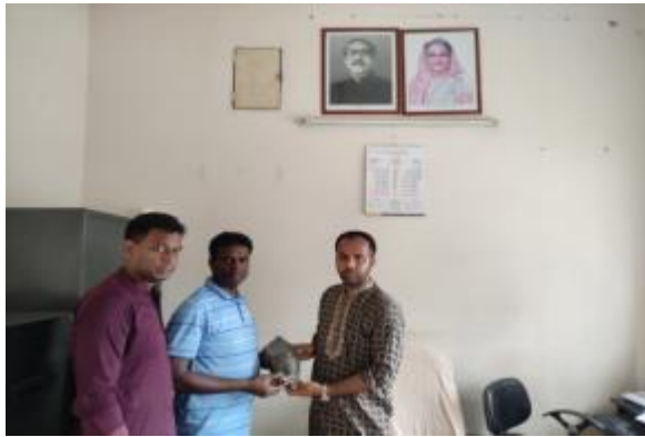
বীরগঞ্জ থানা, দিনাজপুর হতে কালোপাথরের একটি মূর্তির খন্ডাংশ সংগ্রহ করছেন এসিসট্যান্ট কাস্টোডিয়ান, কান্তনগর প্রত্নতাত্ত্বিক জাদুঘর, কাহারোল, দিনাজপুর