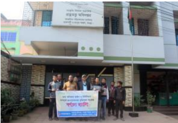
বার্ষিক কর্মসম্পাদন চুক্তি (এপিএ) ২০২৩-২৪ এর লক্ষ্যমাত্রা পূরণের নিমিত্ত রাজশাহী ও রংপুর আঞ্চলিক কার্যালয় কর্তৃক তথ্য অধিকার আইন ও বিধিবিধান সম্পর্কে জনসচেতনতা বৃদ্ধিকরণের নিমিত্ত প্রচার কার্যক্রম পরিচালনা করা হয়।