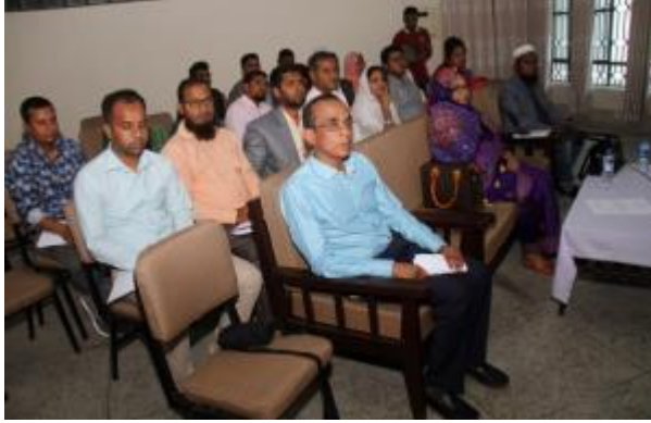
পাহাড়পুর প্রত্নতাত্ত্বিক জাদুঘরে অনুষ্ঠিত “স্মার্ট বাংলাদেশ বিনির্মাণ” বিষয়ক সেমিনার এর আলোকচিত্র (০৯-০৩-২০২৪)