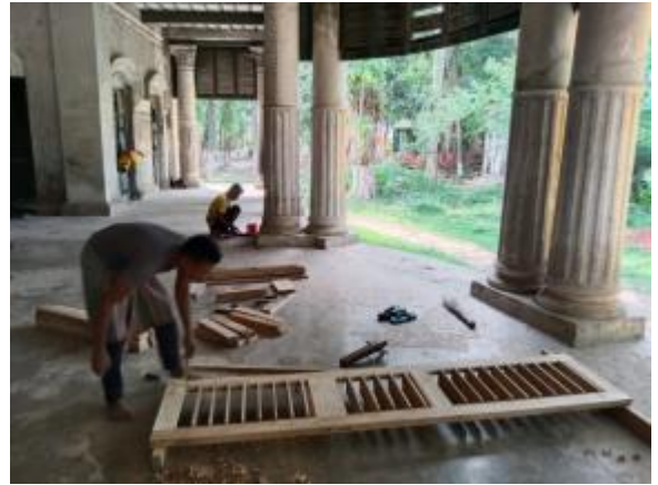
নাটোর জেলার সদর উপজেলার ছোট তরফ এর লুভার দরজার চৌকট তৈরীর কাজ