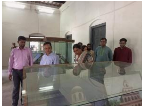
মহাপরিচালক মহোদয় রাজশাহী জেলা পুঠিয়া উপজেলার পুঠিয়া রাজবাড়ি জাদুঘর পরিদর্শন করেন