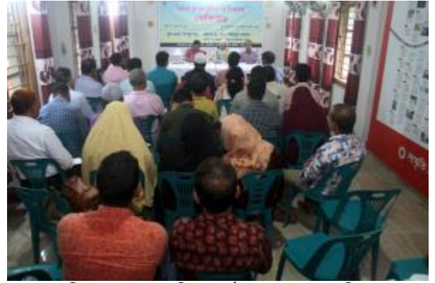
রাজশাহী ও রংপুর আঞ্চলিক কার্যালয় কর্তৃক আয়োজিত 'সেবা প্রদান প্রতিশ্রুতি' বিষয়ে সেমিনার মহাস্থানে প্রল্পতান্ত্রিক জাদুঘরে অনুষ্ঠিত হয়।