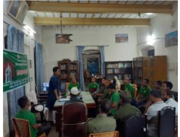
২৬ই মার্চ স্বাধীনতা দিবস উপলক্ষ্যে রংপুর তাজহাট জমিদার বাড়ি কর্তৃক আলোচনা সভা ও দোয়া মাহফিলের আলোকচিত্র