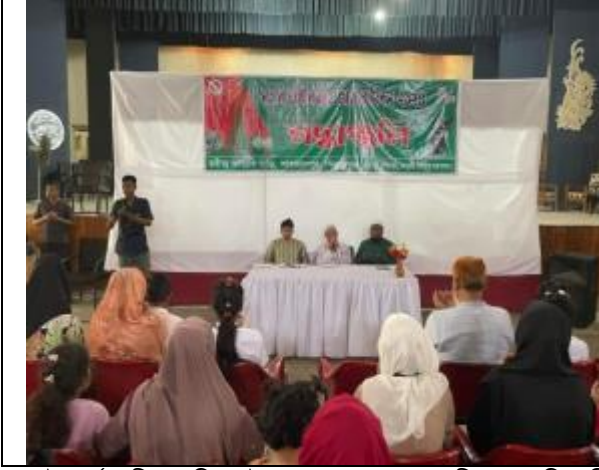
২৬ই মার্চ স্বাধীনতা দিবস উপলক্ষ্যে শাহজাদপুর রবীন্দ্র কাছারি বাড়ি কর্তৃক আলোচনা সভা ও দোয়া মাহফিলের আলোকচিত্র