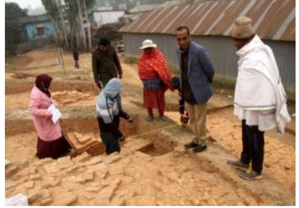
উৎখনন কার্যক্রম পরিচালনার আলোকচিত্র