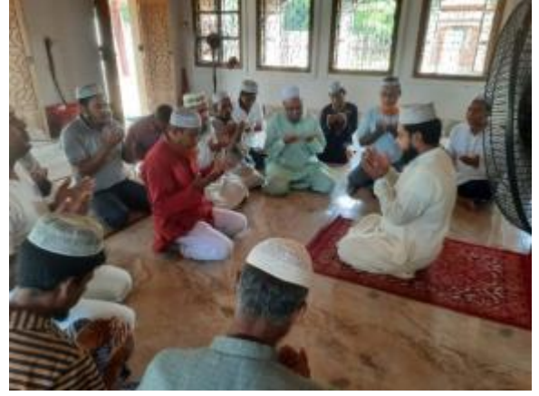
পবিত্র ঈদ-ই-মিলাদুন্নবী (সা.) উপলক্ষ্যে পাহাড়পুর প্রত্নতাত্ত্বিক জাদুঘরে আলোচনা সভা ও দোয়া মাহফিলের আয়োজন করা হয়।