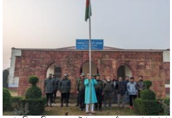
মহান বিজয় দিবস ২০২৩ উপলক্ষ্যে সূর্যোদয়ের সাথে সাথে কান্তনগর প্রত্নতাত্ত্বিক জাদুঘরে জাতীয় পতাকা উত্তোলন করা হয়