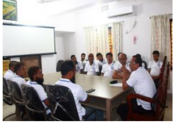
১৮ই মে আন্তর্জাতিক জাদুঘর দিবস উপলক্ষে রাজশাহী ও রংপুর আঞ্চলিক কার্যালয়ের আলোচনা সভার আলোকচিত্র