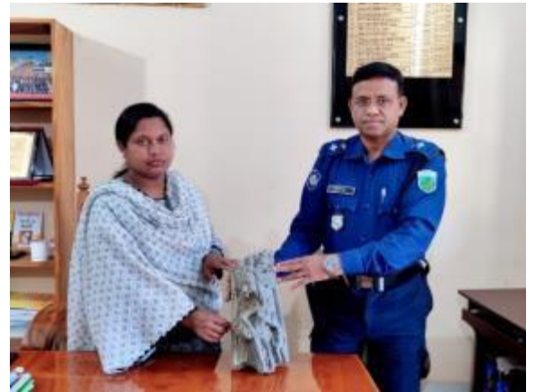
দুপচাঁচিয়া থানা হতে কালো পাথরের তৈরি বিষ্ণু মূর্তির নিম্নাংশ গ্রহণ করছেন কাস্টোডিয়ান, মহাস্থান প্রত্নতাত্ত্বিক জাদুঘর