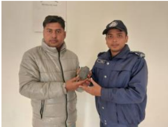
নিয়ামতপুর থানা হতে কালো পাথরের মূর্তি ও মুখমন্ডল গ্রহণ করছেন কাস্টোডিয়ান, পাহাড়পুর প্রত্নতাত্ত্বিক জাদুঘর