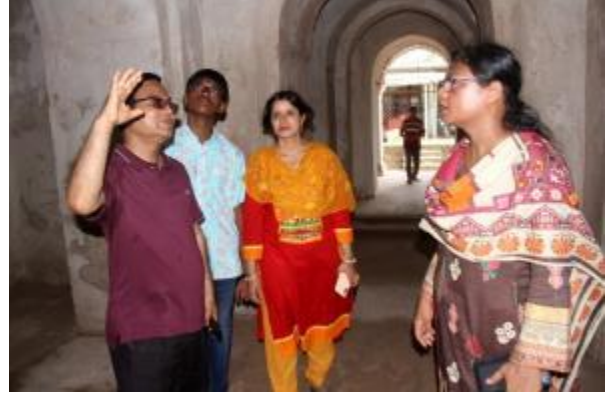
মহাপরিচালক মহোদয় রাজশাহী জেলা পুঠিয়া উপজেলার পুঠিয়া রাজবাড়িস্থ দোল মন্দির পরিদর্শন করেন