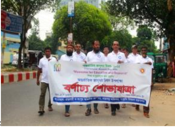
১৮ই মে আন্তর্জাতিক জাদুঘর দিবস উপলক্ষে রাজশাহী ও রংপুর আঞ্চলিক কার্যালয় কর্তৃক আয়োজিত শোভাযাত্রার আলোকচিত্র