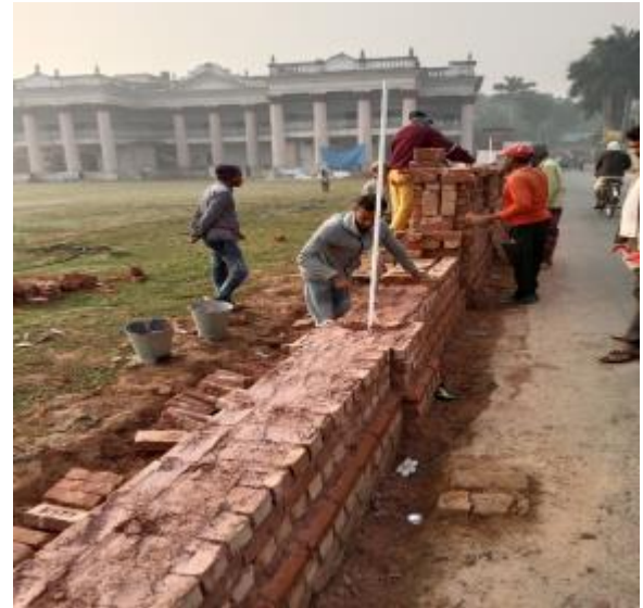
রাজশাহী জেলার পুঠিয়া উপজেলার পুঠিয়া রাজবাড়ির সম্মুখে বিদ্যমান ফাঁকা স্থানের চারিপার্শ্বের সীমানা প্রাচীর নির্মাণ কাজের আলোকচিত্র