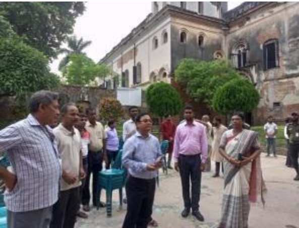
মহাপরিচালক মহোদয় রাজশাহী জেলা পুঠিয়া উপজেলার পুঠিয়া রাজবাড়ি জাদুঘর পরিদর্শন করেন