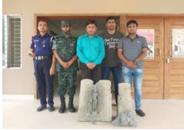
নওগাঁ জেলার পল্লীতলা থানা হতে কালো পাথরের মূর্তি গ্রহণ করেছেন কাস্টোডিয়ান, পাহাড়পুর প্রত্নতাত্ত্বিক জাদুঘর