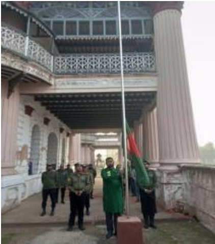
মহান বিজয় দিবস ২০২৩ উপলক্ষে সূর্যোদয়ের সাথে সাথে পুঠিয়া রাজবাড়ি জাদুঘরে জাতীয় পতাকা উত্তোলন করা হয়