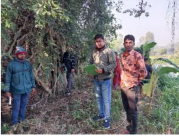
জয়পুরহাট জেলার কালাই উপজেলার জিন্দারপুর ইউনিয়নের বিষ্টিপুর গ্রামে অনুসন্ধানমূলক জরিপ চলাকালীন প্রাপ্ত ক্ষতিগ্রস্থ মন্দির