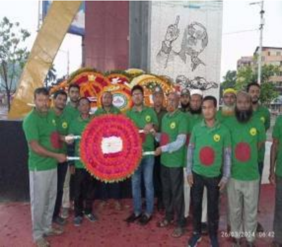
২৬ই মার্চ স্বাধীনতা দিবস উপলক্ষ্যে রংপুর তাজহাট জমিদার বাড়ি কর্তৃক জাতির পিতা বঙ্গবন্ধু শেখ মুজিবুর রহমান ঐর অস্থায়ী প্রতিকৃতিতে পুষ্পস্তবক অর্পণ করা হয়