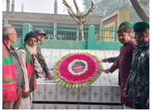
মহান বিজয় দিবস উপলক্ষ্যে পাহাড়পুর প্রত্নতাত্ত্বিক জাদুঘরের পক্ষে মুক্তিযুদ্ধে শহীদ বীর মুক্তিযোদ্ধাদের কবরে শ্রদ্ধাঞ্জলি অর্পণের আলোকচিত্র