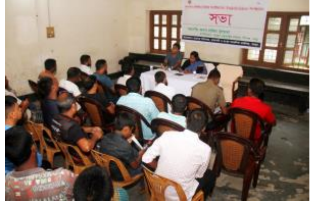
বার্ষিক কর্মসম্পাদন চুক্তি (এপিএ) ২০২৩-২৪ এর লক্ষ্যমাত্রা পূরণের নিমিত্ত রাজশাহী ও রংপুর আঞ্চলিক কার্যালয় কর্তৃক গোকুল মেধ প্রদ্রস্থানে সুশাসন প্রতিষ্ঠার নিমিত্ত অংশীজনের অংশগ্রহণ সভার আয়োজন করা হয়।