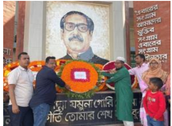
ঐতিহাসিক ০৭ ই মার্চ উপলক্ষে শাহজাদপুর রবীন্দ্র কাছারি বাড়ির পক্ষ থেকে উপজেলা প্রশাসনের সাথে সমন্বয় করে তাঁর অস্থায়ী প্রতিকৃতিতে পুষ্পস্তবক অর্পণ করা হয়