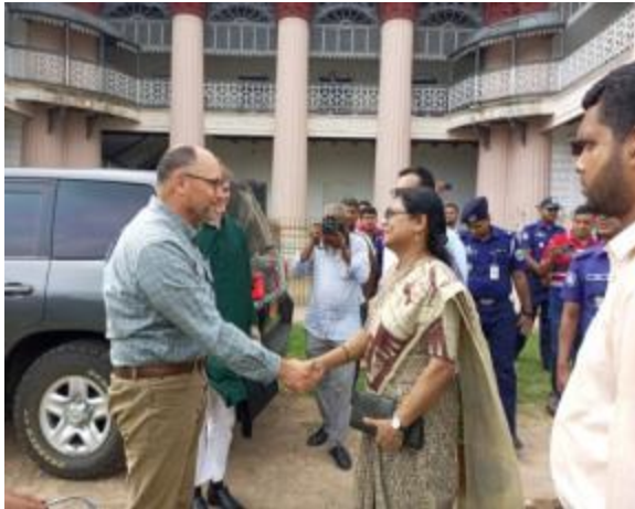
বাংলাদেশে নিযুক্ত আমেরিকান রাষ্ট্রদূত জনাব পিটার হাস পুঠিয়া রাজবাড়ি জাদুঘর পরিদর্শন করেন