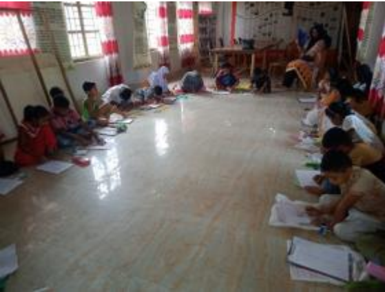
স্বাধীনতার মহান স্থপতি জাতির পিতা বঙ্গবন্ধু শেখ মুজিবুর রহমান ঐর ৪৮তম শাহাদাত বার্ষিকীতে পাহাড়পুর প্রত্নতাত্ত্বিক জাদুঘরে শিশু কিশোরদের চিত্রাংকন প্রতিযোগিতার আয়োজন করা হয়