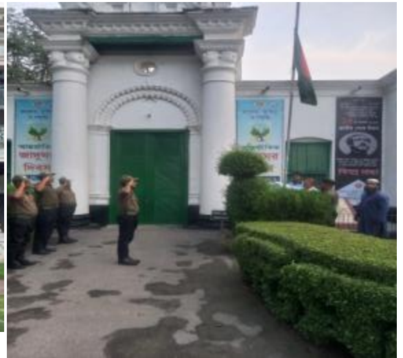
স্বাধীনতার মহান স্থপতি জাতির পিতা বঙ্গবন্ধু শেখ মুজিবুর রহমান ঐর ৪৮তম শাহাদাত বার্ষিকীতে পতিসর রবীন্দ্র স্মৃতি