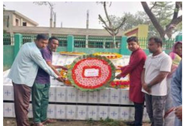
২৬ই মার্চ স্বাধীনতা দিবস উপলক্ষ্যে পাহাড়পুর প্রত্নতাত্ত্বিক জাদুঘরে শহীদ বীর মুক্তিযোদ্ধাদের কবরে শ্রদ্ধাঞ্জলি অর্পণ করা হয়