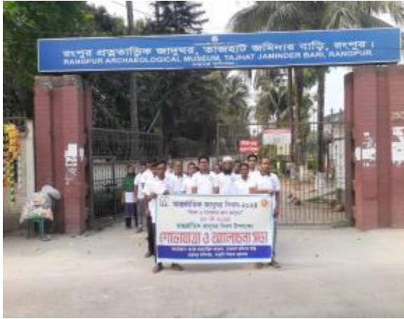
১৮ই মে আন্তর্জাতিক জাদুঘর দিবস উপলক্ষে রংপুর তাজহাট জমিদার বাড়ি জাদুঘর কর্তৃক আয়োজিত শোভাযাত্রার আলোকচিত্র