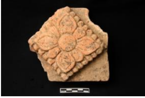
বিরাট রাজার টিবিতে উৎখননে প্রাপ্ত পোড়ামাটির অলংকৃত ইট। ফুলের পাপড়ির নকশা করা এবং সামান্য ক্ষতিগ্রস্ত।