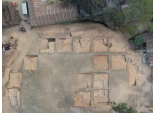
উৎখনন কাজ চলমান অবস্থায় ডোনের মাধ্যমে ধারণকৃত টিবির আংশিক আলোকচিত্র (মধ্যস্থল হতে দক্ষিণ দিক)