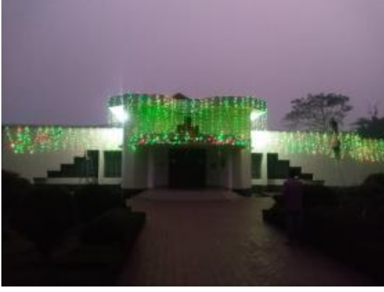
মহান বিজয় দিবস উপলক্ষ্যে পাহাড়পুর প্রত্নতাত্ত্বিক জাদুঘরে আলোকসজ্জা করা হয়