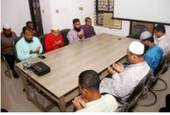
পবিত্র ঈদ-ই-মিলাদুন্নবী (সা.) উপলক্ষ্যে রাজশাহী ও রংপুর আঞ্চলিক কার্যালয়ে আলোচনা সভা ও দোয়া মাহফিলের আয়োজন করা হয়।