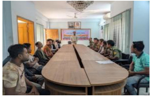
বার্ষিক কর্মসম্পাদন চুক্তি (এপিএ) ২০২৩-২৪ এর লক্ষ্যমাত্রা পূরণের নিমিত্ত রাজশাহী ও রংপুর আঞ্চলিক কার্যালয় কর্তৃক কান্তনগর প্রল্পতান্ত্রিক জাদুঘরে অভিযোগ প্রতিকার ব্যবস্থাপনা বিষয়ে অংশীজনদের সমন্বয়ে সভার আয়োজন করা হয়।