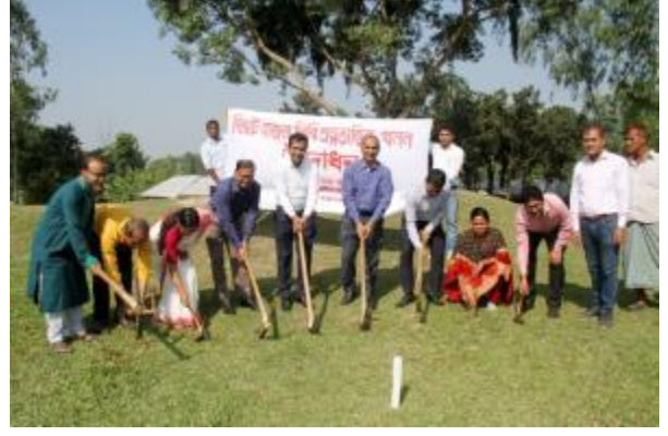
২০২৩-২৪ অর্থ বছরে গাইবান্ধা জেলার গোবিন্দগঞ্জ উপজেলার সংরক্ষিত পুরাকীর্তি 'বিরাত রাজার টিবি' প্রত্নস্থানে প্রত্নতাত্ত্বিক উৎখানের শুভ উদ্বোধনের আলোকচিত্র