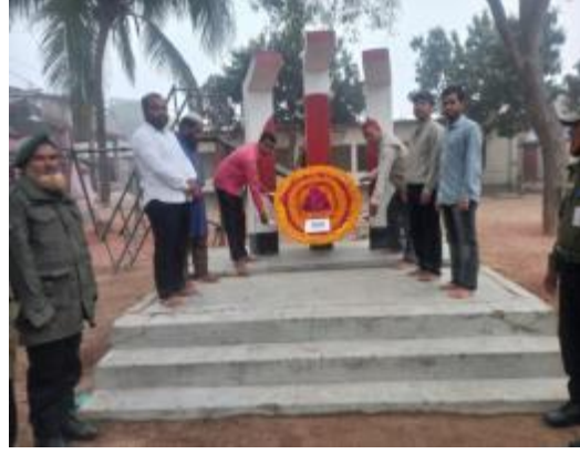
শহীদ দিবস ও আন্তর্জাতিক মাতৃভাষা দিবস উপলক্ষে পতিসর রবীন্দ্র স্মৃতি জাদুঘরের পক্ষে কেন্দ্রীয় শহীদ মিনারে ভাষা শহীদদের প্রতি পুষ্পস্তবক অর্পণ