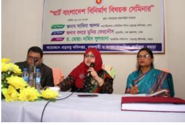
পাহাড়পুর প্রত্নতাত্ত্বিক জাদুঘরে অনুষ্ঠিত “স্মার্ট বাংলাদেশ বিনির্মাণ” বিষয়ক সেমিনারে মহাপরিচালক মহোদয়ের বক্তব্য