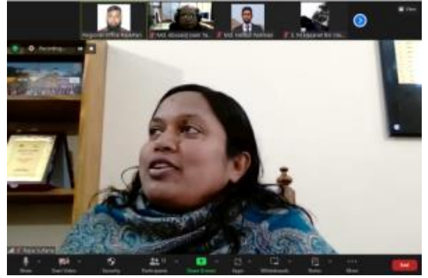
বার্ষিক কর্মসম্পাদন চুক্তি (এপিএ) ২০২৩-২৪ এর লক্ষ্যমাত্রা পূরণের নিমিত্ত রাজশাহী ও রংপুর আঞ্চলিক কার্যালয় কর্তৃক অভিযোগ প্রতিকার ব্যবস্থা ও GRS সফটওয়্যার বিষয়ক প্রশিক্ষণে (অনলাইন/অফলাইন) আয়োজন করা হয়।