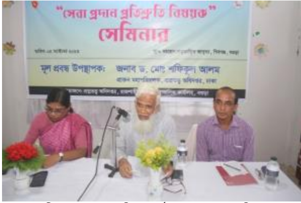
রাজশাহী ও রংপুর আঞ্চলিক কার্যালয় কর্তৃক আয়োজিত 'সেবা প্রদান প্রতিশ্রুতি' বিষয়ে সেমিনার মহাস্থানে প্রল্পতান্ত্রিক জাদুঘরে অনুষ্ঠিত হয়।