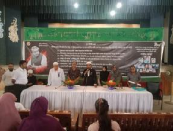
স্বাধীনতার মহান স্থপতি জাতির পিতা বঙ্গবন্ধু শেখ মুজিবুর রহমান ঐর ৪৮তম শাহাদাত বার্ষিকীতে রবীন্দ্র কাছারি বাড়ি, শাহজাদপুরের পক্ষ থেকে তাঁর অস্থায়ী প্রতিকৃতিতে পুষ্পস্তবক অর্পণ করা হয়