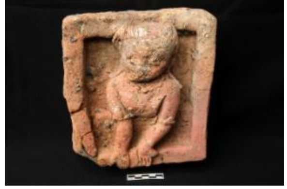
বিরাট রাজার টিবিতে উৎখননে প্রাপ্ত পোড়ামাটির ফলক। খুব সম্ভব জানালা দিয়ে শরীরের উপরিভাগসহ দুহাত বাইরে বের করে রাখা।