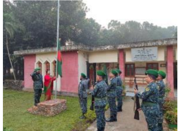
মহান বিজয় দিবস ২০২৩ উপলক্ষ্যে সূর্যোদয়ের সাথে সাথে মহাস্থান প্রত্নতাত্ত্বিক জাদুঘরে জাতীয় পতাকা উত্তোলন করা হয়