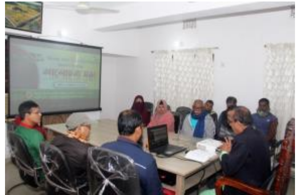
মহান বিজয় দিবস উপলক্ষ্যে রাজশাহী ও রংপুর আঞ্চলিক কার্যালয়ে আলোচনা সভা ও দোয়া মাহফিলের আয়োজন করা হয়