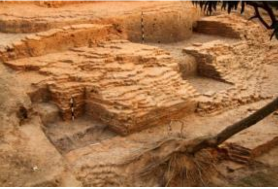
পশ্চিমে মধ্যবর্তী দেয়াল ও প্রার্থনা কক্ষ