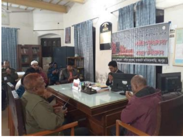
১৪ই ডিসেম্বর শহীদ বুদ্ধিজীবী দিবসে রংপুর জাদুঘরে আলোচনা সভা ও দোয়া মাহফিলের আয়োজন করা হয়