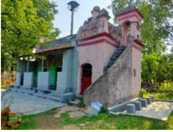
কাজীপাড়া মসজিদের সাধারণ দৃশ্য