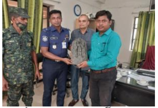
নওগাঁ সদর থানা হতে কালো পাথরের মূর্তি গ্রহণ করছেন কাস্টোডিয়ান, পাহাড়পুর প্রত্নতাত্ত্বিক জাদুঘর