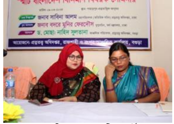
পাহাড়পুর প্রত্নতাত্ত্বিক জাদুঘরে অনুষ্ঠিত “স্মার্ট বাংলাদেশ বিনির্মাণ” বিষয়ক সেমিনার চলাকালে মহাপরিচালক মহোদয় ও আঞ্চলিক পরিচালকের আলাপচারিতার একাংশ (০৯-০৩-২০২৪)