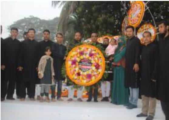
শহীদ দিবস ও আন্তর্জাতিক মাতৃভাষা দিবস উপলক্ষ্যে রাজশাহী আঞ্চলিক কার্যালয়ের পক্ষে কেন্দ্রীয় শহীদ মিনারে ভাষা শহীদদের প্রতি পুষ্পস্তবক অর্পণ