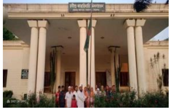
২৬ই মার্চ স্বাধীনতা দিবস উপলক্ষ্যে শাহজাদপুর রবীন্দ্র কাছারি বাড়ি কর্তৃক পতাকা উত্তোলন করা হয়