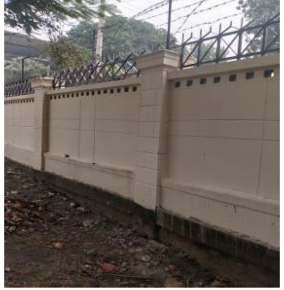
সিরাজগঞ্জ জেলার শাহজাদপুর রবীন্দ্র কাছারি বাড়ির বিদ্যমান সীমানা প্রাচীর মেরামতকরণ কাজের আলোকচিত্র