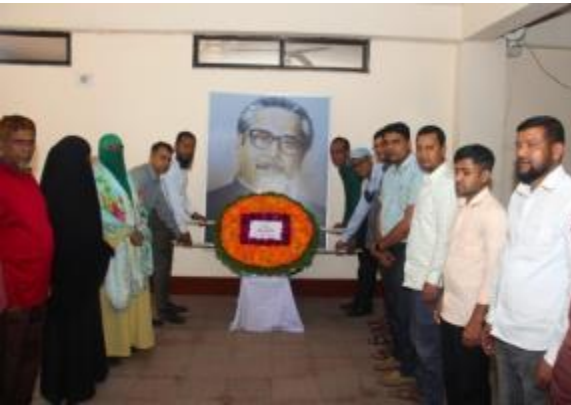
ঐতিহাসিক ০৭ ই মার্চ উপলক্ষে রাজশাহী ও রংপুর আঞ্চলিক কার্যালয়ে জাতির পিতা বঙ্গবন্ধু শেখ মুজিবুর রহমান ঐর অস্থায়ী প্রতিকৃতিতে পুষ্পস্তবক অর্পণ করা হয়