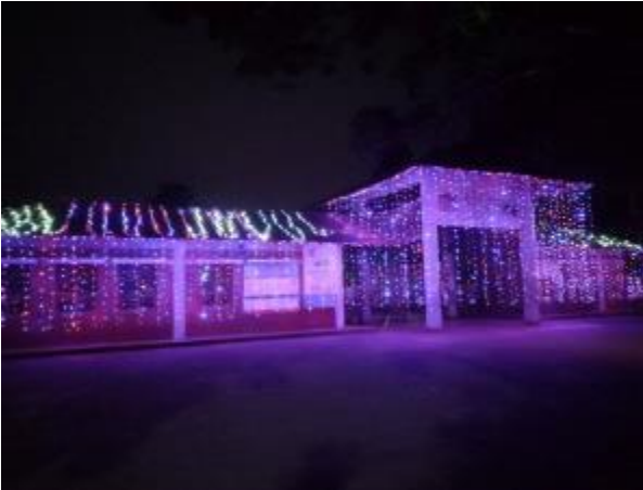
মহান বিজয় দিবস উপলক্ষ্যে মহাস্থান প্রত্নতাত্ত্বিক জাদুঘরে আলোকসজ্জা করা হয়