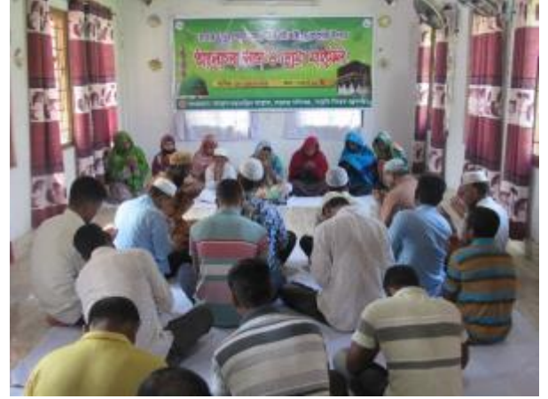
পবিত্র ঈদ-ই-মিলাদুন্নবী (সা.) উপলক্ষ্যে মহাস্থান প্রত্নতাত্ত্বিক জাদুঘরে আলোচনা সভা ও দোয়া মাহফিলের আয়োজন করা হয়।