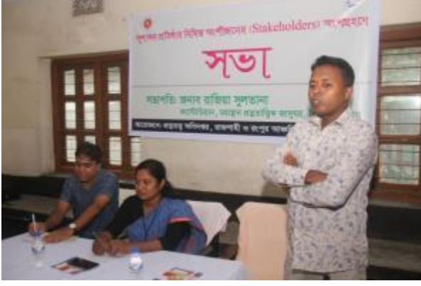
বার্ষিক কর্মসম্পাদন চুক্তি (এপিএ) ২০২৩-২৪ এর লক্ষ্যমাত্রা পূরণের নিমিত্ত রাজশাহী ও রংপুর আঞ্চলিক কার্যালয় কর্তৃক গোকুল মেধ প্রদ্রস্থানে সুশাসন প্রতিষ্ঠার নিমিত্ত অংশীজনের অংশগ্রহণ সভার আয়োজন করা হয়।