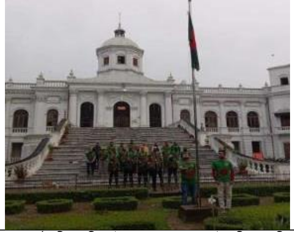
২৬ মার্চ স্বাধীনতা দিবস উপলক্ষ্যে রংপুর তাজহাট জমিদার বাড়িতে পতাকা উত্তোলন করা হয়