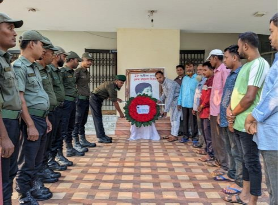
শেখ রাসেল দিবস উপলক্ষ্যে কান্তনগর প্রত্নতাত্ত্বিক জাদুঘরে তাঁর অস্থায়ী প্রতিকৃতিতে পুষ্পস্তবক অর্পণ

১৮ই অক্টোবর ২০২৩ শেখ রাসেল দিবস উপলক্ষ্যে রাজশাহী ও রংপুর আঞ্চলিক কার্যালয়সহ অন্যান্য কার্যালয়ে বিভিন্ন পদক্ষেপ গ্রহণ করা হয়। তন্মধ্যে অস্থায়ী প্রতিকৃতিতে পুষ্পস্তবক অর্পণ, আলোচনা সভা ও দোয়া মাহফিল উল্লেখযোগ্য।