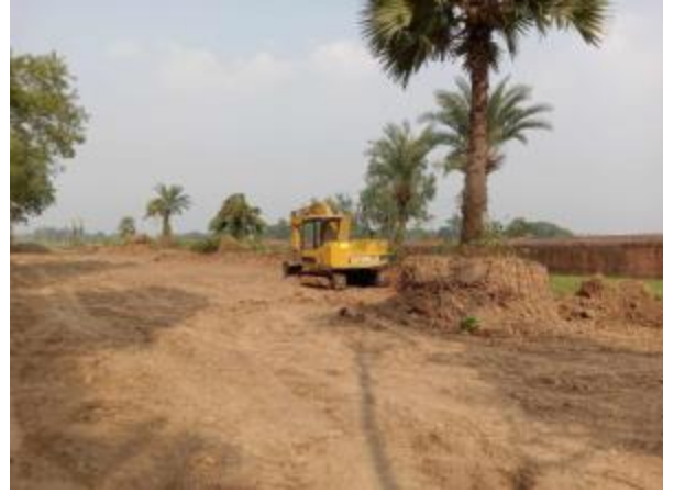
নওগাঁ জেলার বদলগাছী উপজেলার পাহাড়পুর বৌদ্ধ বিহারের পশ্চিমে মাটি সমানকরণ কাজের আলোকচিত্র