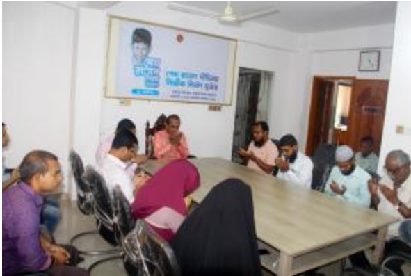
শেখ রাসেল দিবস উপলক্ষ্যে রাজশাহী ও রংপুর আঞ্চলিক কার্যালয়ে দোয়া মাহফিলের আয়োজন করা হয়