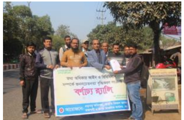
বার্ষিক কর্মসম্পাদন চুক্তি (এপিএ) ২০২৩-২৪ এর লক্ষ্যমাত্রা পূরণের নিমিত্ত রাজশাহী ও রংপুর আঞ্চলিক কার্যালয় কর্তৃক তথ্য অধিকার আইন ও বিধিবিধান সম্পর্কে জনসচেতনতা বৃদ্ধিকরণের নিমিত্ত প্রচার কার্যক্রম পরিচালনা করা হয়।